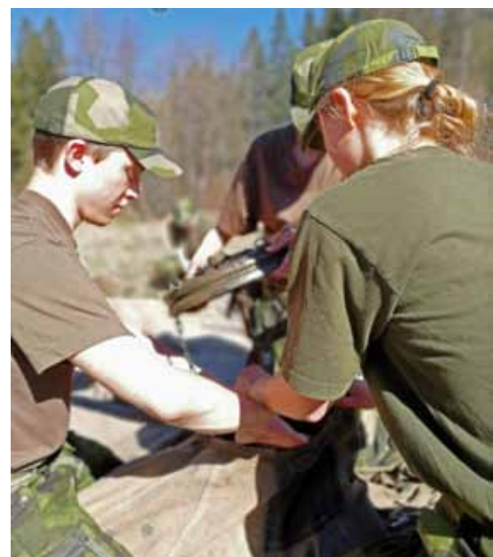
Drill i tältslagning