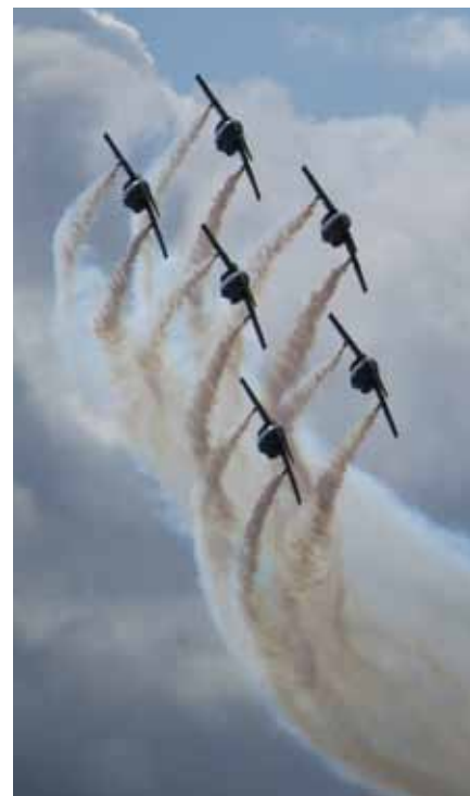
Team 60