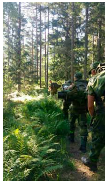
På marsch ut i fält för att bygga förlägningsplats