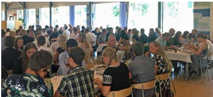
Alla samlade till avslutningsmiddag, med lite hemlängtan och massor med minnen

Under torsdagen byggdes det både på med försvarsupplysning och flygtema, nämligen genom att flyga med Tp84 Herkules till F 17 och därefter besöka Marinmuseet för en specialguidad tur. Där möttes kursen även upp av personal från 1. Ubåtsflottiljen som föreläste om Marinen och framför allt hur det är att arbeta på en ubåt vilket fängslade många av åhörarna av kursen. Efter dessa lite mer fysiskt lågintensiva aktiviteterna drog det första fältdygnet igång tätt följt av sjukvård och segelflyg.