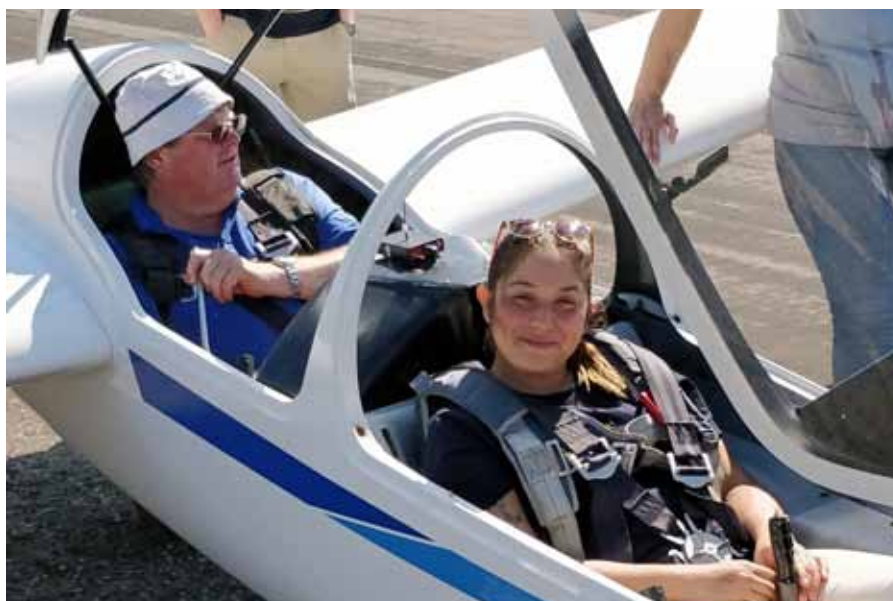
Så var det dags att få segelflyga, spännande