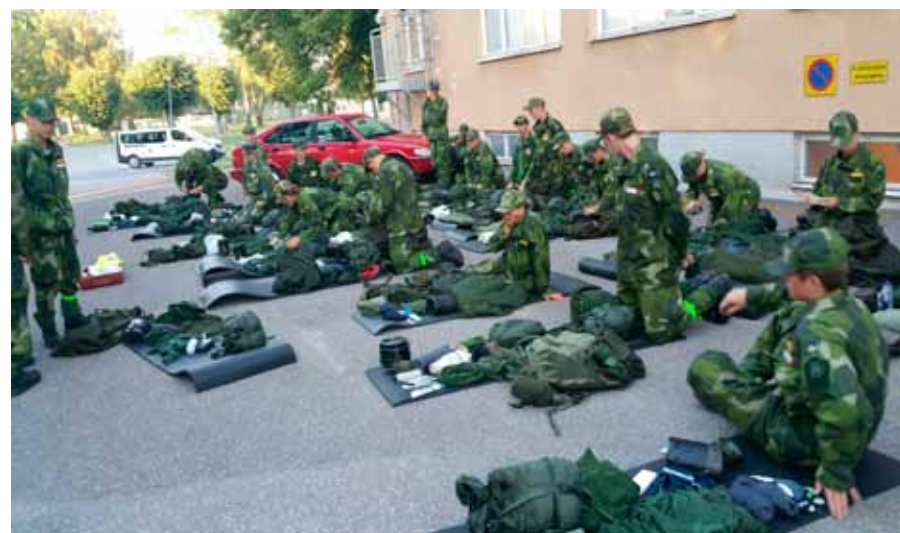
Inventering och utbildning i militära uniformer och materiell

Under ett av segelflygmomenten så skedde det tyvärr en trafikolycka, en personbil blev påkörd av en lastbil, utanför flygfältet där det satt några elever i vänteläge. Tack vare ett snabbt och rådligt ingripande av