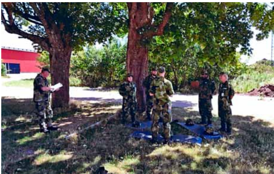
Elevledd övning Hjälms 90

Kursen avslutades med avrustning, god middag på restaurang i Halmstad tillsammans med skolledningen, gemensam summering gjorda er-