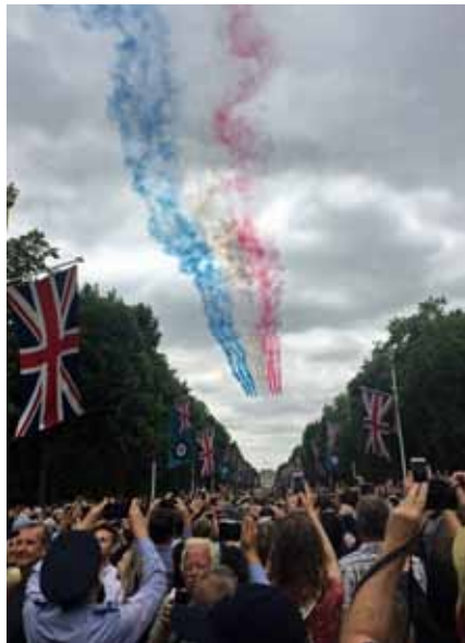
En överflygning av London som vi aldrig glömmet

Vi inkvarterade i studentrum på Brunells Universitet i utkanten av London, detta blev vårt hem de kommande dagarna innan vi skulle vidare på vår resa i England. I London anslöt även ungdomar från England, Hongkong samt Ukraina. Tillsammans åkte vi dagen efter in till London för att delta i firandet av RAF 100 år med tillhörande parad samt överflygningar. Just överflygningen var något väldigt speciellt då det var över 100 flygplan och helikoptrar som deltog,