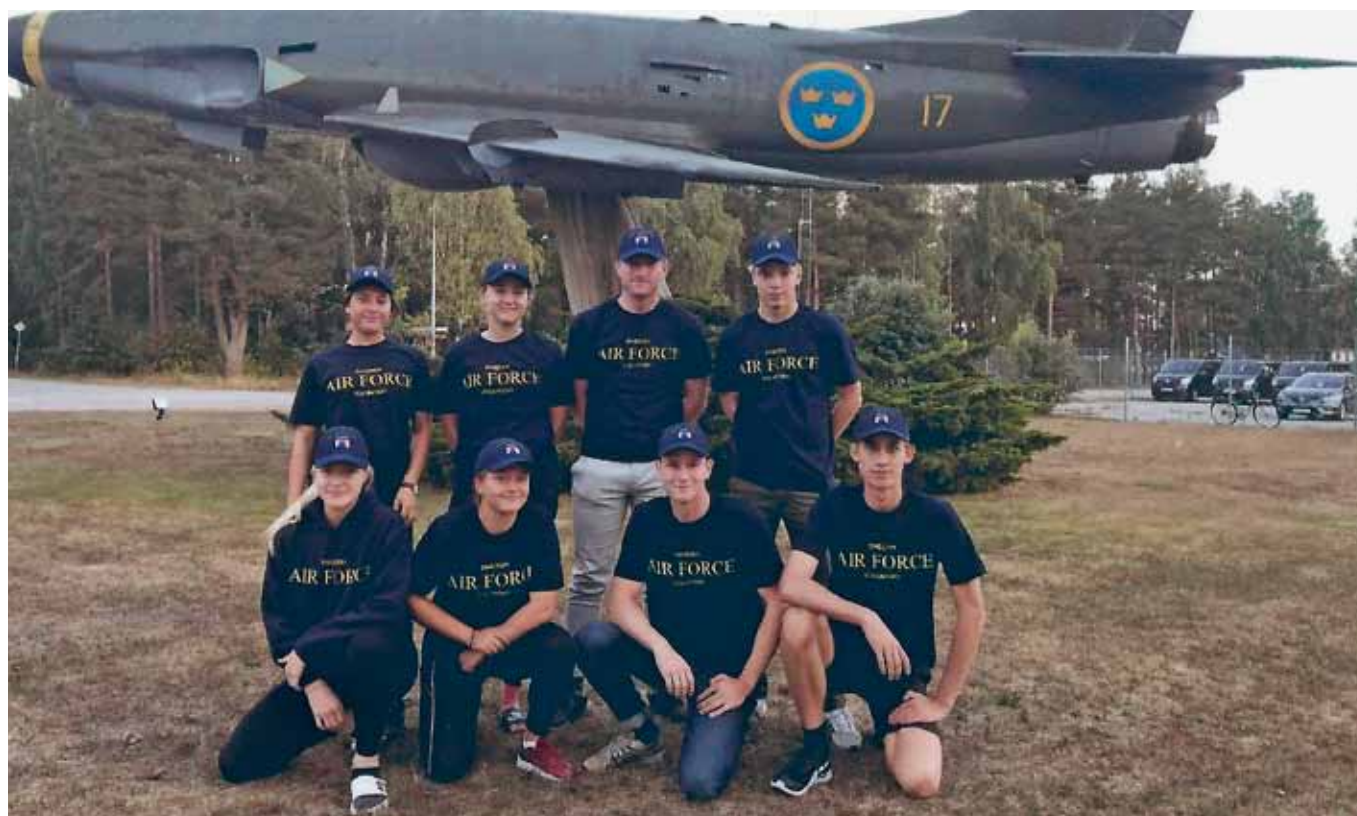
FVRF S båda lag på F 17 före avresa till HvSS