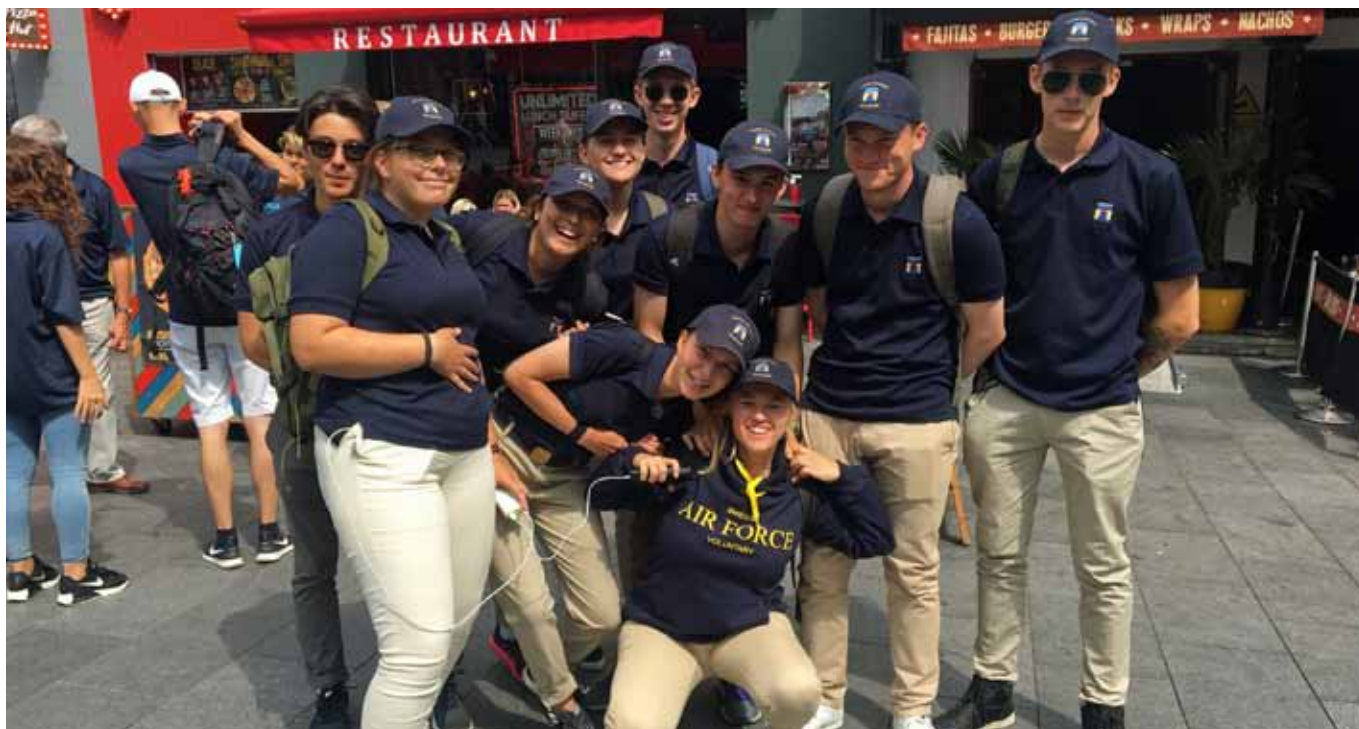
Gruppen under en av dagarna i London

samt lära oss mer om landets historia och kultur. Vi besökte bland annat London Eye, RAF egna kyrka, RAF Club, Westminster Abbey, Tower, Tower bridge, battle of Britain bunker, Churchill War Rooms samt tog en båtutture på floden. Vi provade på hur många svenska ungdomar som får plats i en brittisk telefonkiosk och konstaterade att svaret på den frågan är 10 ungdomar. En glad överraskning vid vårt besök på parlamentet var att vår guide var från Sverige, visningen blev på engelska trots allt då våra brittiska värdar var med. Under den