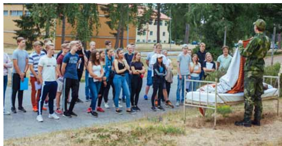
Bädda säng, inte så lätt som man tror, men med lite utbildning blev det bra

Halvägs in i kursen har vi ett roterande stationsystem i vilket en grupp flyger motorflyg med Blekinge flygklubb och under ett av passen upptäcker en grupp en mindre skogsbrand i Brunnskogen i vilken en grupp nyligen avslutat orienteringen för ungdomsidrottsmärket. Räddningstjänsten kunde snabbt släcka och avvärja. En annan grupp har simning 200 m på Brunnsbadet med efterföljande minigolfturnering, stationen kändes svalkande för varma fötter. Skjutning med ungdomsvapnet Gevär 22 Long genomförs och med jättefina träffbilder. En bit in i andra veckan får kursen se flottiljens stridsflygplan och prata med de som jobbar med planen. Eleverna besökte och uppskattade informationen och möjligheten att prova på olika moment inom F 17 räddningstjänst, R 3.