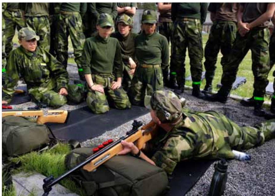
Genomgång på Ungdomsvapen .22 före skjutning

Fältdygn två startade med att hela förläggningen revs innan frukost. Hela