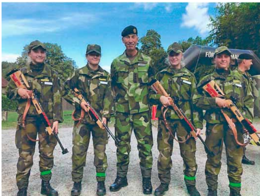
Flygvapenfrivilliga region syds flicklag "G.I. Jane's" tillsammans med ÖB

Ett mycket regnigt Norsborg välkomnade de båda lagen till HvSS under sen fredagseftermiddag. Under lördagskvällen hade ungdomarna slutfört tävlingens första dag och samtliga moment med bravur. Tillsammans med 63 andra lag, har ungdomarna under lördagen tävlat i olika grenar