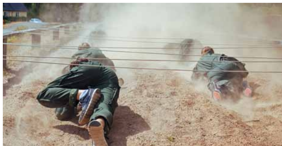
Hinderbanan, här kröps det så det rök om eleverna

Mot slutet av kursen tillämnar vi tidigare kunskaper i skjutning, samband, förläggningstjänst, ledarskap och sjukvård i en kamratmarsch med olika stationer och olika moment. Sista kvällen avslutar vi med en tre rätters middag som förtroendevalda eleverna önskat samt mingel med snacks. Mellan måltiderna och efter