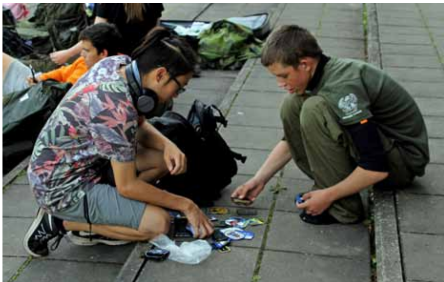
Här gäller det att förhandla och byta till sig de rätta märken