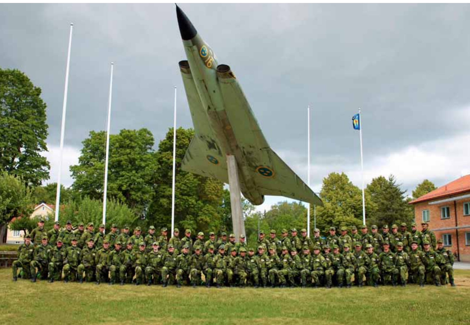
Sommarkurs Mitt kursfoto