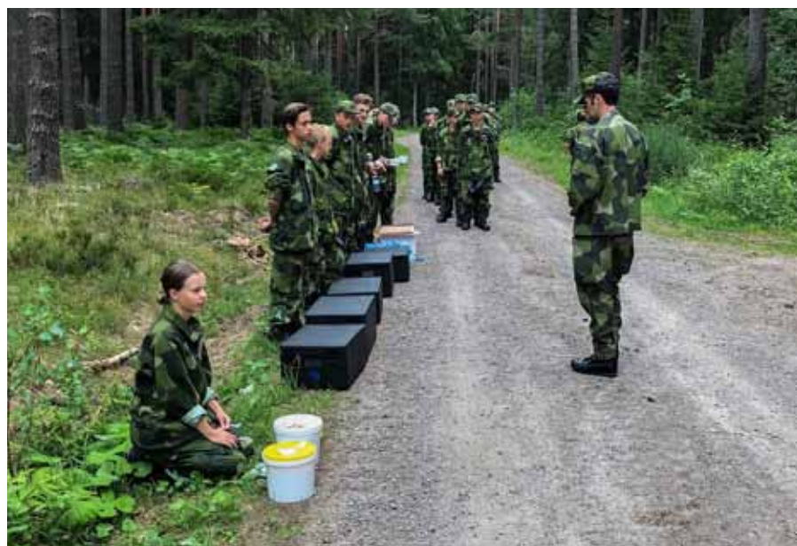
Fältmässig utspisning, "ordning och reda" och en efterlängtat god lunch

Efter godkänd kurs kunde deltagarna tillgodoräkna sig kursinnehållet i den regionala ungdomsverksamhetens utbildningstrappa. Inför hösten kallas eleverna till start av nästa kurssteg, Fortsättningskurs, FK.