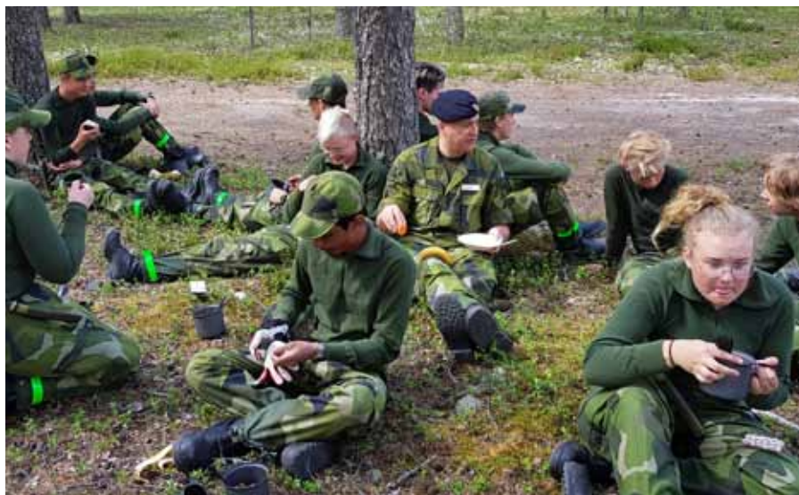
Flygvapenchefen, genmj, Mats Helgesson på lunch med eleverna

med att sova i tält 20. Efter rivning av förläggning och frukost var det dags för den sista etappen av fälttävlan. Dag två innebar stationer där gruppernas samarbete prövades och strapatsen avslutades med marsch tillbaka till kasernområdet där all materiel skulle vårdas. När all materiel noga vårdats och visiterats var det äntligen dags för en efterlängtdusch och därefter avrundades kvällen med tacobuffé och prisutdelning. Morgonen därpå avslutades kursen med återlämning av all materiel, utvärdering och sist men inte minst utdelning av diplom för genomförd sommarkurs.