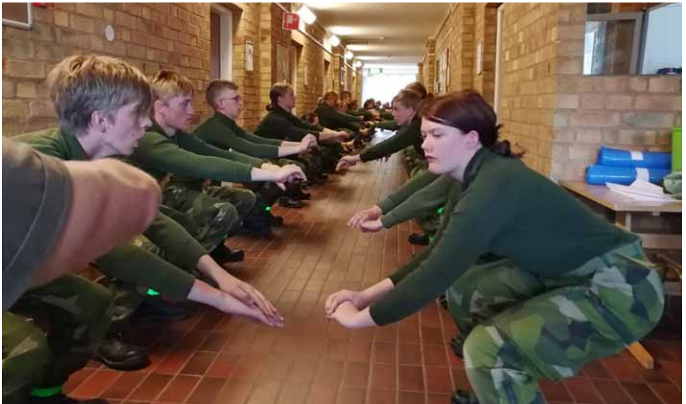
BRÅK, det gäller att bygga upp muskler och leder