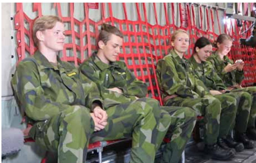
Så här bekvämt flyger man i Tp 84