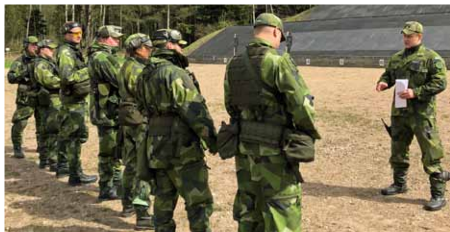
Kadett som övningsledare går igenom övningen

prov, vapenhantering och säkerhetsbestämmelser för automatkarbin. Efter denna kurs kommer de godkända eleverna att erbjudas ytterligare utbildningar mot slutmålet att kunna vara instruktör på vapen AK 5.