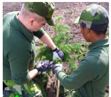
Här tillverkas "Ruska lång" till tältförläggningen