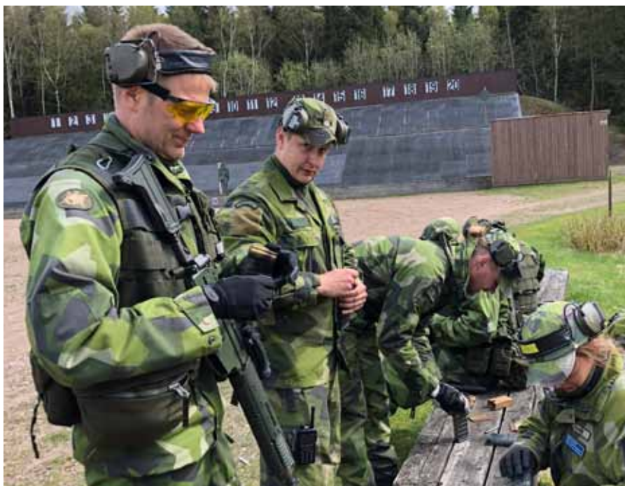
Mycket am behövdes vid de många och varierande övningarna

Kursens innehåll och upplägg var fint upplagd där teori varvas med praktik. Den inledande teoretiska utbildningen genomförs vid FMST i Halmstad på R3 avdelningen. De praktiska momenten genomförs på Önnarps övningsområde på Hallandsåsen. Elever ur FVRF examineras genom delmoment 16 som avser kompetensprov, som innehåller teoretiskt