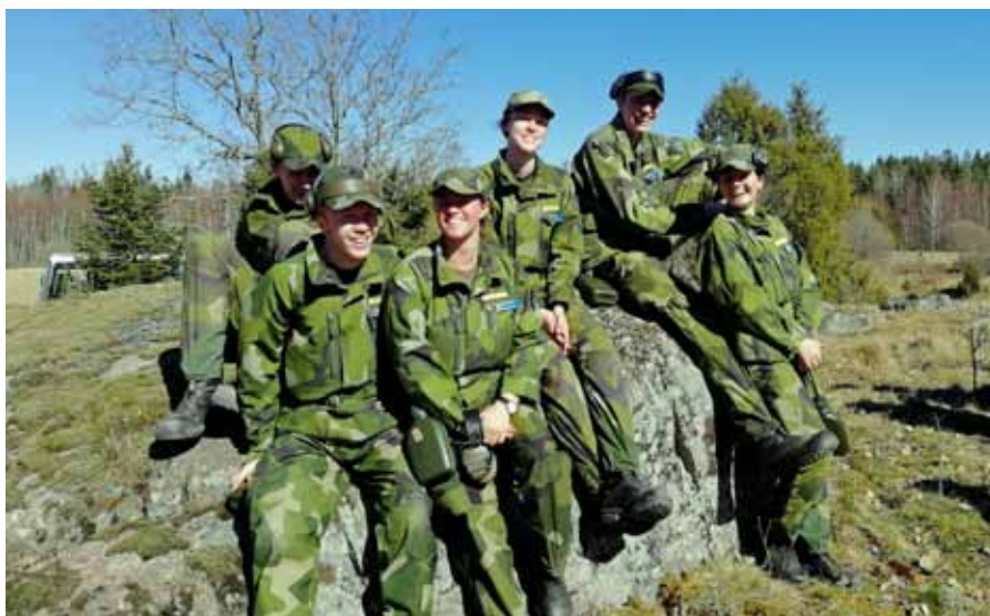
I väntan på sprängförevisning - Foto: Maria Melin.

För att vi ska lyckas ta UIM behöver det orienteras. Beroende på hur man har lyckats på skjutningen under lördagen orienterar man på söndagen. Det är med andra ord en fin morgon utanför Fysborgens på MSS Kvarn, där instruktörsaspiranten håller genomgång inför stundande aktivitet. Det tar inte lång tid förrän samtliga beger sig ut i terrängen på området och här får den enskilde nytta av fredagskvällens viktiga repetition. Det är nämligen skarpskjutning i området och därför krävs det av samtliga att inte röra sig på förbjudet område. Glädjande nog kommer samtliga av oss slutligen i mål. Innan den efterlängta lunchen nöts först avståndsbedömning in, som faktiskt kommer väl till nytta under de ungdomstävlingar vi får delta i både nationellt och internationellt.