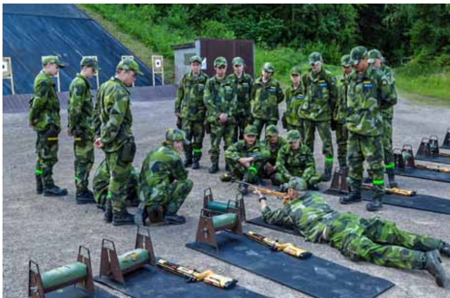
Första utbildningspasset i vapentjänst, så här ser skjutställningen ut

Eleverna och föräldrarna förbereddes upplysningsvis på denna mentala målbild redan i kursantagningen. De upplystes om att under kursen alltid vara en vinnare, inom ramen för ett ständigt pågående lagarbete inom plutonerna. Varje elev måste också ha en ödmjuk attityd mot omgivningen och alltid vara beredd att hjälpa kamraterna samtidigt som de själva kan