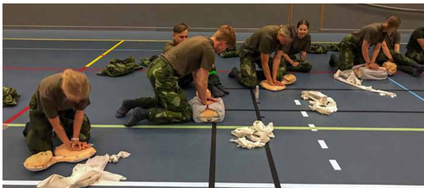
Här övar vi "Första hjälpen", lärorikt och viktigt att kunna

huvuddelen av kursen genomfördes. Bara den som är väl förberedd har möjlighet att improvisera. Efter centralt planeringsinternat i februari rekryterades kursens funktionärer. Arbetslagets planering för kursen