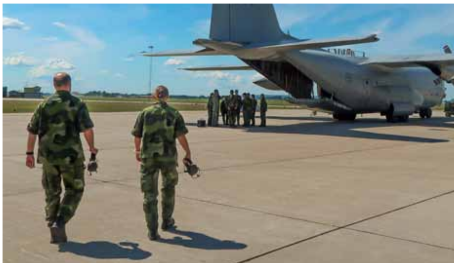
Eleverna på väg till flygtur med TP 84

Torsdagen erbjöd studiebesök på STRIL varvat med flygning med SK-60 för att vid lunch ilasta bussen mot Karlsborg. Framme i Karlsborg väntade besök hos TUAV och genomgång av UAV03. Därefter var det transport till Kråks skjutfält där elever och kursledning möttes upp av en baskerprydd man med tjänsteminen väl monterad. Kursledningen lämnar över befäl och elever till kollegan från K3 och en 24 timmar lång strapats inleds. Strapatsen får dock ett abrupt slut när kursledningen återkommer