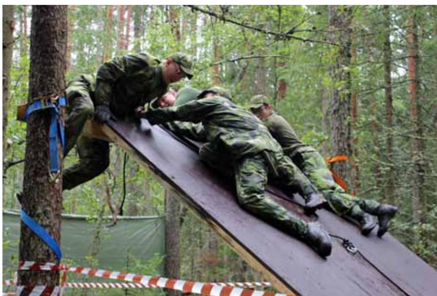
Här prövas gruppens styrka och samarbetsförmåga