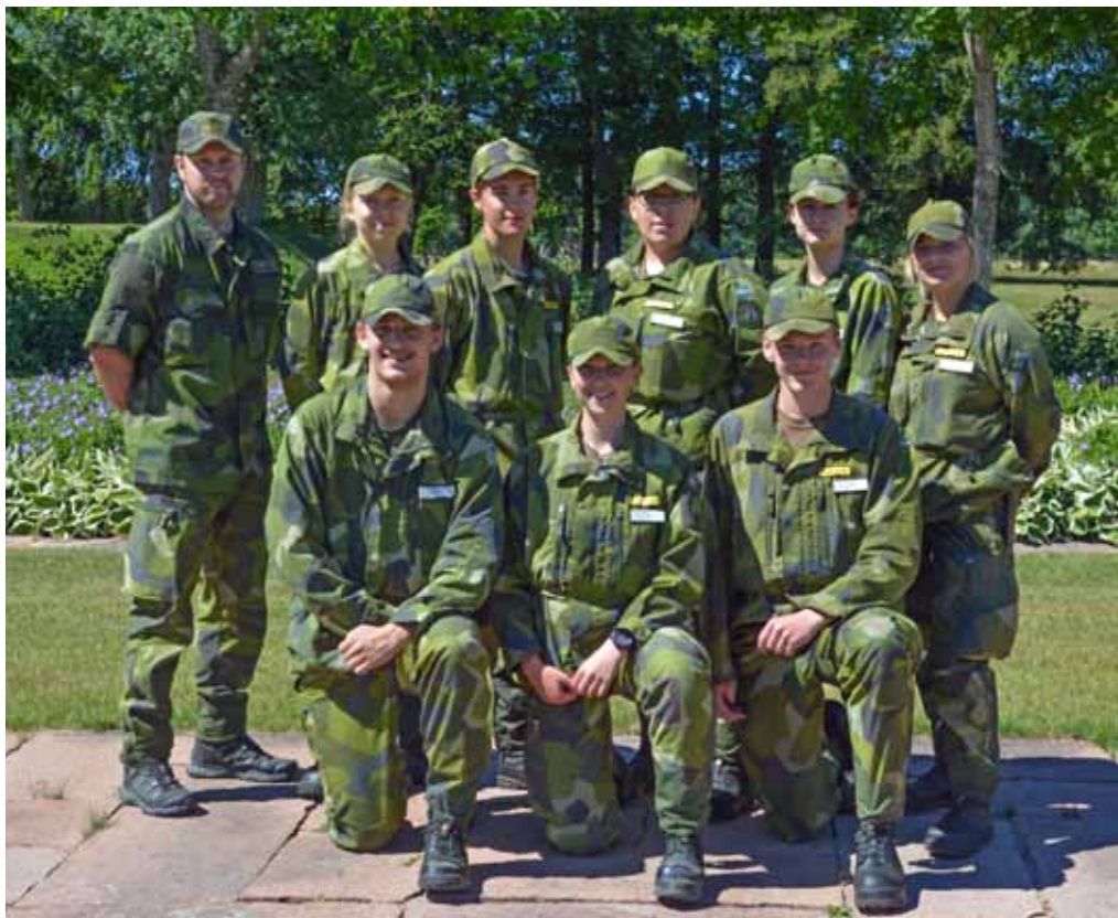
Eleverna Air Camp uppställda för kursfoto

Magnus Nyström kurschef Air Camp