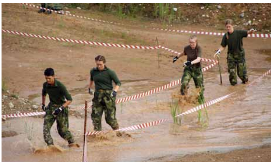
Här var det vått

Efter frukost på tisdagen påbörjades det första momentet som var att lagen på tid skulle sätta ihop ett antal delar till en kub. Resultatet av detta gav dem sedan möjlighet att välja sin starttid på onsdagsmorgonen. Under dagen fick vi alla möjlighet att besöka militärmuseet i Valga som bjöd på en blandning av olika länders militära saker men även övriga blåljusfunktioner i Estland. Det fanns en museiaffär där det blev ett antal fynd för deltagarna. Dagen avslutades med ett tävlingsmoment där lagen skulle köra capture the flag med soft airgun. Detta blev ett uppskattat inslag med högt adrenalinpåslag.