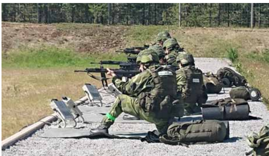
Skjutträning med AK 5, alla godkända

Vi har även byggt latrin, matställe, tvättställe och en dusch av skogens virke, maskeringsnät och snöre. I förläggningens gränsszon har vi grävt eldställningar åt alla riktningar för att kunna försvara lägret mot väpnade attacker. Vi är sjutton personer med blandad ålder, bakgrund och erfarenheter som befinner oss någonstans i skogarna kring F 21 utanför Luleå,