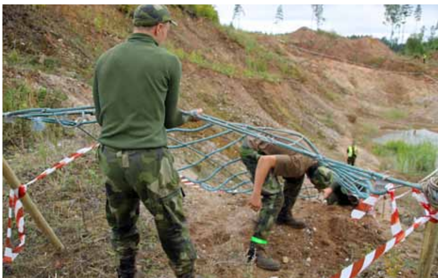
Snabbt ska det gå och en hjälpande hand är inte fel