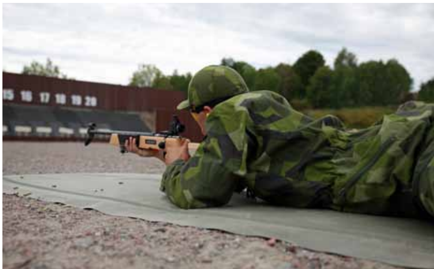
Rätt skjutställning, rätt siktat – det blev 10 poäng!

Nu väntar sängbäddning, lunch och sen äntligen få ut den där uniformen och börja klä på sig den. Men först väntar en genomgång av all materiel, både vad det är och hur många plagg eller del varje elev ska ha, kasernkorridorerna är fyllda med ungdomar, instruktörer och kläder. Ett tränat öga kan se den blivande ordningen, för någon annan skulle det nog se ut som ett fullständigt kaos. Kvällen smyger sig så sakta in på LSS, lugnet börjar lägga sig i kasernen och på logementen, men i morgon väntar en ny dag, med revej klockan sex på morgonen. För ungdomarna väntar nu ytterligare tio dagar på LSS. Exercis, sjukvård, flygning, förläggningstjänst och mycket mer kommer fylla dessa dagar innan det är dags att säga adjö till alla sina nyfunna vänner.