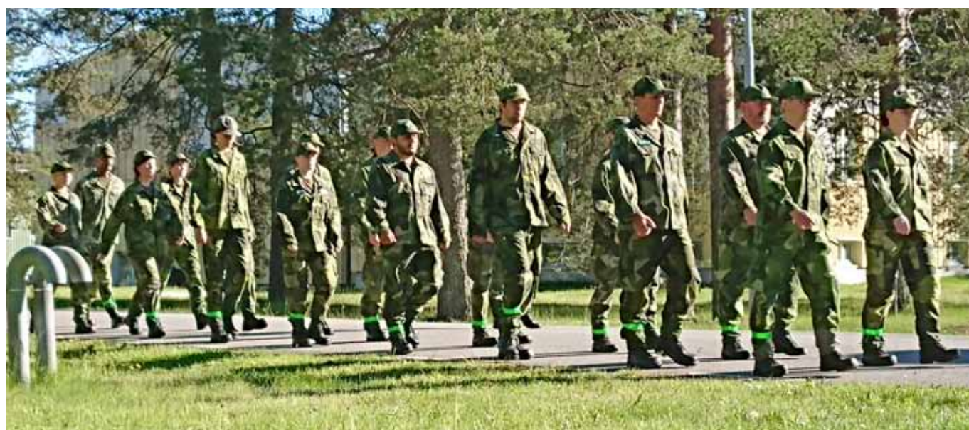
Ett av de första exercispassen, går åt rätt håll

till 22.00 varje dag, med korta pauser för matintag och toalettbesök. Vi har sovit i skrangliga våningssängar och legat vakna till grannens snarkningar. Vi har testat våra skyddsmasker i tångaskammare, spenderat 40 arbetstimmar på skyttebanan, vi har grävt och byggt och marscherat och patrullerat. Vi har gjort fler fel på två veckor än vi vanligtvis gör på ett år. Vi har riktat vapnet i fel riktning, glömt att hålla tummen i magasinsbrunnen vid blindavfyrning, glömt lödder i handfattet och damm ovanpå rören i korridoren vid morgonvisitationen. Vi har haft för mycket skäggstubb, glömt att ta ur örhängena och misslyckats