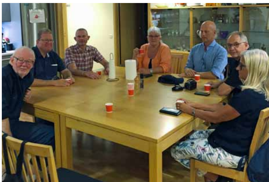
Delar av FVRF S under kaffepaus på kansliet

Flygdagsprogrammet som sträckte sig från kl 0800 på morgonen till kl 1700 på eftermiddagen innehöll som vanligt, en mångfald av ALLT som en flygintresserad kan önska och begära av en flygdag.