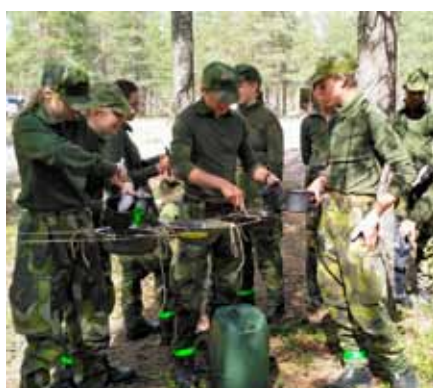
Diskmaskin modell fält

med att sova i tält 20. Efter rivning av förläggning och frukost var det dags för den sista etappen av fälttävlan. Dag två innebar stationer där gruppernas samarbete prövades och strapatsen avslutades med marsch tillbaka till kasernområdet där all materiel skulle vårdas. När all materiel noga vårdats och visiterats var det äntligen dags för en efterlängtdusch och därefter avrundades kvällen med tacobuffé och prisutdelning. Morgonen därpå avslutades kursen med återlämning av all materiel, utvärdering och sist men inte minst utdelning av diplom för genomförd sommarkurs.