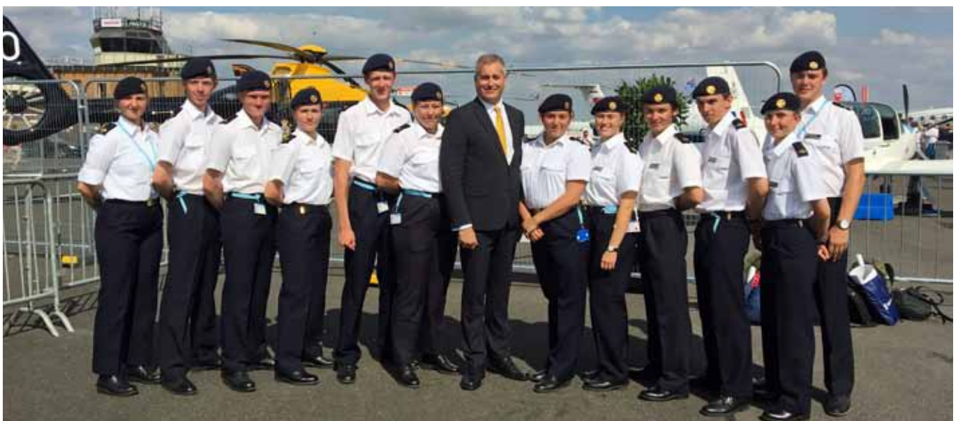
Här är gruppen uppställd med Flygvapenchefen, Mats Helgesson i mitten

Efter RIAT begav vi oss åter igen tillbaka till London för att under några dagar ta del av Londons sevärdheter