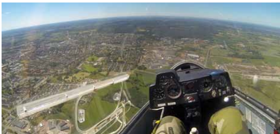
Så vackert allt blir "så här från ovan" jag ska nog bli pilot

Under ett av segelflygmomenten så skedde det tyvärr en trafikolycka, en personbil blev påkörd av en lastbil, utanför flygfältet där det satt några elever i vänteläge. Tack vare ett snabbt och rådligt ingripande av