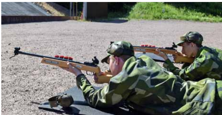
Äntligen dags för de första skotten

förvänta hjälp av sin omgivning. Just vikten av lagarbetet och att utnyttja gruppledammarnas egenskaper återkom som en strimma genom hela