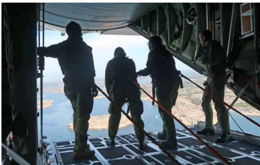
Första parkett på Tp 84 ramp, vilken utsikt