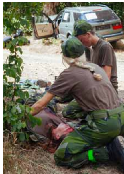
Övning i att ta hand om skadad, viktigt att kunna

Kursen byggs vidare på med grunder i sjukvård och förbandsläggning samt hur vi hanterar kniv, yxa och såg. Med dessa nya kunskaper ger vi oss till brandövningsplatsen och har förläggningstjänst med övernattnig. Konstant solsken och omkring 30 graders värme hela tiden kräver mycket vatten och bra energi. Matpåsar vi har med oss kallas för "Rations" och humöret är på topp! Laget framför jaget. Under kursen arbetar vi med ledarskap och gruppdynamik. En grupp hjälps åt att komma runt hinderbanan iklädda motoroverall och handskar medans en annan några meter bort spelar en variant av lagvolleyboll, alla skall röra bollen innan den skickas över.