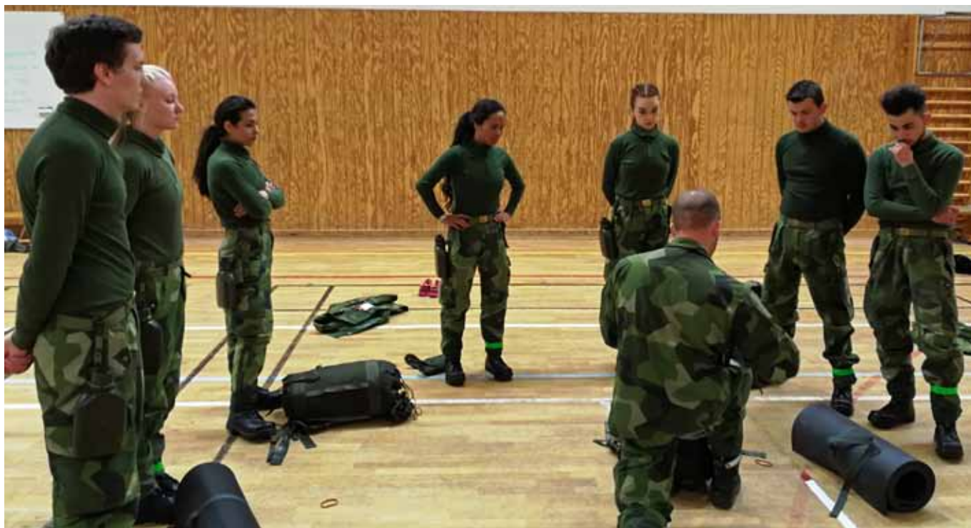
Eleverna samlade för genomgång av militär utrustning