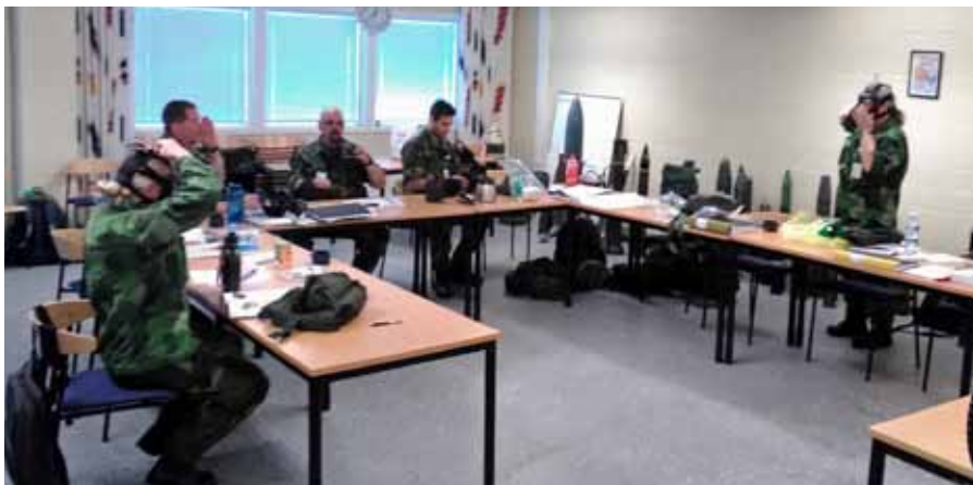
Elevledd övning Skyddsmask 90

farenheter, utvärdering och sist en trevlig avtackning från både elever till kursledning och vice versa.