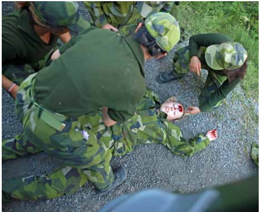
Sjukvårdsutbildning, ser allvarligt ut, tur det var övning