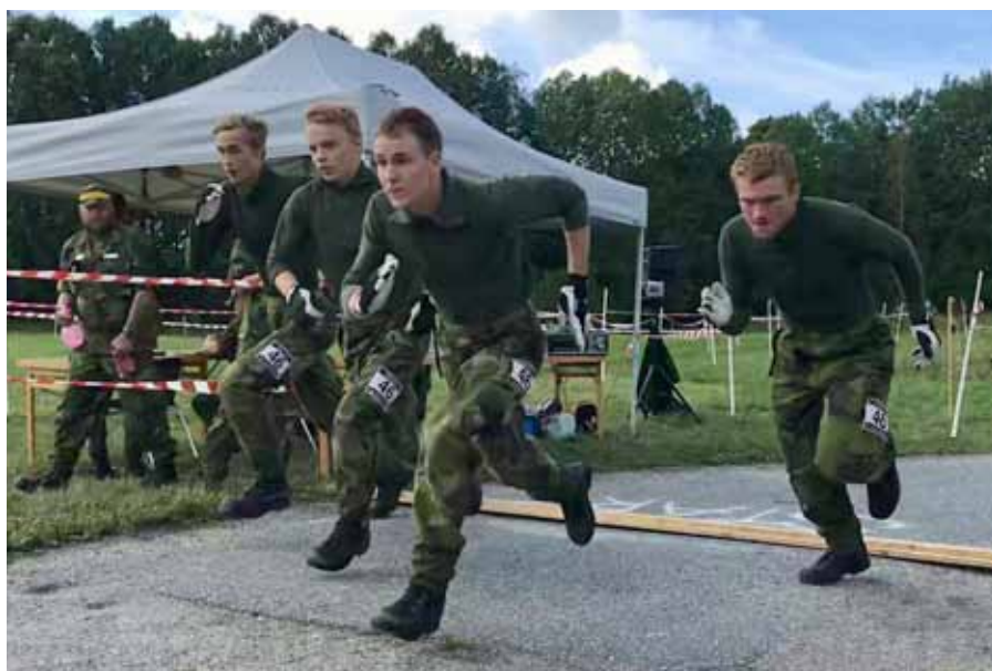
"Flyboys" levde upp till sitt lagnamn och flög fram vid starten av hinderbanan.

Lagens startplaceringar inför söndagen och tävlingens sista dag, utgjordes av de sammantagna poäng som lagen intjänat under föregående dag. Ju högre poäng ett lag har, desto tidigare startar de under söndagens jaktstart. För "Flyboys" såväl som för "G.I. Jane's" var de båda lagens starttider till fördel. Utrustade med varsin lag-GPS kunde två nervösa och förhoppningsfulla lagledare följa lagen under dagens "par- och lagorientering". Som bevis på en otrolig viljestyrka inom de båda lagen, förändrades deras lagplaceringar kort efter start. "Flyboys" såväl som "G.I. Jane's" passerade flertalet föregående lag, långt innan de nått fram till snabbskyttet, som utgjorde en viktig milstolpe och utgångspunkt för tävlingen. Efter endast tre straffrundor som tilldelats de efter snabbskyttet, fortsatte "Flyboys" sin väg mot målgången och slutade på en andraplats bland pojklagen. "G.I. Jane's" lät sig inte besegras över de tio straffrundor som de erhållit i samband med snabbskyttet, utan