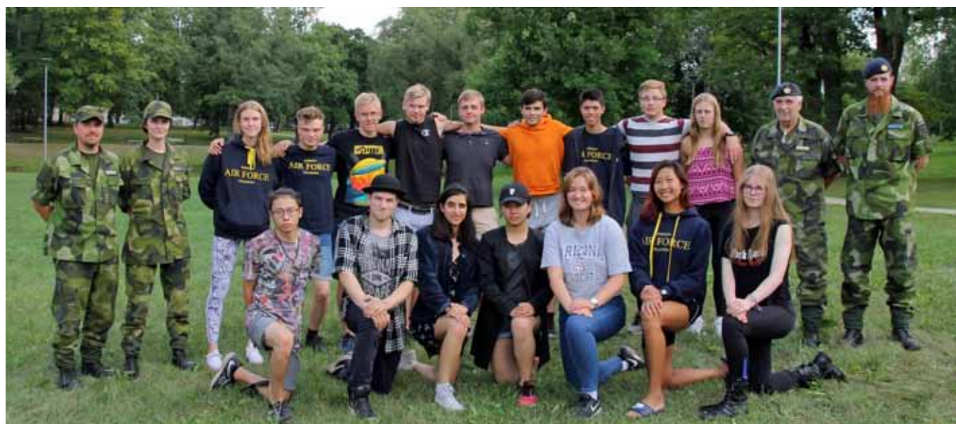
Ett färgglatt och tävlingsinriktat ungdomslag i Estland