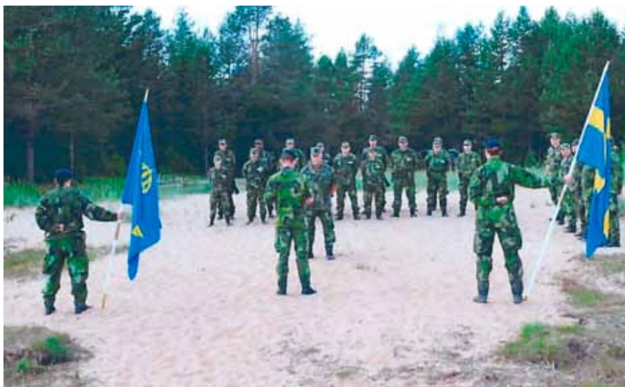
Kursen uppställda för att meddelas "Soldaterinran" av C F 21

och tillsammans har vi fattat rationella och kloka beslut. Vi har surat och skrattat och varit frustrerade och peppat varandra. Tillsammans har vi klarat alla prövningar och uppgifter. Nu är denna utbildning avslutad och vi alla drar iväg åt olika håll för att fortsätta med respektive specialistutbildningar i form av mc-ordonnanser, sjukvårdare, hundförare, bandvagnsförare, stabsassistenter, fältkockar