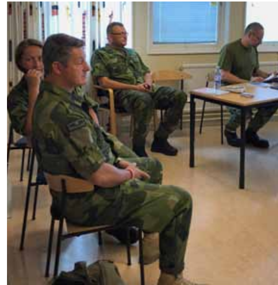
Skolchefen följer en elevövning

Eleverna på IK G kom från fem olika frivilliga försvarsorganisationer och delades in i två grupper med två handledare över tiden. En mindre del av kursen genomfördes i helklass i form av utbildning i pedagogik, ledarskap, värdegrund och verksamhets säkerhet medan resten av utbildningen genomfördes som trupp utbildningspass (TU-pass) i två grupper om sex elever.