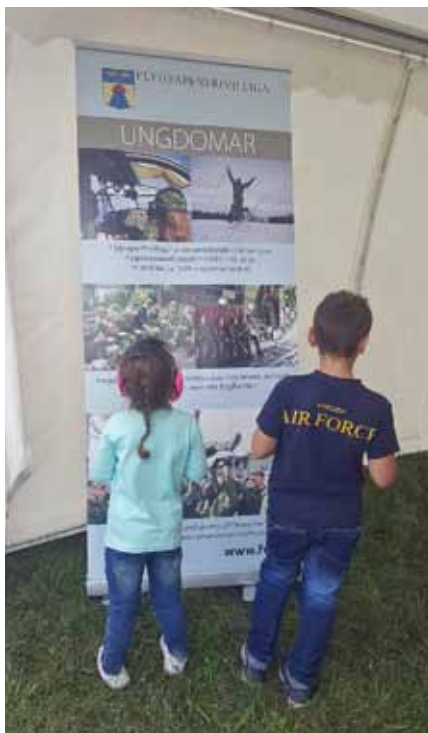
Det här är något för oss ungdomar, om några år

Väl framme på gamla F 16, nu LSS blev vi välkomnade med program, allmän information och hörselskydd. I en av utställningsmontrarna träffade vi medlemmar från FVRF Mitt som där delade ut information om FVRF och övrig frivillig försvarsverksamhet.