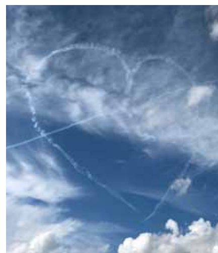
Team 60 med ett hjärtligt farväl