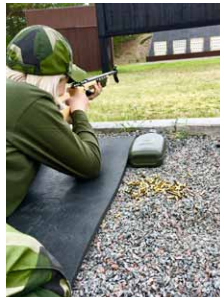
Dags för skott, gick bra, många träffar i den svarta prick

Den första veckan var därmed avklarad och nu väntade fältdygnet där de nya kunskaperna skulle testas. Kvällen innan fältlastning ägnades åt förberedelser som packning, vård av kängor och fötter. Direkt efter frukost marscherade alla ut i skogen och påbörjade förläggningstjänst