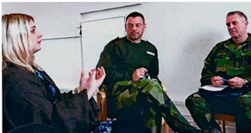
Gruppdiskussion inom ledarskapsområdet

För att lösa detta projekt avser FVRF anställa en projektledare. Det betyder att FVRF söker en intresserad projektledare som har: