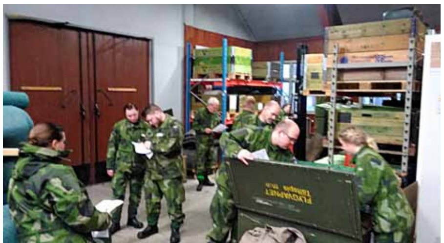
Elevövning i materiell-tjänst