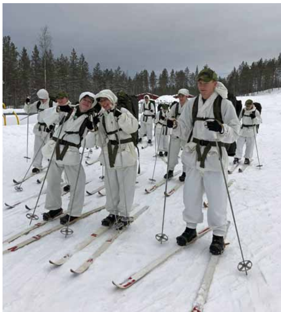
Äntligen dags för skidmarsch

Efter sedvanlig vård och inlämning avslutades en spännande och givande vecka i "Kung Bores land". Flygvapenfrivilliga sänder ett stort TACK till elever och instruktörer för ett bra jobb!