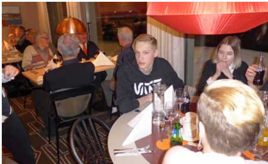
Här har medlemmarna samlats till middag

om Riksstämman 2018 13-14 oktober i Linköping. Avslutade med "Vad skall vi uppnå" - vara mer än 4500 medlemmar - ha mer än 400 ungdomar på sommarkurserna - ha mer 800 ungdomar i den terminsbundna verksamheten - ha välfyllda kurser med mycket kompetenta kursorganisationer - utveckla huvudmannaskapet för instruktörsutbildning.