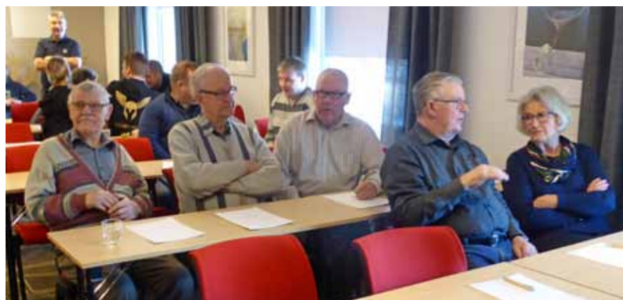
Årsmötesdeltagarna samlade till förhandlingar

Uppgifter från RFS till regioner och förbund under 2018 samt eventuella befattningar i FM krigsorganisation för frivilliga ur FFO redovisades. FVRF verksamhet för vuxna samt vår ungdomsverksamhet med utbildningsstegen redovisades, ungdomsutbildningen skall ske ”med mycket hög Flygvapenambition”. Informerade