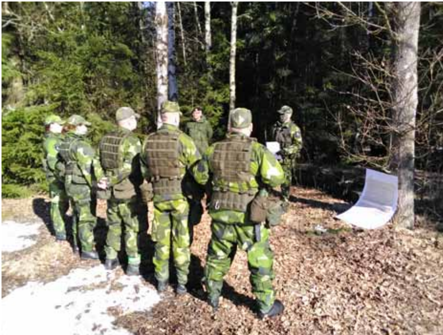
Elevövning i personlig maskering

- Att öva och pröva ytterligare utbildningsmetoder -