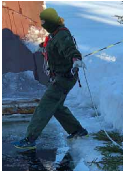
Ett kliv ner i vaken

Ca 110 ungdomar, fördelat på de tre veckorna, genomförde sin vinterutbildning med godkända vitsord och betydligt kunnigare i att klara sig i vintermiljö.