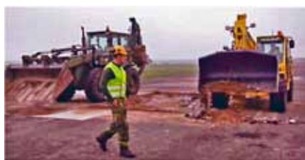
Personal som arbetar med banreparation

inom olika delar av deras insatsorganisation. Av dessa befattningar är cirka 800 avsedda för Flygvapnets förband. Befattningarna omfattar flera olika funktioner och även ett flertal befattningar på olika chefsnivåer.