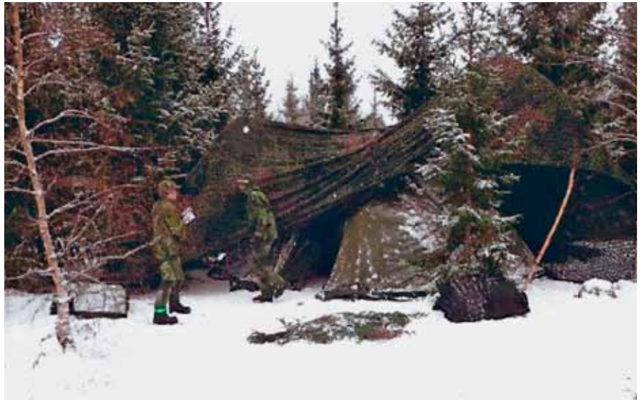
Elevövning i förläggningstjänst

Vi presenterades för begreppet övningsplan, något som vi raskt förstod skulle ha en central betydelse i kursen. Vi fick förklarat för oss vad den syftar till och lite kort i hur den skulle skrivas. Raskt grep vi uppgiften an, hur svårt kunde det vara egentligen? Rätt klurigt visade det sig snabbt. Vad är det egentligen som skall med och var i planeringen skall det med? Då