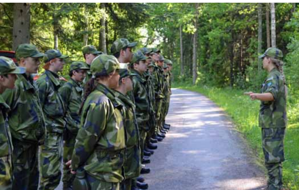
Kurschef under genomgång före övning