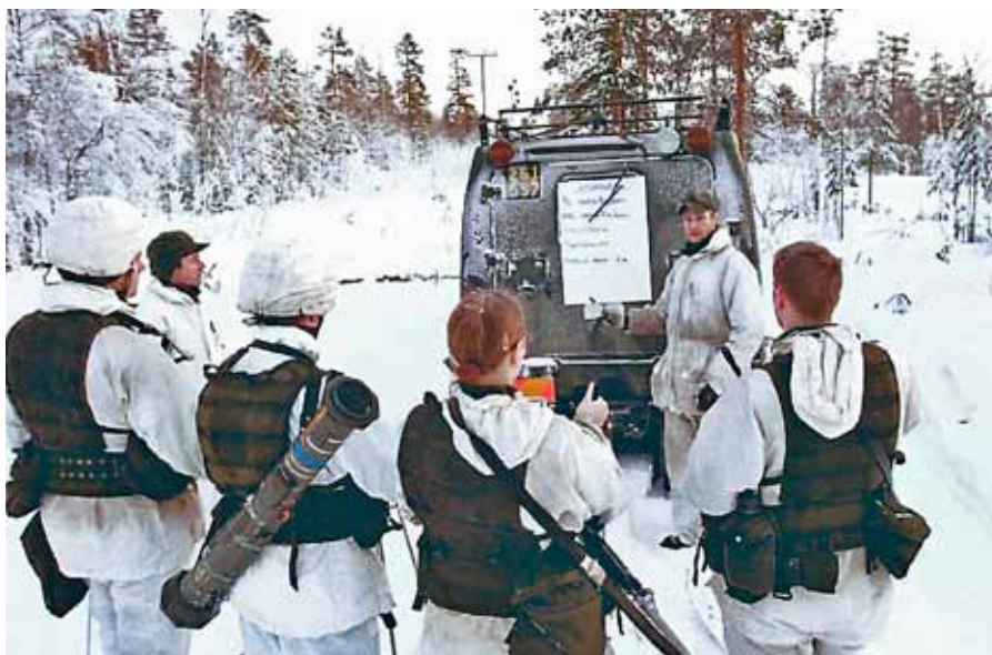
Instruktör under utvärdering av utbildningspass

Att vara kurschef i frivillig försvarsverksamhet är en omfattande och spännande roll – helt avgörande för