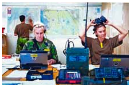
Personal i befattning stabsassistent

Därför är det mycket positivt att Försvarmakten nu har behovssatt ca 2000 nya befattningar för frivilliga