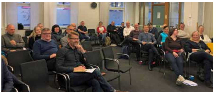
Deltagarna Workshop samlade