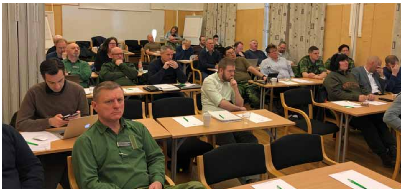
Deltagarna samlade inför planeringsmöte 2018