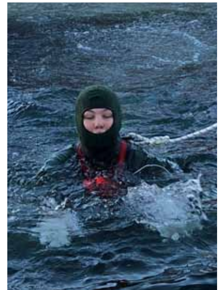
På väg upp ur vaken - det gick bra

Eleverna tog sig till kursplatserna på olika sätt, med tåg, buss och flyg. Varje utbildningsvecka började på söndagskvällen med samling och