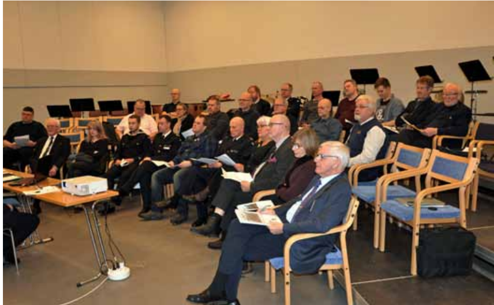
Syd medlemmar samlade till förhandlingar