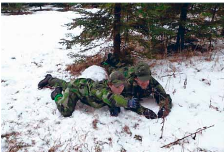
Elevövning i Målangivning