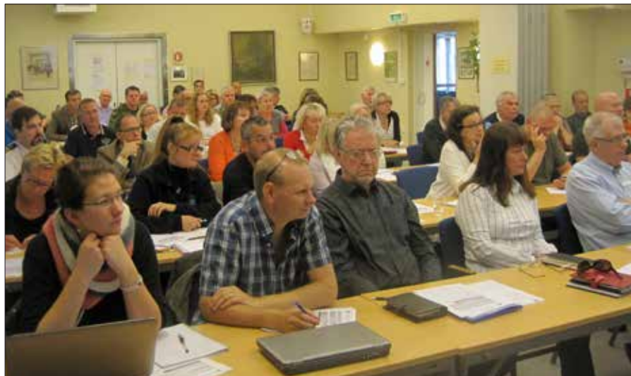
Instruktörerna djupt koncentrerade

tecken. Efter sammanfattning och reflektion över gårdagens aktiviteter kom vi snabbt igång med nya frågor och nya diskussionsämnen. På förmiddagen hann vi också med ett besök på HvSS museum.