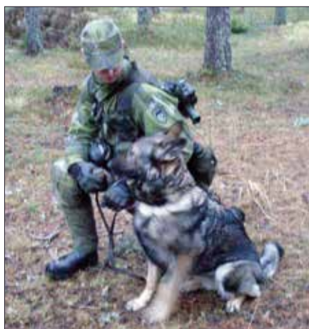
Hundförare Christer Dahlqvist med hunden Vilda

Silfverlood som genomfördes veckorna 47-48 har bestått av två delar. Under mån-ons vecka 47 var det utbildning och samkörning av grupper och hundekipage. Under kursen har kadetter gått i befattning som