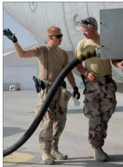
Flygteknikerna ser till att flygplanet är tankat och klart innan dagens flygningar börjar.