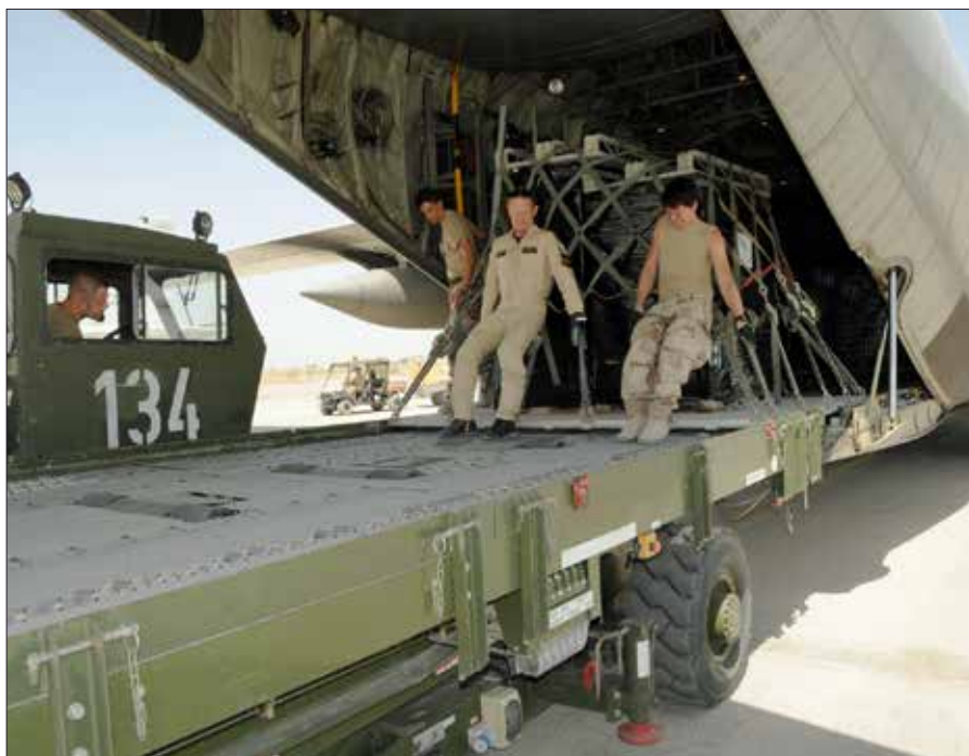
I ett litet förband är samarbetet extra viktigt. Flygteknikerna hjälper lastmästarna när lasten ska ombord på Marmal.

rade hem till Skaraborgs flygflottilj igen. De senaste åren har svensk C-130 Hercules deltagit i insatser i Afghanistan, Gabon och Libyen. Den första internationella insatsen gjordes redan för drygt fyrtio år sedan och inget pekar på att efterfrågan blir mindre.