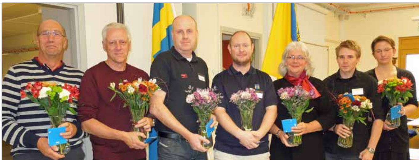
Avgående styrelsen avtackades med blommor