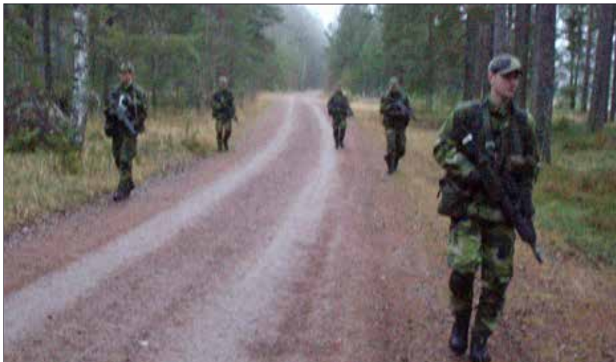
Markförsvarsgrupp under patrullering på en väg

Tillämpningsdelen och övningen totalt är en slutövning vid Forsvarsmaktens underrättelse- och säkerhetscentrum (FM UndSäkC) för de blivande officerarna vid officersprogram (OP) och specialistofficersutbildningen (SOU).