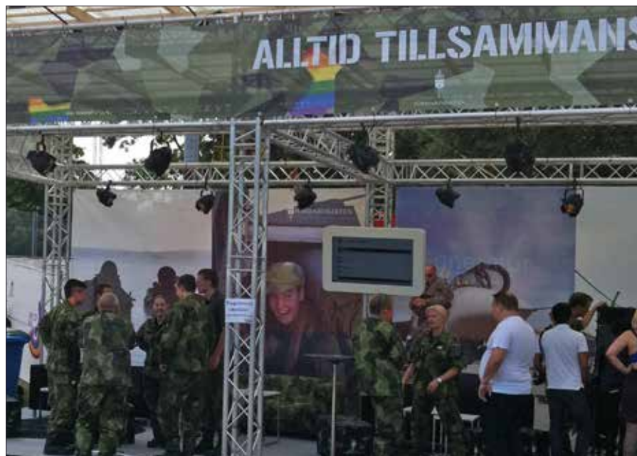
FM och Frivilliga försvarsorganisationernas Informationsmonter