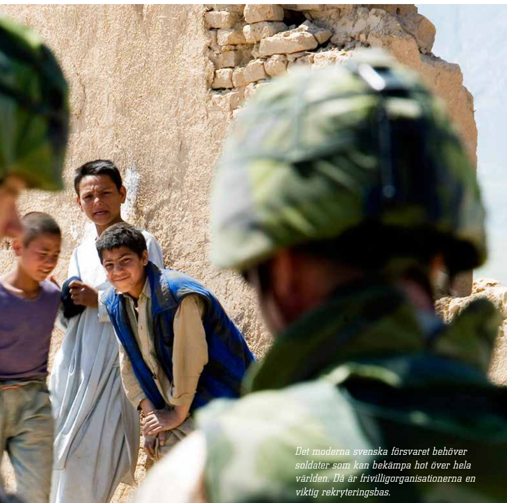
Det moderna svenska försvaret behöver soldater som kan bekämpa hot över hela världen. Då är frivilligorganisationerna en viktig rekryteringsbas.

“Frivilligrörelsen är själva kärnan i folkförankringen.”