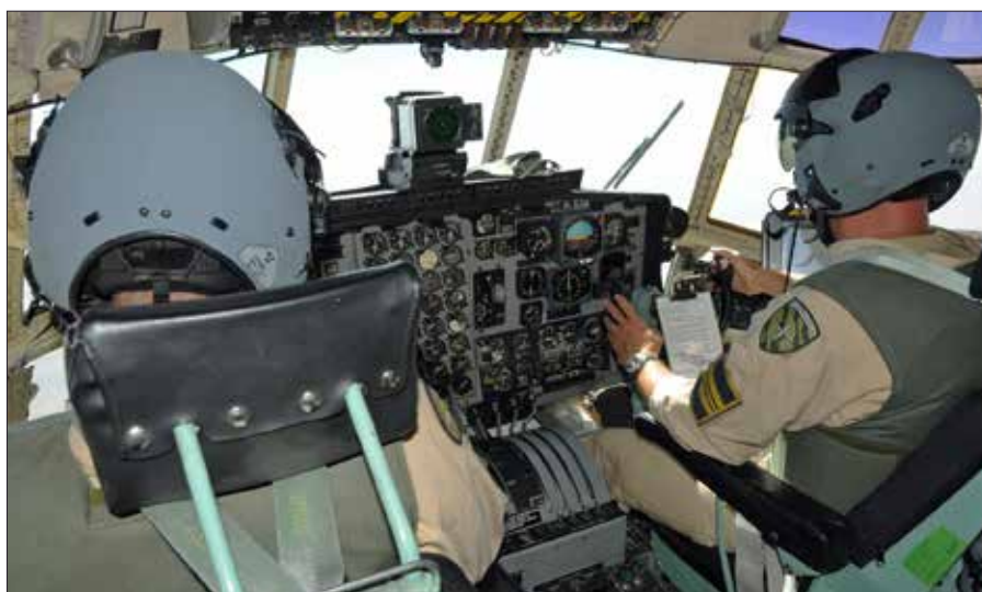
Att flyga i Afghanistan skiljer sig på många sätt från att flyga i Sverige. Bland annat måste besättningen bära kroppsskydd.

I mitten av september avvecklade SAE C-130 sin del av verksamheten för den här gången och ombase-