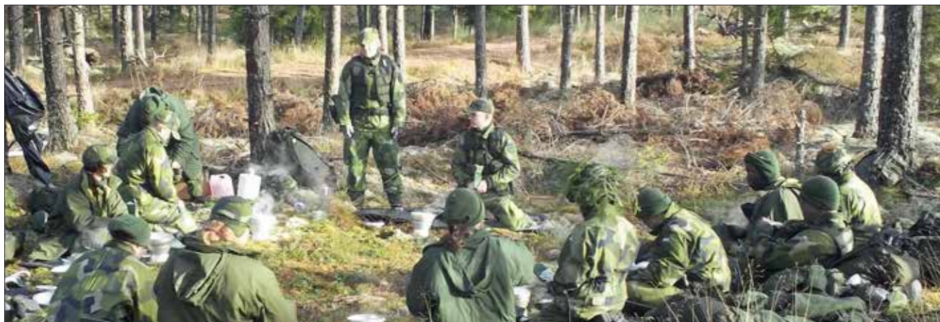
Elevövning med GU-F elever