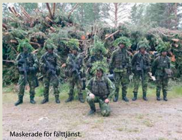
Maskerade för fälttjänst.