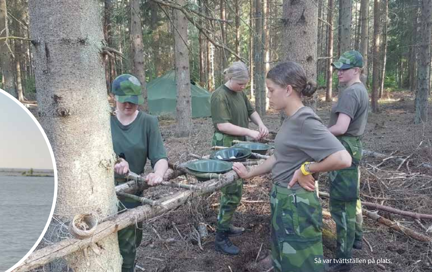
Så var tvättställen på plats.