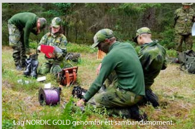
Lag NORDIC GOLD genomför ett sambandsmoment.