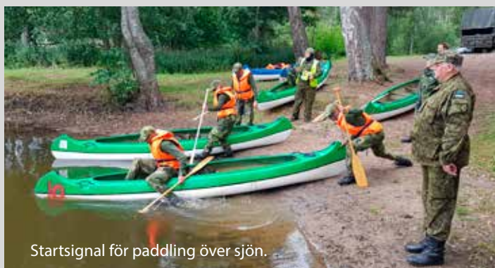
Startsignal för paddling över sjön.