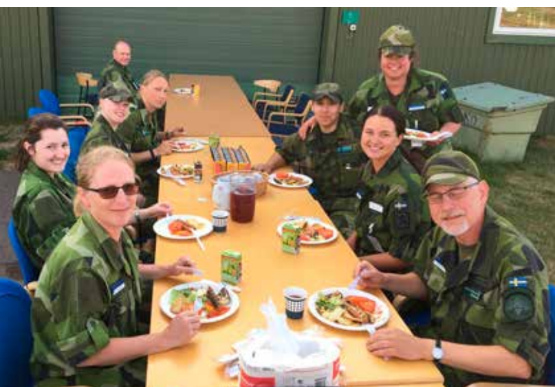
En riktig festmåltid.