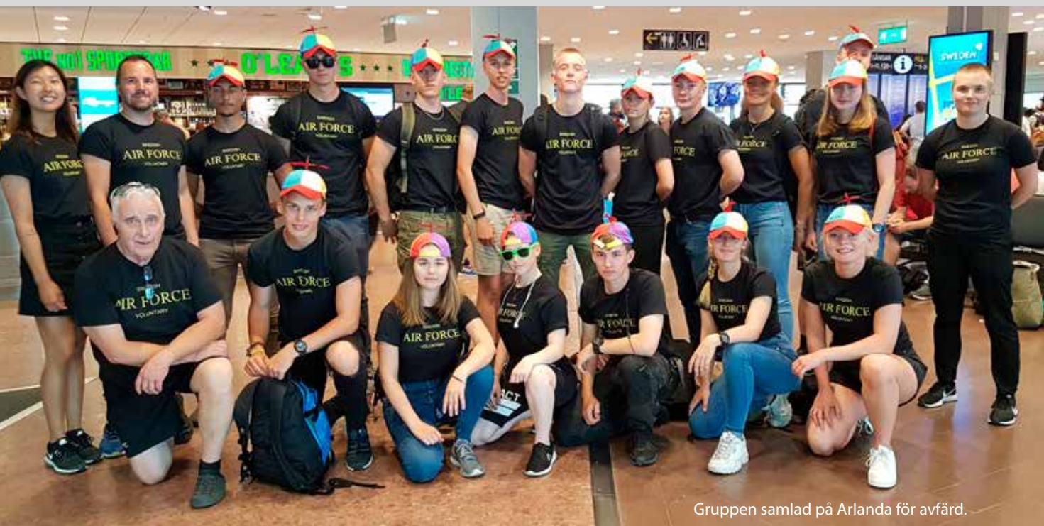
Gruppen samlad på Arlanda för avfärd.