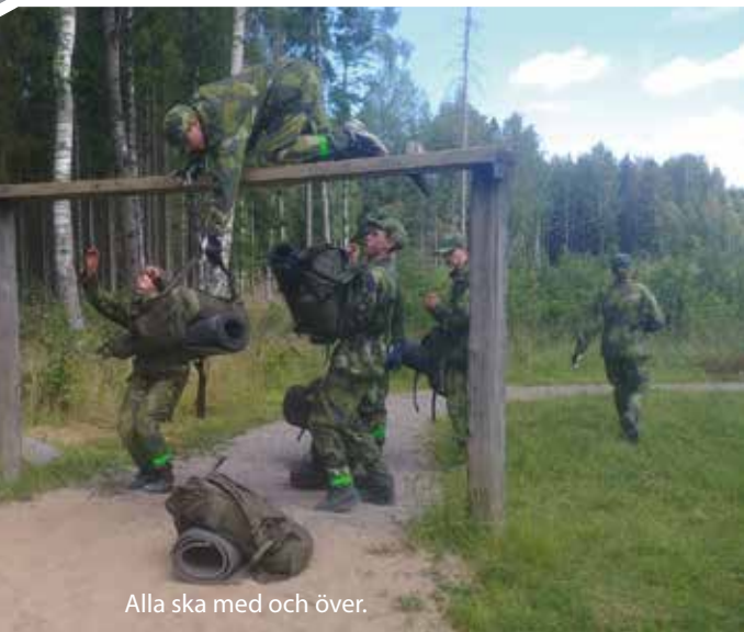
Alla ska med och över.