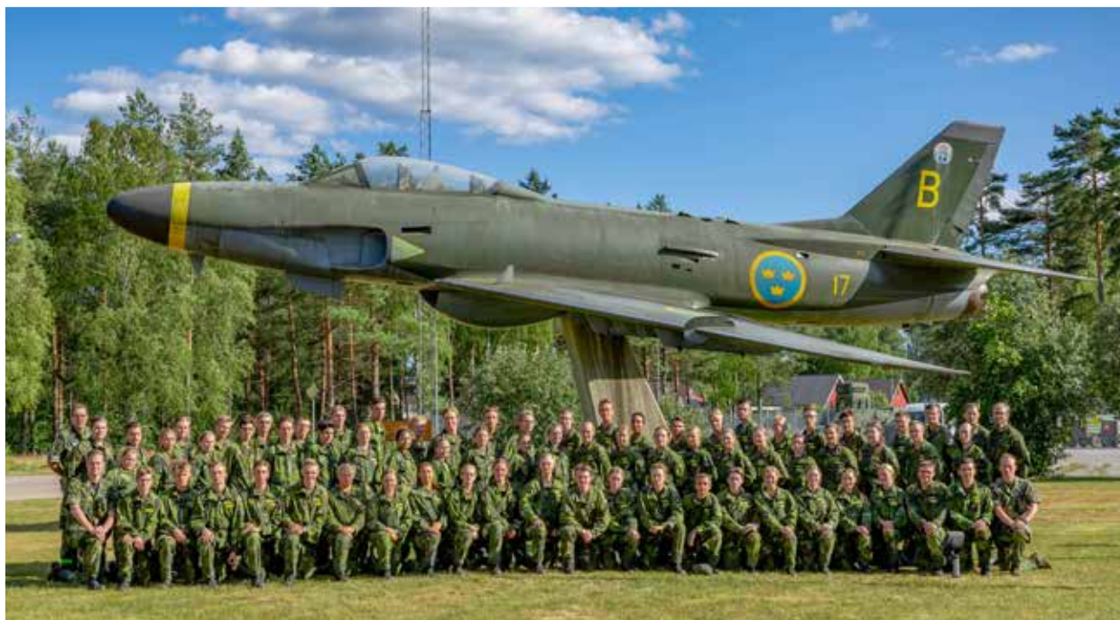
Gruppenbild under fpl 32 Lansens.