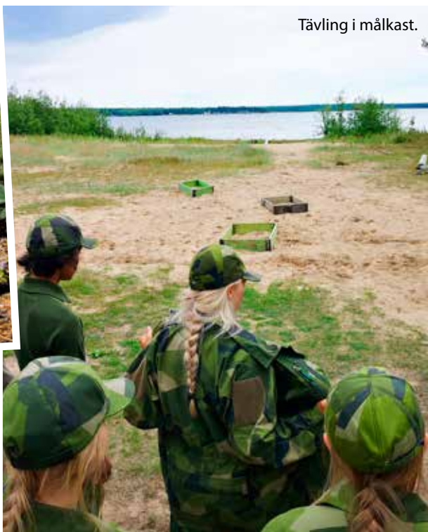
Tävling i målkast.