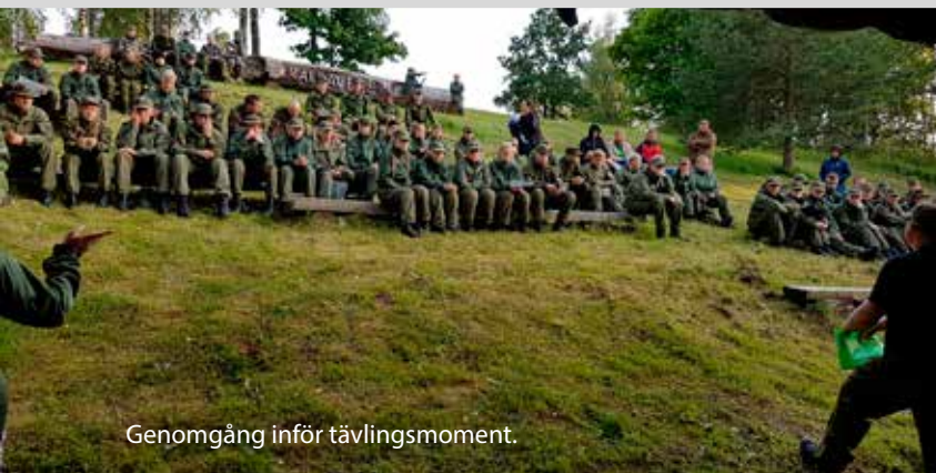
Genomgång inför tävlingsmoment.