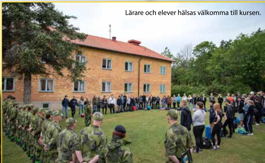
Lärare och elever hälsas välkomna till kursen.