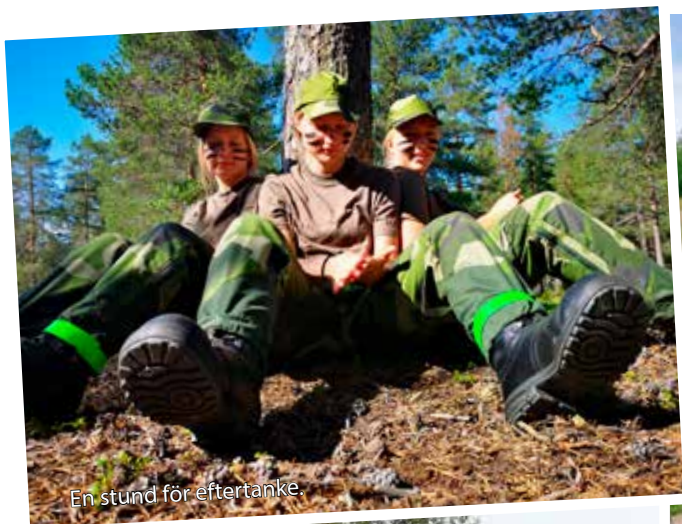
En stund för eftertanke