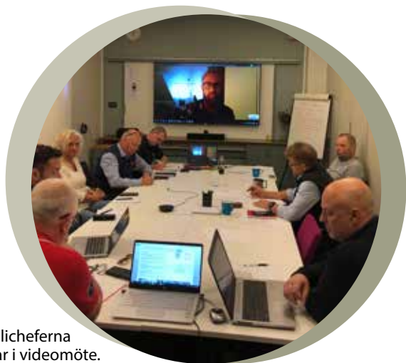
Kanslicheferna deltar i videomöte.

Kanslicheferna var eniga om vikten av att träffas tillsammans och utbyta erfarenheter är en mycket viktig del av mötet. Medlemshantering med regis-