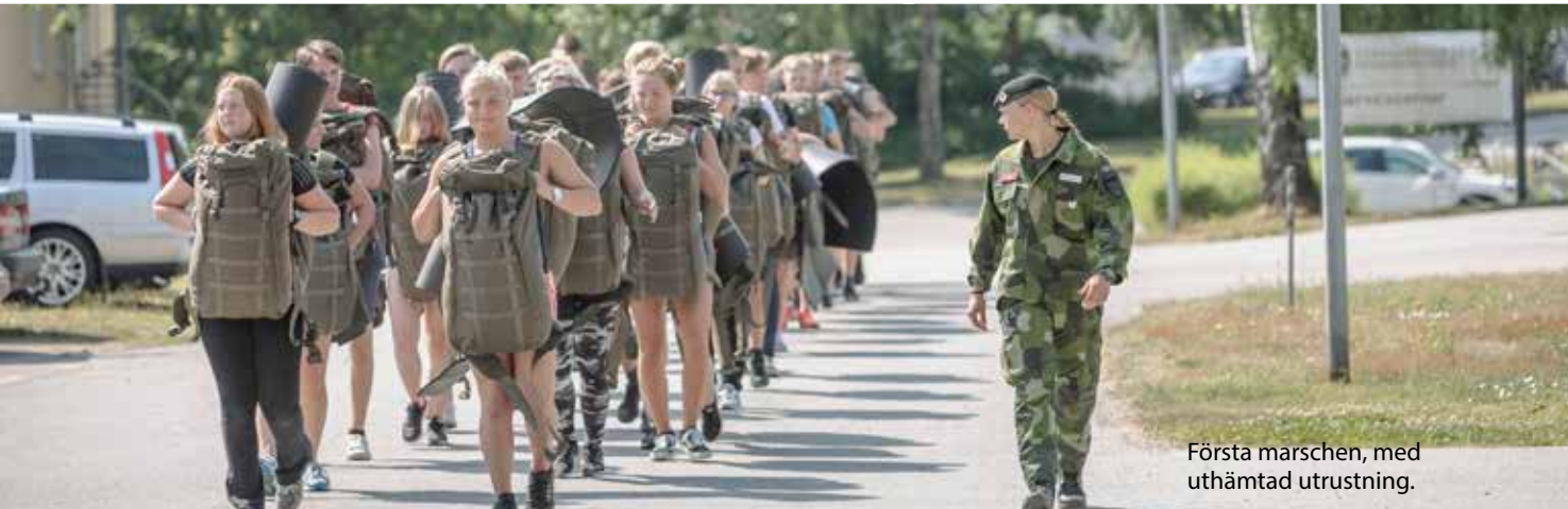
Första marschen, med uthämtad utrustning.