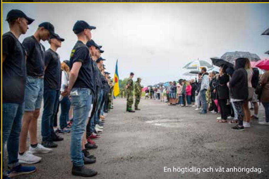
En högtidlig och våt anhörigdag.