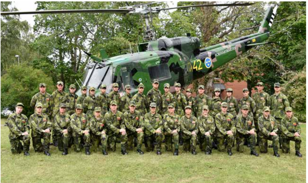
2. pluton.