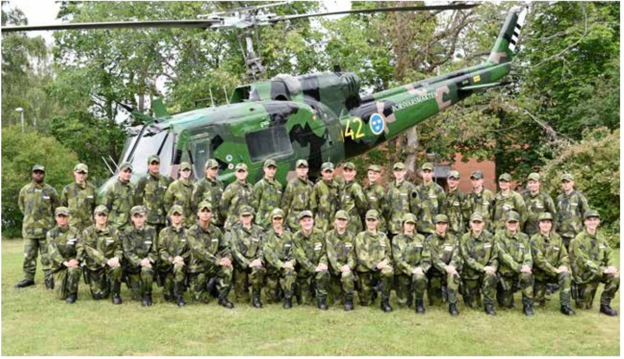
1. pluton.