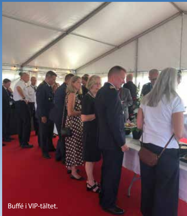
Buffé i VIP-tältet.