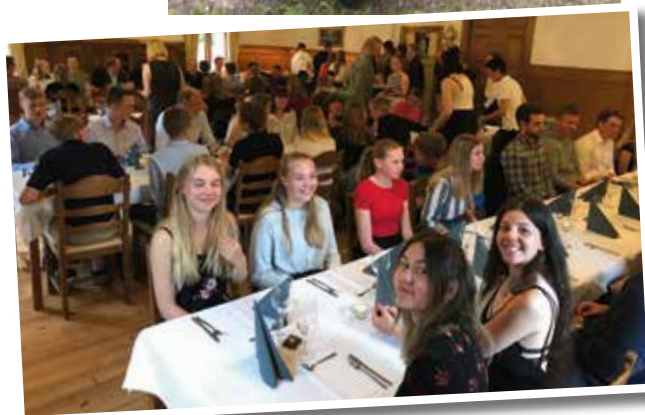
Avslutningsmiddag på mässen.