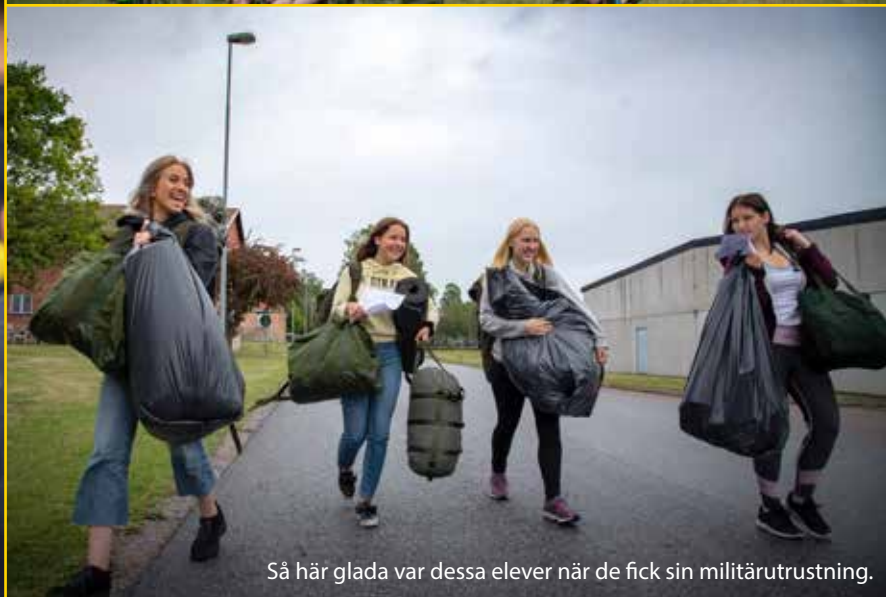
Så här glada var dessa elever när de fick sin militärutrustning.