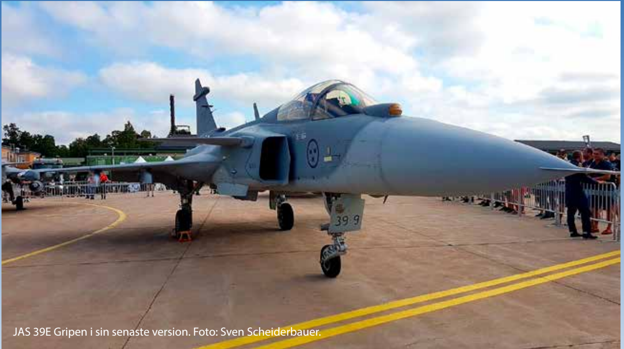
JAS 39E Gripen i sin senaste version.