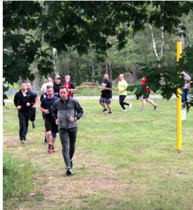
Uppvärmning inför terrängbanan.