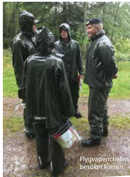
Flygvapenchefen besöker kursen.