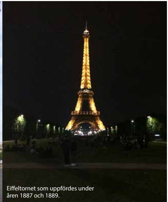
Eiffeltornet som uppfördes under åren 1887 och 1889.