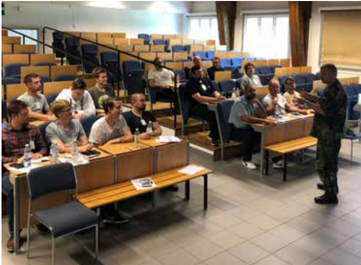
Kurschefen beskriver utbildningsgången.