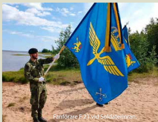
Fanförare F 21 vid Soldaterinran.