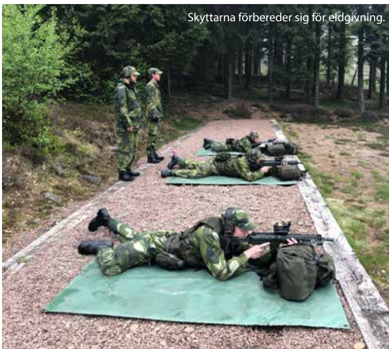
Skyttarna förbereder sig för eldgivning.