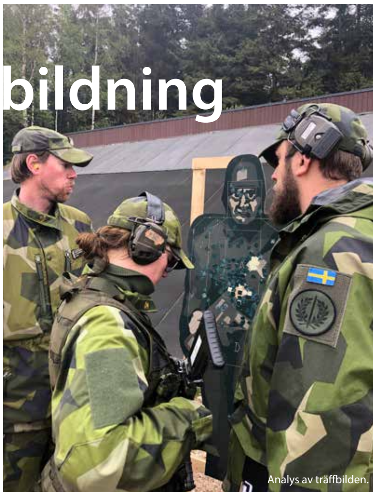
Analys av träffbilden.