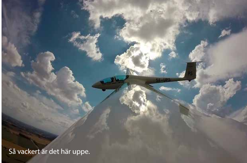
Så vackert är det här uppe.

“Det kan väl inte vara så svårt att lära sig flyga”, tänkte jag, men det visade sig vara svårare än jag trott. Det tyckte sig vara så att allt, alla roder och vingar och nos, hela tiden rörde sig mer eller mindre än man hade tänkt sig. Efter flygningarna var man helt slut, både fysisk och psykiskt, trots att varje flygning bara tog ca 15 minuter. Vid varje pass var det något nytt man skulle fokusera på, något mer man skulle öva på. Om det var något man hade under veckan i Falköping så var det en brant utvecklingskurva. Visst hade man stunder när man kände att man inte kunde något man lärt sig, när man började tvivla på vilket roder som gjorde vad. Men, sen släppte något, muskelminnet svek en inte. Under nästa flygpass kunde man använda alla roder utan problem, utan att egentligen behöva tänka på vad man gjorde.