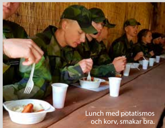
Lunch med potatismos och korv, smakar bra.