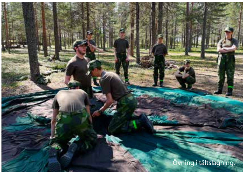
Övning i tältslagning.

PATRIK PERSSON/KURSCHEF