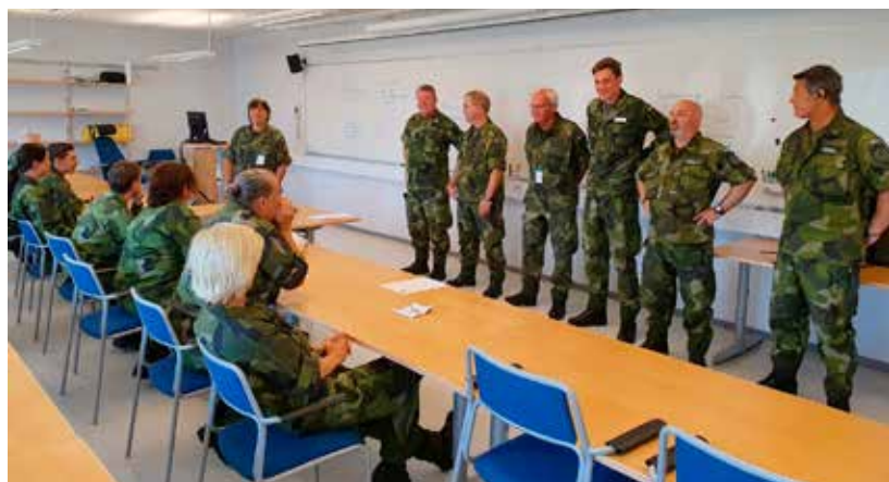
Sådana lärare – sådana elever.

De 17 eleverna som kom från fem olika frivilliga försvarsorganisationer och delades in i två grupper med två handledare över tiden. De 9 nio elever från Teknisk bataljon fick bilda en egen grupp de också med två handledare över tiden. Båda täterna hade i stort samma upplägg. En mindre del av kursen genomfördes i helklass i form av utbildning i pedagogik, ledarskap, värdegrund och verksamhetssäkerhet medan resten av utbildningen genomfördes som trupputbildningspass (TU-pass) i mindre grupper. De olika TU-passen som är den bärande delen i utbildningen varierade i tid från 15 till 45 minuter. Eleverna tilldelades ett ämne med ramar om tid, innehåll och omfattning. Sedan startade förhandledningen,