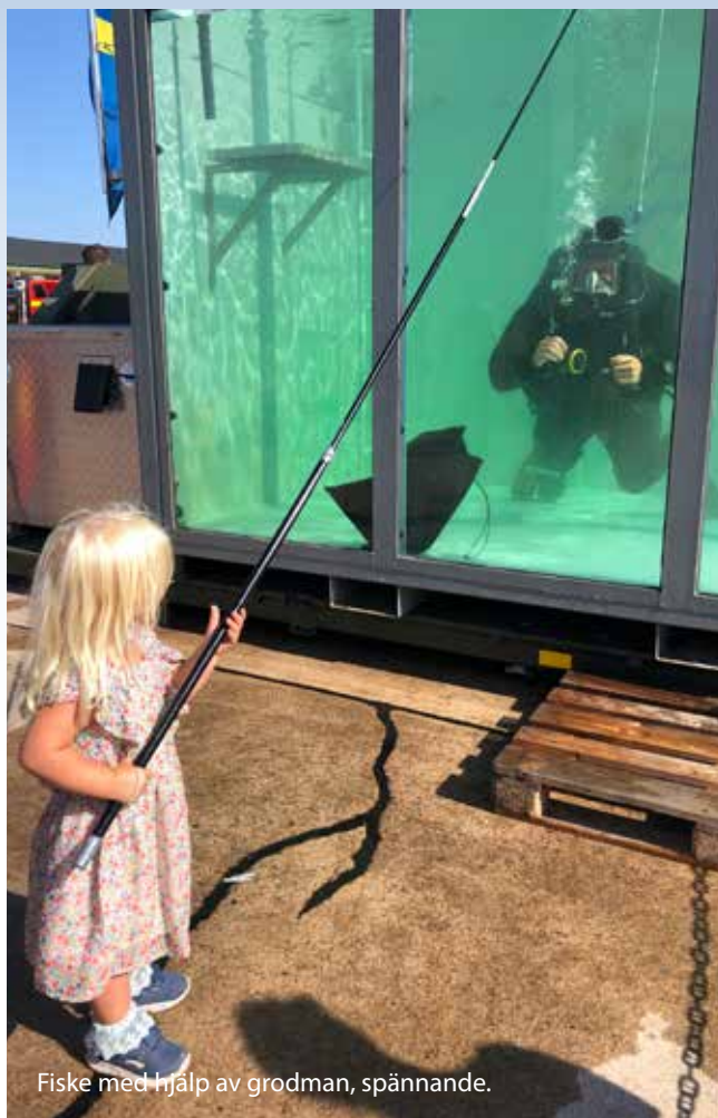
Fiske med hjälp av grodman, spännande.

Markutställningen var omfattande med massor av montrar där det bjöd på det mesta. En stor del av utställarna kom från det lokala näringslivet. Nästan alla de 18 frivilliga försvarsorganisationer var representerade.