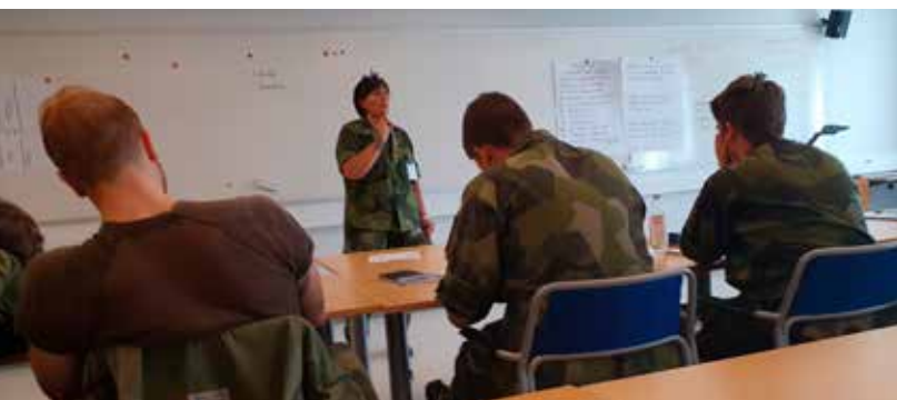
Kurschefen drar upp riktlinjerna.