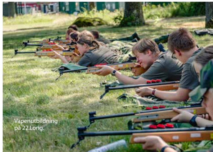
Vapenutbildning på 22.Long.