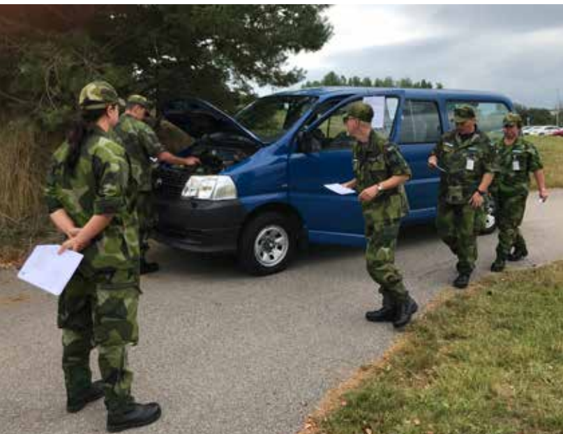
Elevövning, kontroll före körning.