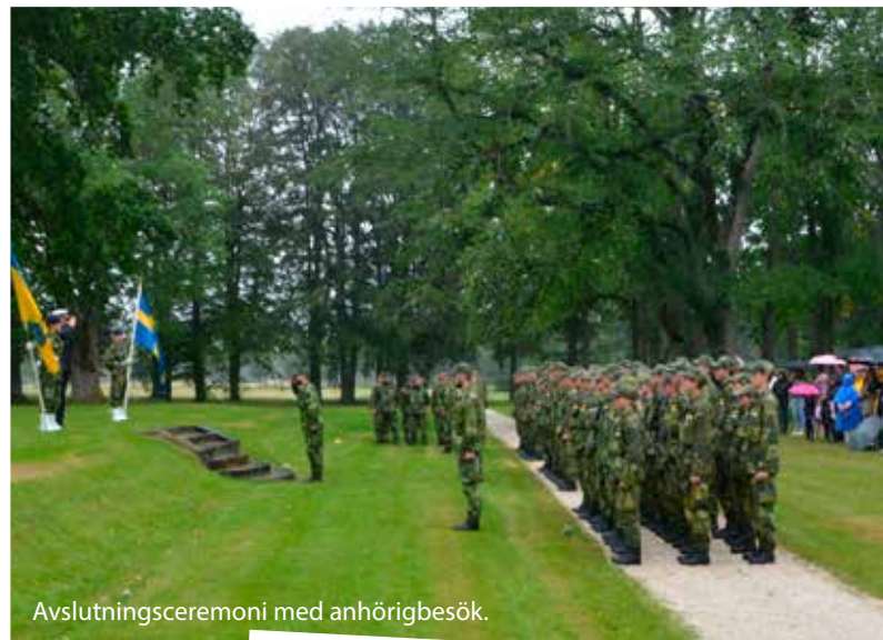
Avslutningsceremoni med anhörigbesök.

Efter 12 dagar var kursen slut, eleverna upplevde utbildningen som givande och rolig. Det var med en bra känsla i magen när eleverna gjorde sig klara för avslutning och diplomceremoni. Stolta föräldrar var på plats tog del i elevernas kursavslutning. Sommarkursen 2019 avslutades med ett sedvanligt kommando: Höger och vänster om - marsch!