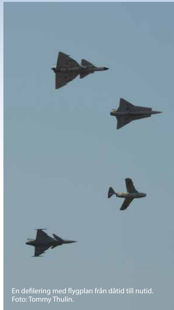
En defilering med flygplan från dåtid till nutid.