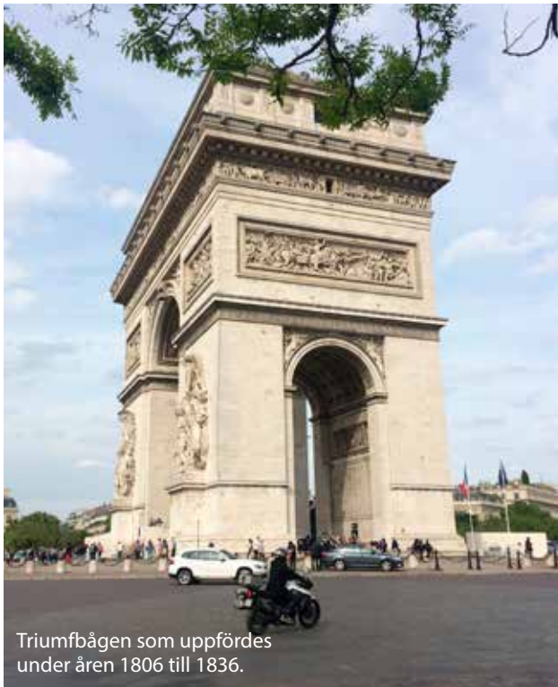
Triumfbågen som uppfördes under åren 1806 till 1836.