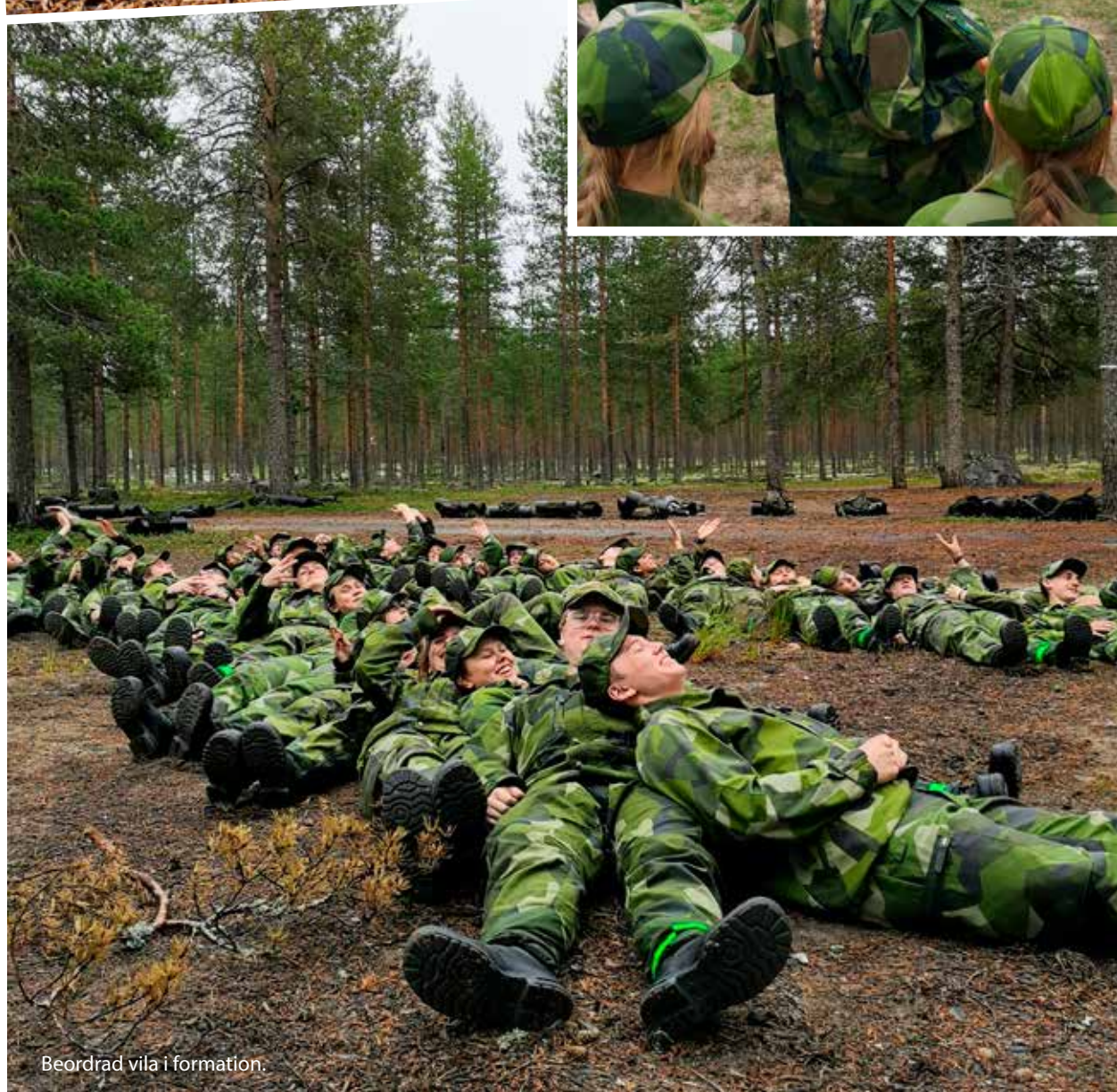
Beordrad vila i formation.