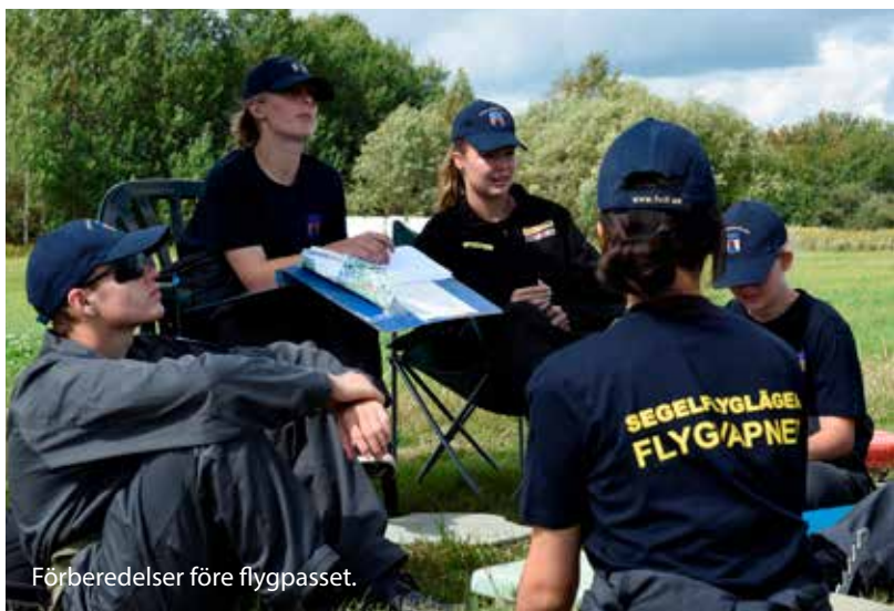
Förberedelser före flygpasset.