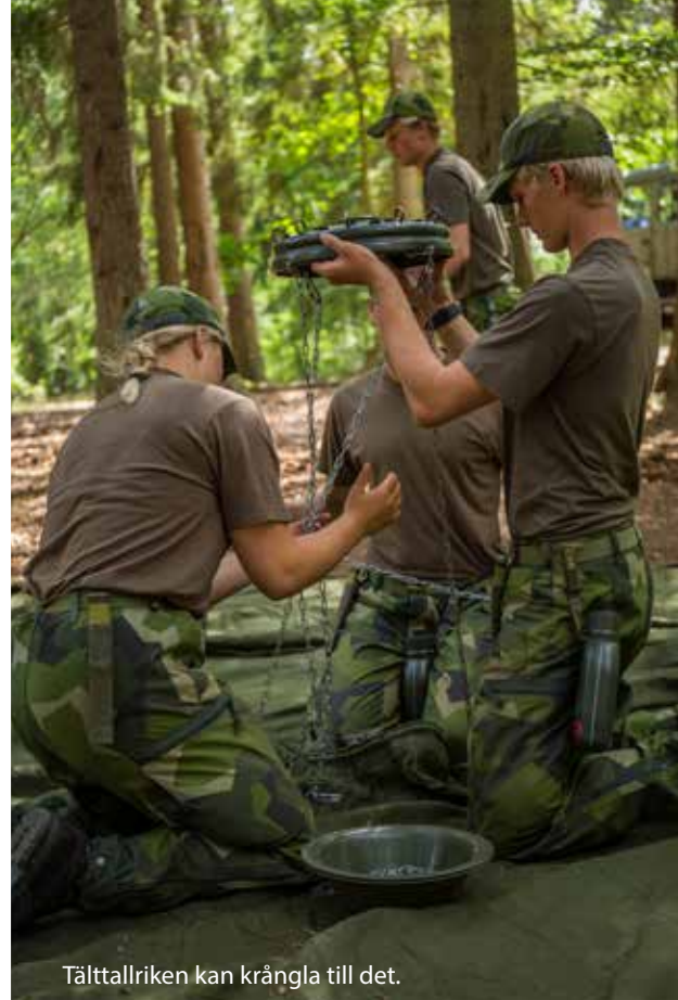
Tälttallriken kan krångla till det.