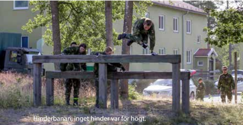
Hinderbanan, inget hinder var för högt.