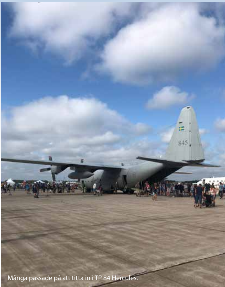
Många passade på att titta in i TP 84 Hercules.