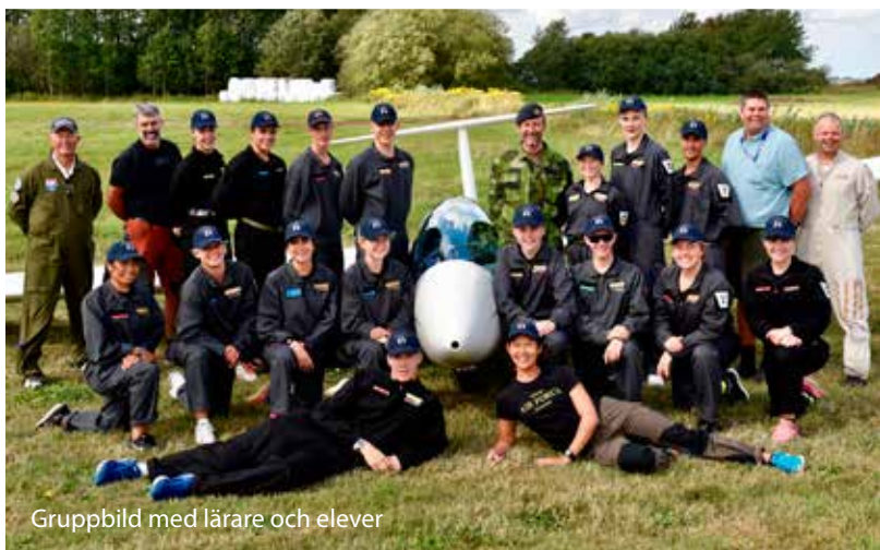
Gruppbild med lärare och elever

I slutet av veckan var det därför inte nervositet och rädsla man kände när instruktören sa att det var jag som flyger. Det var med självsäkerhet och lugn jag svarade: “Jag flyger.”