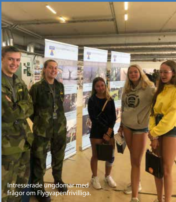
Intresserade ungdomar med frågor om Flygvapenfrivilliga.