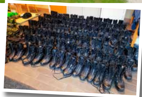
Här var det putsat och klart.

TEXT: OSKAR KLASSON / KURSCHEF