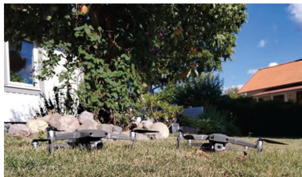
Rote Mavic 2 Pro i ”högsta” någon stans i Östergötland.