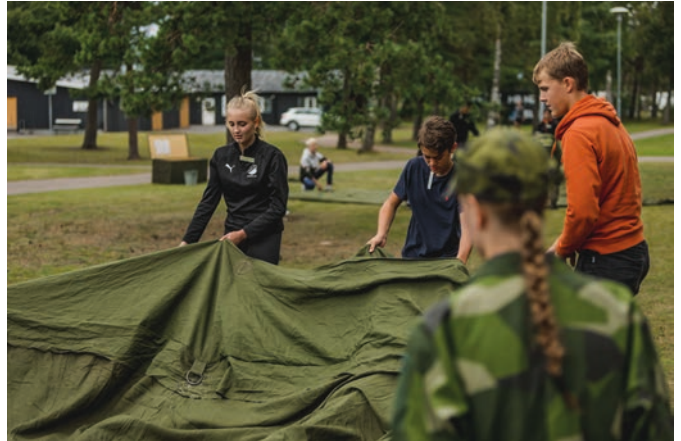
GK-elever övar förläggningstjänst.

Under första helgen i september påbörjade FVRF Syd sin höstverksamhet.