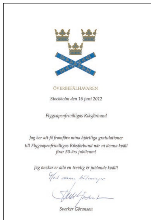
ÖB telegram, ett av flera gratulationer

Parallellt med Jubileumsdagen genomförde Flygvapenfrivilliga tillsammans med F 7 ungdomsläget Air Camp. Air Camp blev därför en naturlig och uppskattad del av de förevisningar som sedan följde för att belysa Flygvapenfrivilligas verksamhet. Andra verksamheter som visades upp var ett antal moment markstrid som vårt Markförsvarsförbund visade upp samt delar av Hemvärnets underrättelsekompanier. Att rekrytera och grundutbilda till Hemvärnets sju underrättelsekompanier är en av dagens uppgifter Flygva-