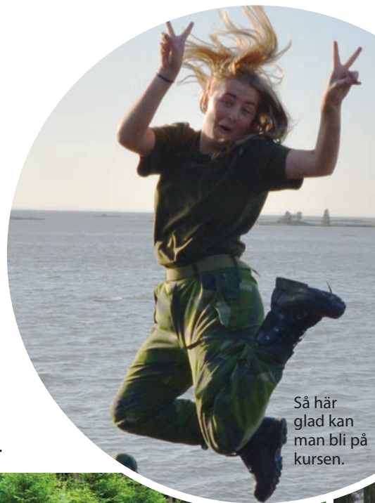
Så här glad kan man bli på kursen.

En sommarkväll på klipporna längs Vänerns kant då solen sänker sig i väster över Dalsland. 70 sommarkurselever sitter där, trötta och slitna efter sin första dag i fält, utan en aning om vad som väntar dem följande vecka. Efter en dag där de har fått lära sig lite om förläggningstjänst, personlig materiel och grundläggande marschrutiner har de fått i sig en bit grillmat i magen. Kurschefen håller ett uppmuntrande tal som höjer humöret på eleverna, sedan är det dags att återgå till förläggningen för att tillbringa den första natten i fält.