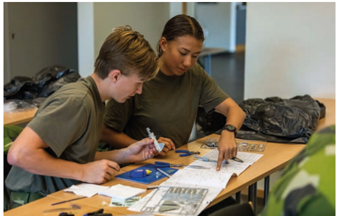
LK-elever bygger flygplansmodeller, samverkansövning.

LARS PETTERSSON/FVRF SYD