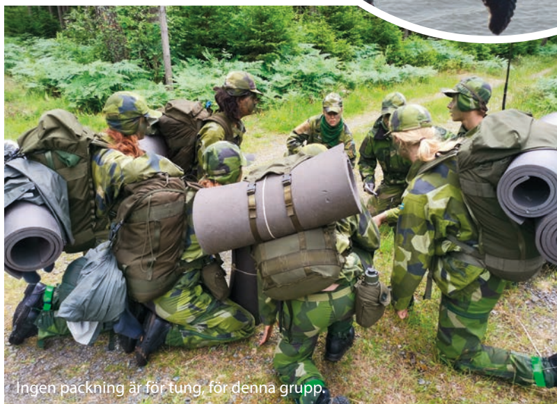
Ingen packning är för tung, för denna grupp.

Flygning med C-130 Hercules blev ett lyckat inslag, med ett leende på läpparna lämnade eleverna flygplanets lastutrymme denna dag. Så var det dags med strapatsövningen, väckning kl 04:30 med Kenny Loggins - Danger Zone ur bergssprängaren. Den bryska väckningen följdes av en busstransport till Hunneberg och strapatsen var ett faktum. En dag späckad av att framrycka till ett okänt antal punkter