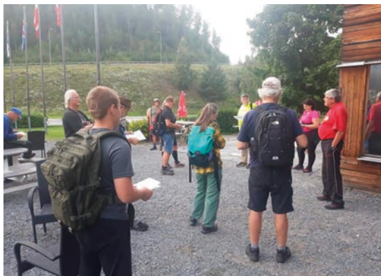
Samling och genomgång före marsch.