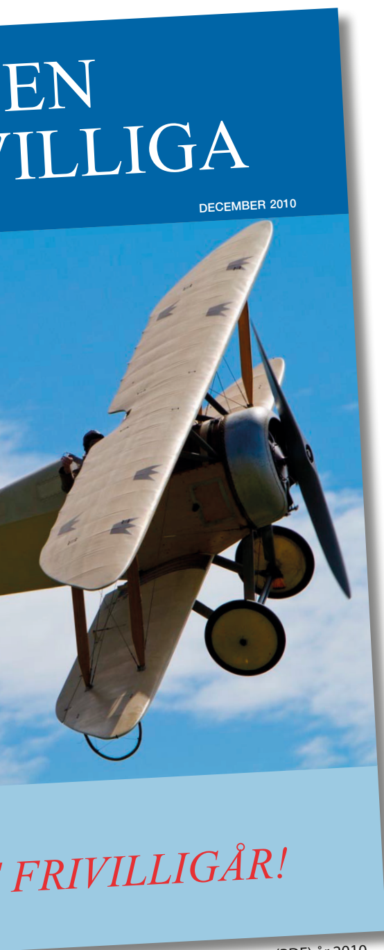
FVRF nya tidning (PDF) år 2010