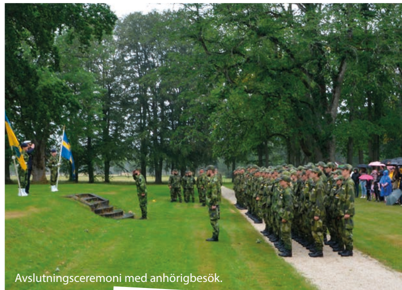
Avslutningsceremoni med anhörigbesök.

Efter 12 dagar var kursen slut, eleverna upplevde utbildningen som givande och rolig. Det var med en bra känsla i magen när eleverna gjorde sig klara för avslutning och diplomceremoni. Stolta föräldrar var på plats tog del i elevernas kursavslutning. Sommarkursen 2019 avslutades med ett sedvanligt kommando: Höger och vänster om - marsch!