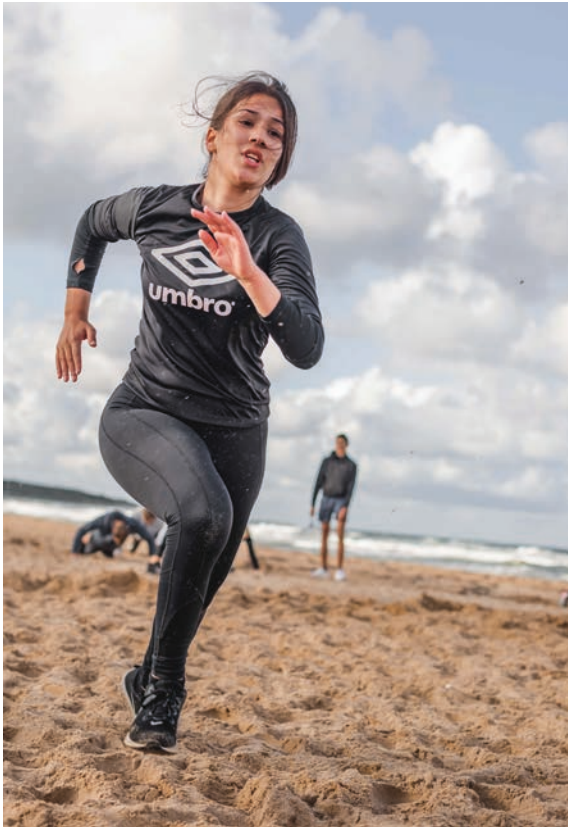
Här går det undan, med en mycket elegant löpstil.