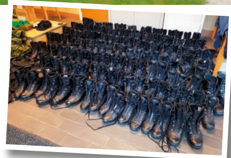
Här var det putsat och klart.

TEXT: OSKAR KLASSON / KURSCHEF