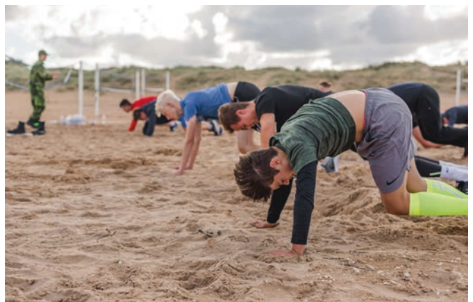
Fysträning på stranden med PK-elev som ledare.