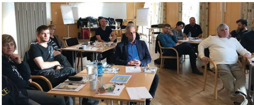
Eleverna på IK UG vid uppstart