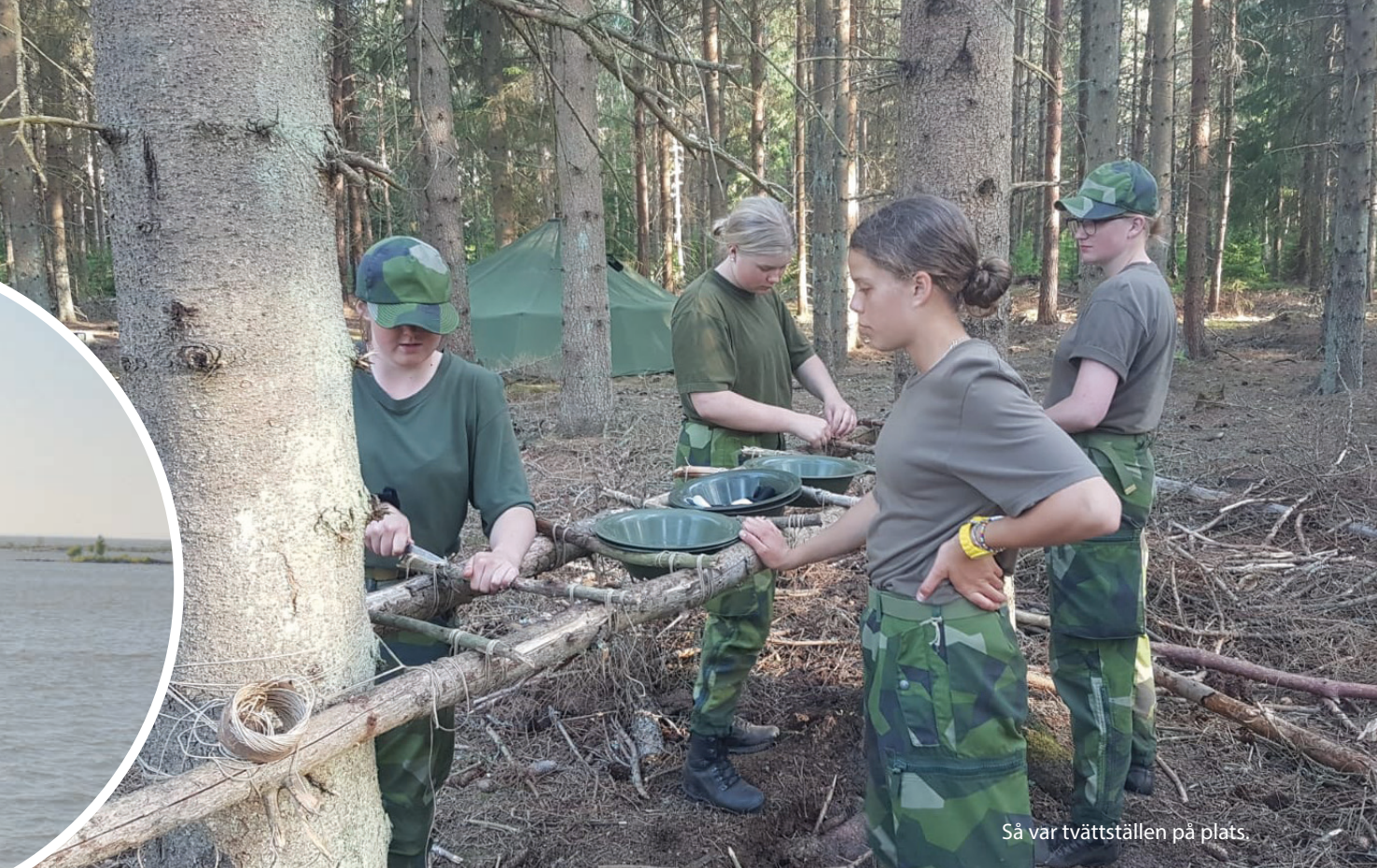
Så var tvättställen på plats.