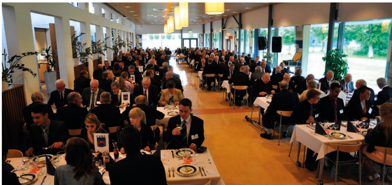
Högtidlig jubileumsmiddag på F 7