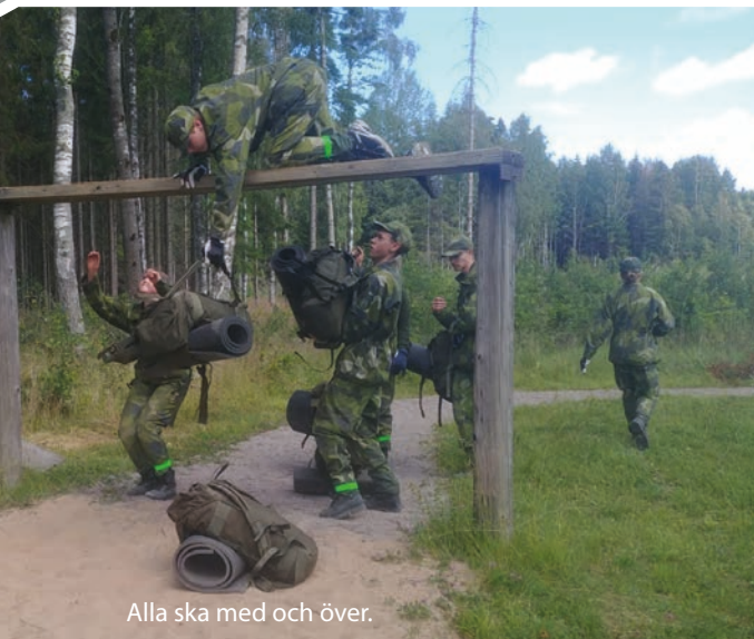
Alla ska med och över.