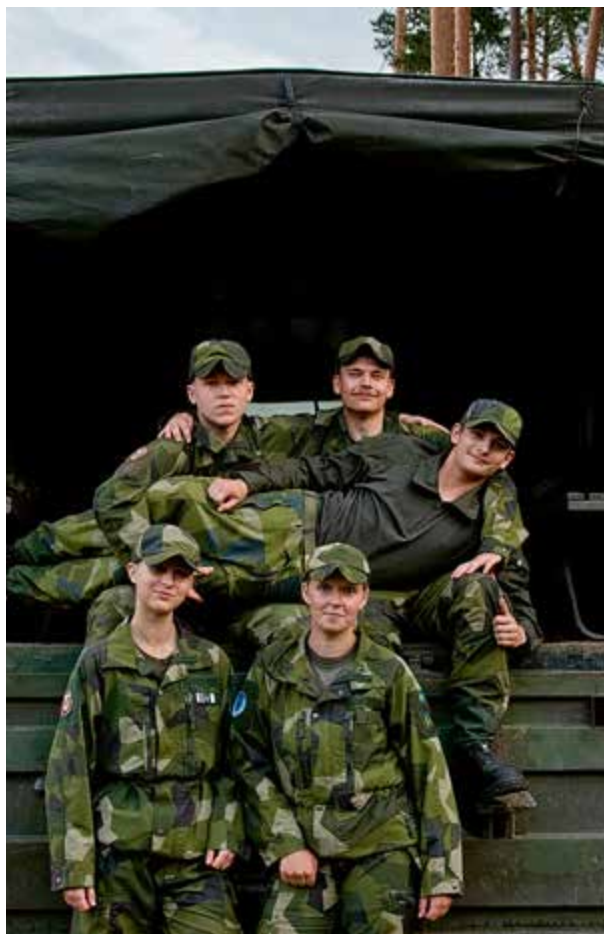
Laget är redo och förberett för tävling.

Efter Beta började tävlingen på allvar. Under färden till nästa checkpoint, närmare midnatt, var det fritt fram för B-styrkan att leta efter oss. Vägar var inte längre något alternativ så gytjtja och dikeskant efter tågräls vart snabbt vår nya terräng i mörkret.