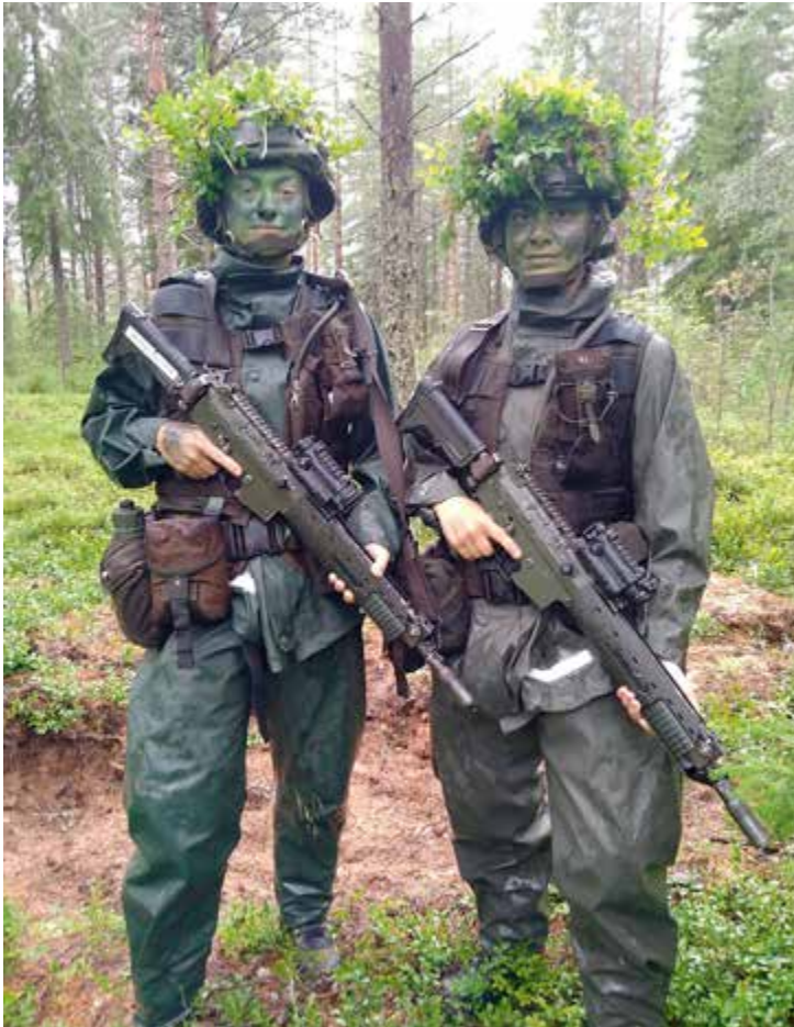
Utrustade för fälttjänst.