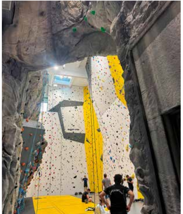
En dag i klätterhallen.