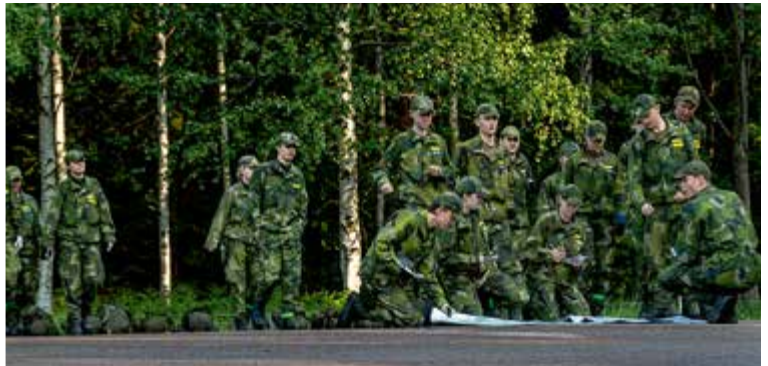
FK får instruktioner om vilka UPK de ska ta.

sista dagen höll LK-eleverna en pjäs inför alla, som de hade jobbat med under tiden som de arbetade i staben, vilket gav många skratt.