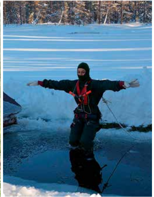
Övning att komma upp ur isvak.