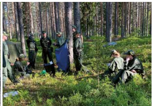
Här behövde vi göra om ruska lång och kort för tredje gången.