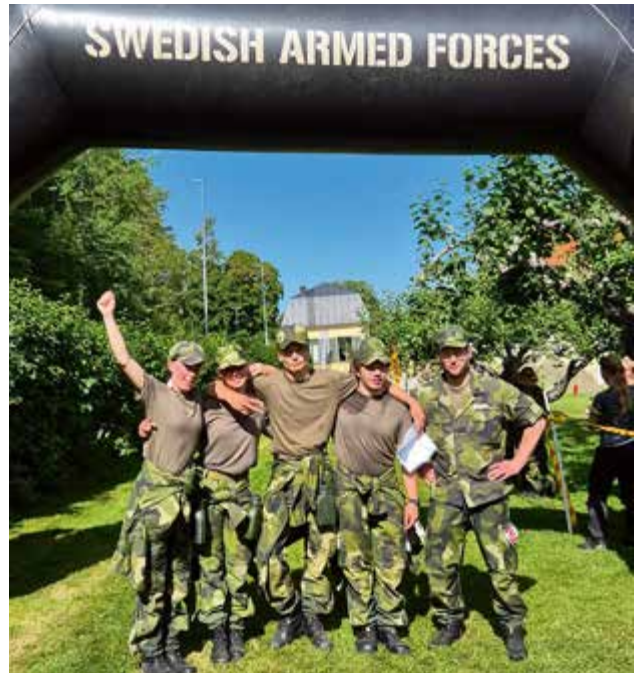
FVRF Syd Mixlag – Först i mål av Syds lag, med både styrka och sammanhållning på topp!