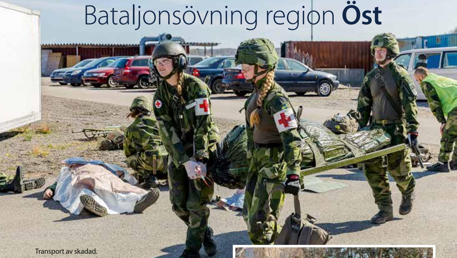
Transport av skadad.