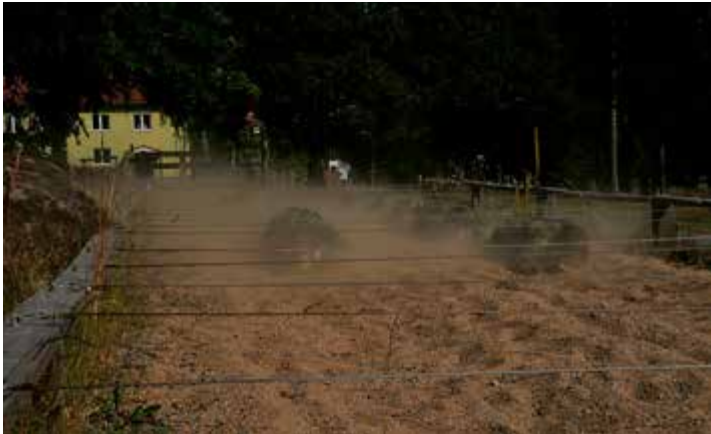
En rökridå bildades när snabbaste gruppen på hinderbanan skulle ta sig runt.