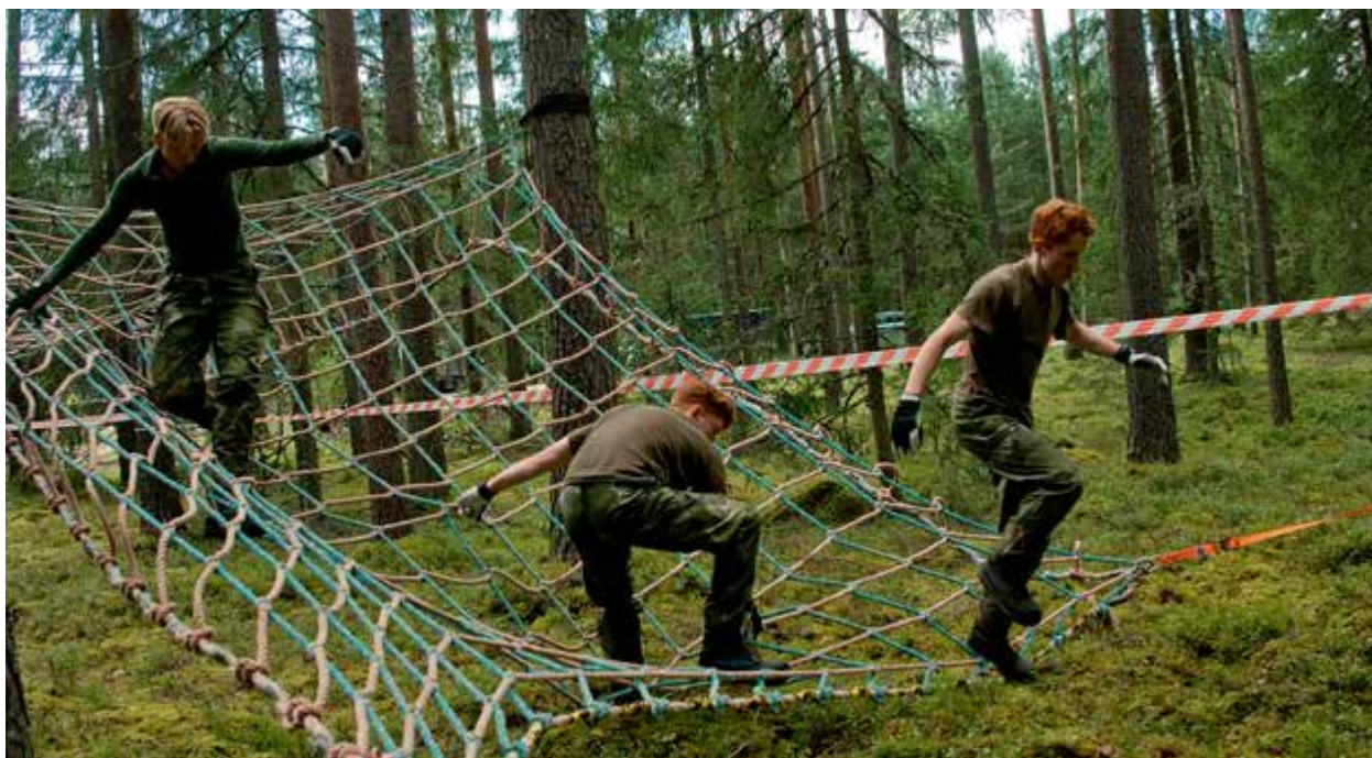
Näthinder – inte lätt att passera.

När jag kom till nattläget var jag så trött att jag bara lade mig ner och grät. Jag var helt slut och hade ont i mina fötter. När vi sen fick torra kläder och riktig mat så kändes det mycket bättre.