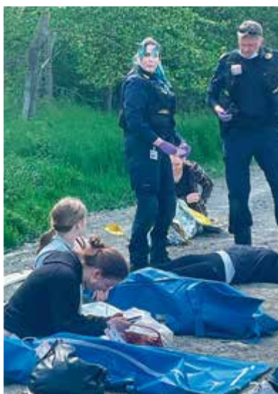
Kriminaltekniker i arbete.