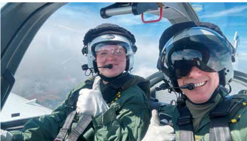
Selfie med piloten under Tutor-flygningen.