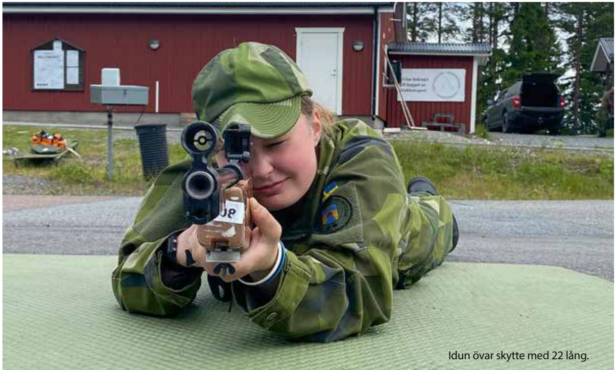
Idun övar skytte med 22 lång.