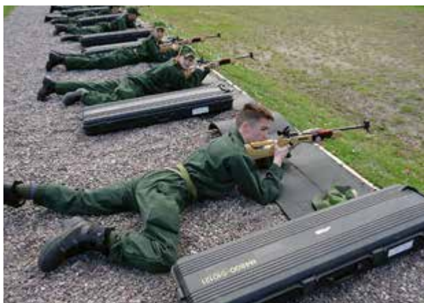
Skytteträning med gevär 22.

TEXT: WENDLA GUNNARSSON