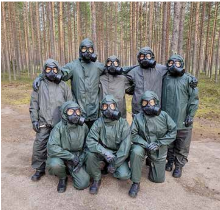
Klara för täthetsprov.

Sverige påverkas, och vår gemensamma beredskap är en fråga som rör oss alla. Genom att engagera sig frivilligt gör man inte bara en insats för sitt land – man blir en del av något större, ett skyddsnet för demokratin och vår frihet.