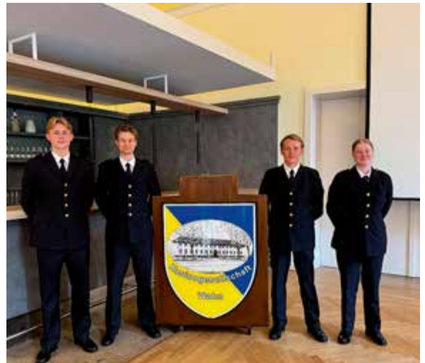
Finklädna till frukost med generalen.

Under resan till Berlin besöktes det tyska aerospace-centret i Brunswick där vi togs emot av en entusiastisk guide som lärde oss mycket om hur forskningen inom luftsektorn bedrivs. Vidare bjöd dagarna i Berlinområdet på en cykeltur i centrala delar av staden samt en lärarik guidad tur i Berlins representanthus, följt av fritid och currywurst samt även flygning av oldtimer flygplan från