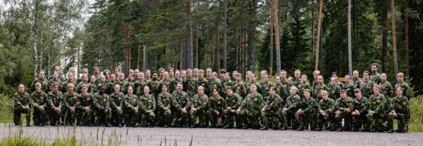
Gruppbild sommarkurs region Öst..

ramverk som levde genom hela kursen, i hur man mötte varandra, löste konflikter och höll ihop även när det var som tuffast. Respekt, ansvar, gemenskap och olikheter som styrka – RAGO – blev en gemensam ledstjärna för gruppen.