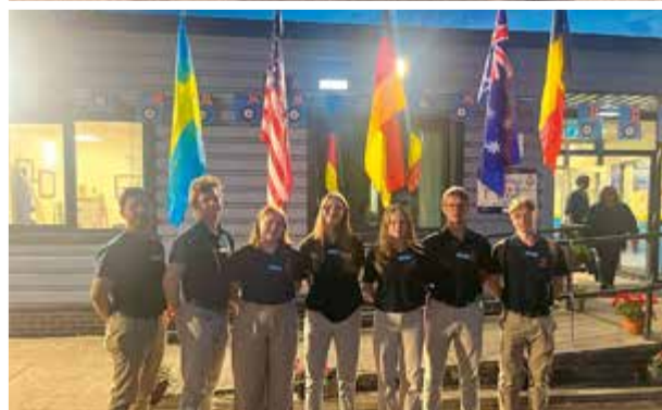
Utanför 126 Sqn City of Derby.

konster i luften såsom loopar, rollar och att verkligen få känna G-krafterna när vi trycktes mot sätet samtidigt som himmel och mark bytte plats. Detta var mycket uppskattat och åter på marken hade vi alla enorma leenden på läpparna.