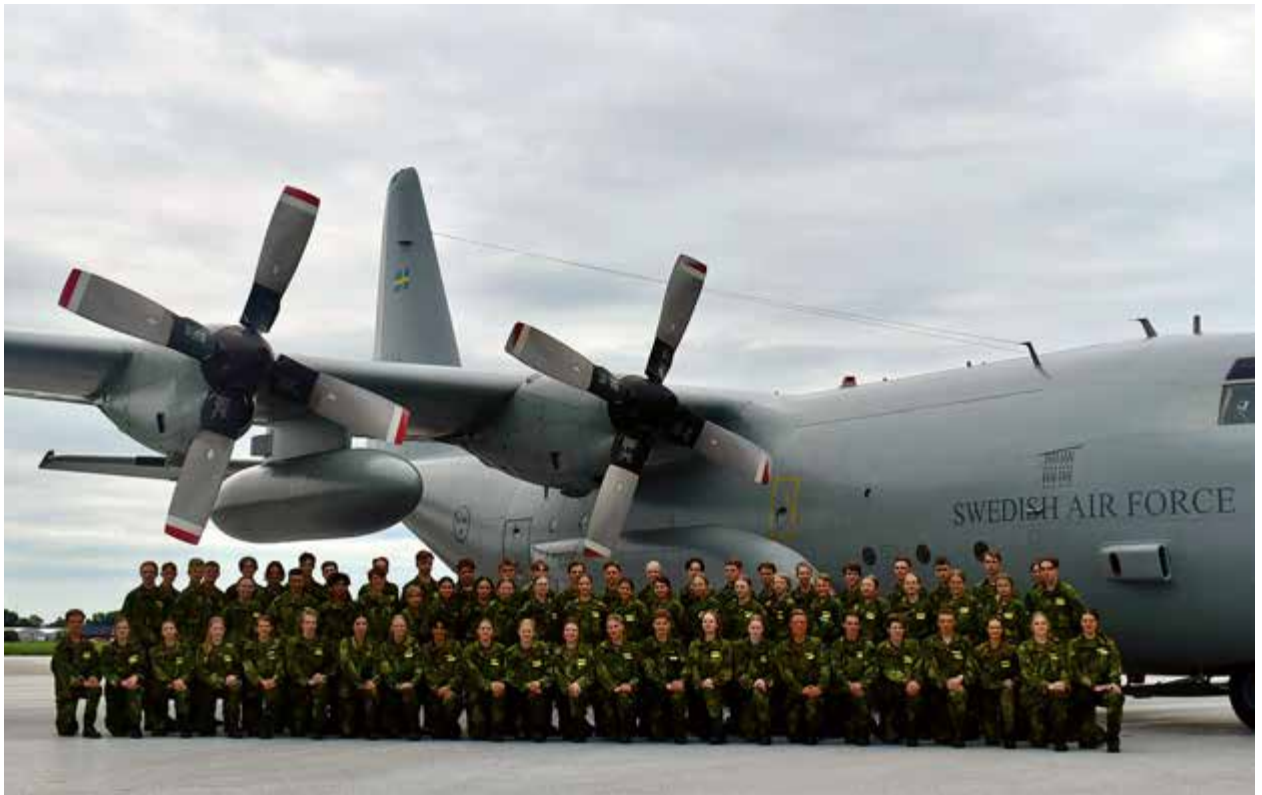
På väg mot Flygvapenmuseet i Linköping med Tp 84 Hercules.

och det går fort att få eleverna att gå i formation och lyda kommandon istället för att gå i klunga med händerna i byxfickorna. Varje gång det var förflyttning mellan olika verksamheter eller lektioner så skedde det under ledning av det som för värnpliktiga skulle kallas truppförande befäl, som med tydliga kommandon förde eleverna mellan de olika platserna.