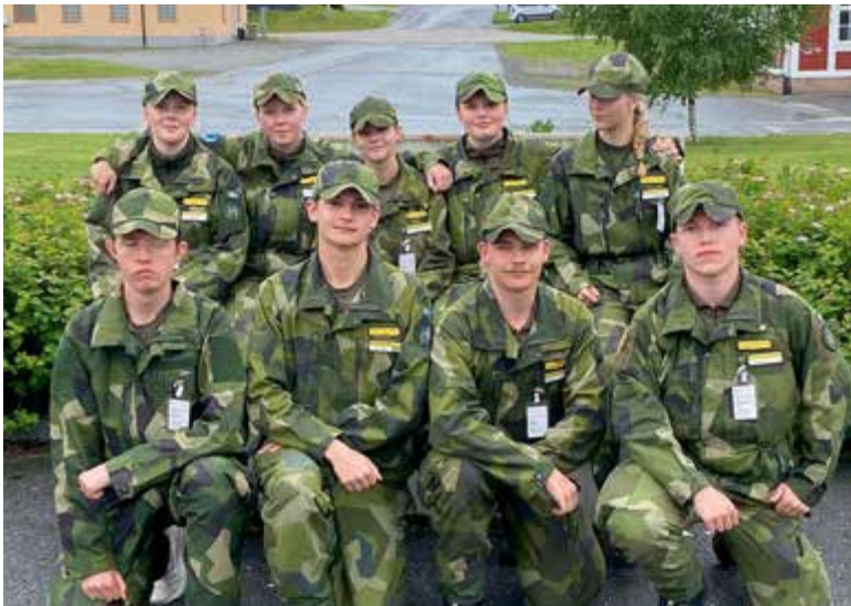
Region Nords lag.