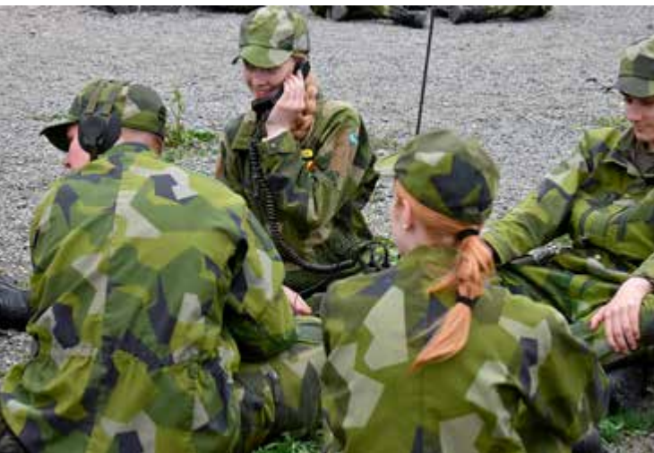
Konsten att hantera kommunikationsapparaten Radio 180.