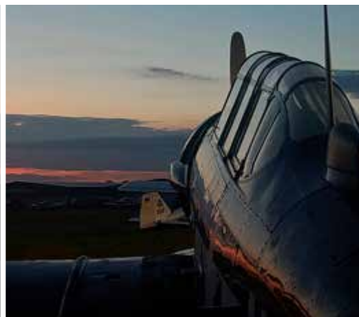
Flygning av Oldtimers vid Bienenfarm Airfield.