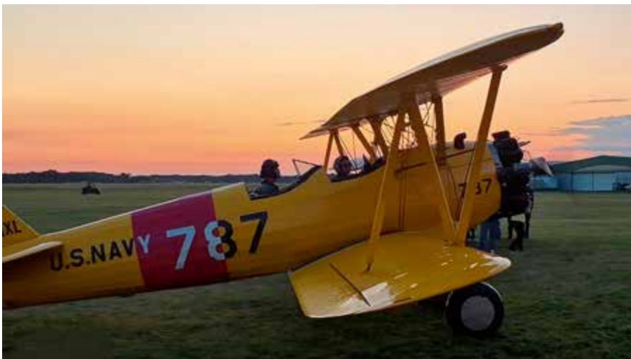
Oldtimers flygplan vid Bienenfarm Airfield.