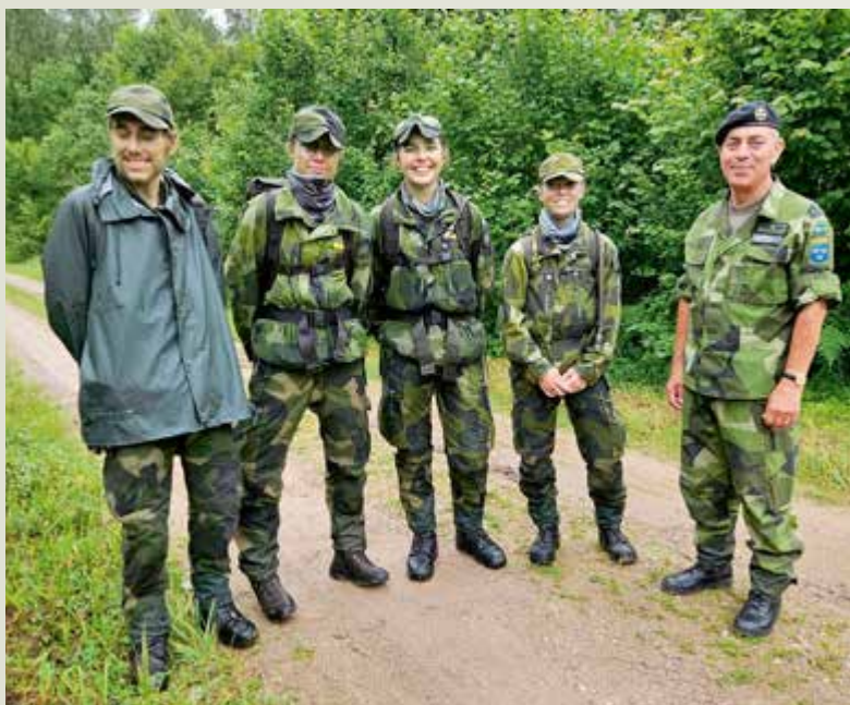
Glada deltagare som kämpat i Estland.

Jag fortsatte därefter till Ronneby och Sätenäs för att besöka sommarkurserna, vilka jag inte hann med förra året. Alltid lika roligt för mig att få se ungdomarna utbildas i vapentjänst och agera i fältförläggning. Sedan var det dags att åka till Paris med två kadetter för vårt första utbyte med Frankrike inom IACE, där jag följde besöket under de tre första dagarna. Frankrike driver ett väl fungerande program och det är uppmuntrande att se hur snabbt en grupp internationella ungdomar kan svetsas samman. Jag hade också möjlighet att delta vid avslutningsmiddagen för det svenska