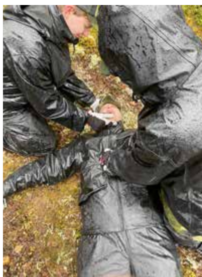
Övar HLR på skadad.