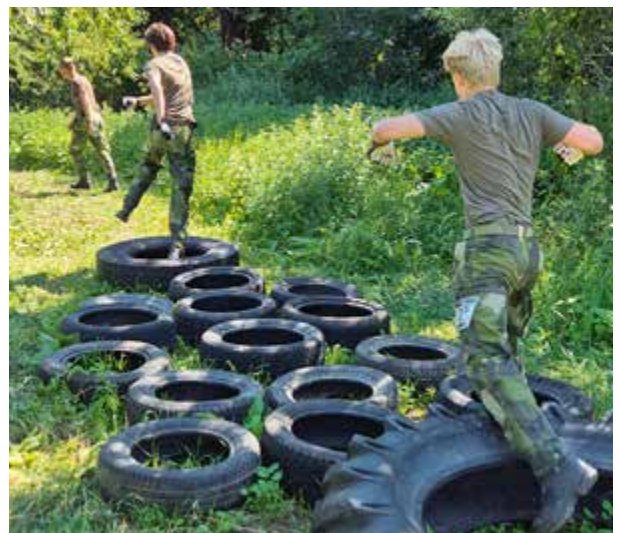
Har gäller det att trampa rätt och snabbt. Foto: Oliver Thorsteinsson.

THOMAS HILLEMAR/REGION MITT FOTO: OLIVER THORSTEINSSON OCH ELIN JANSSON