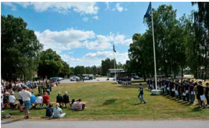
Avslutningsceremoni med anhöriga på gräsmattan utanför aulan. Självklart vajar FVRF flaggorna.

grupp och tillsammans lösa praktiska utmaningar. På kvällarna väntade gemensamma aktiviteter, ibland en grillning, ibland förberedelser inför nästa dags olika uppgifter.