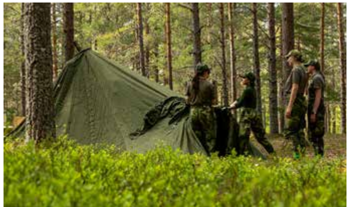
Ungdomarna reser förläggningarna.

TEXT: IDUN BLIXT MÅNBRO