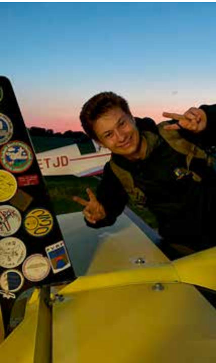
En glad kadett.