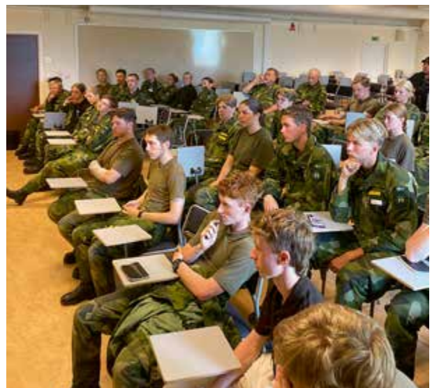
Utvärdering av kursen.

En av dagarna fick vi kasta precisionskast och träna på avståndsbedömning. Precis som tidigare varvade vi, så att ena gruppen sköt medan den andra tränade på de andra momenten. När vi skulle kasta precisionskast hade vi först ett kort övningsmoment. Därefter delades gruppen in i två lag och tävlade om vem som kunde sätta alla kast snabbast. Avståndsbedömningsövningen gick ut på att vi gick upp en bit på Hallstaberget, och