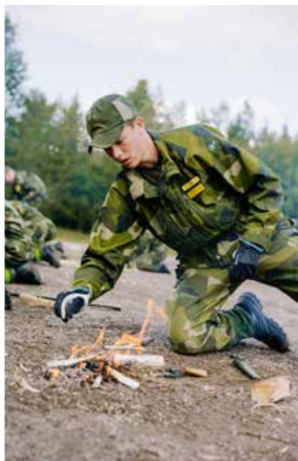
Konsten att gora upp eld, övning ger färdighet.