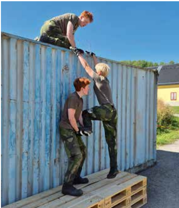
Höga hinder fodrar samarbete inom gruppen.