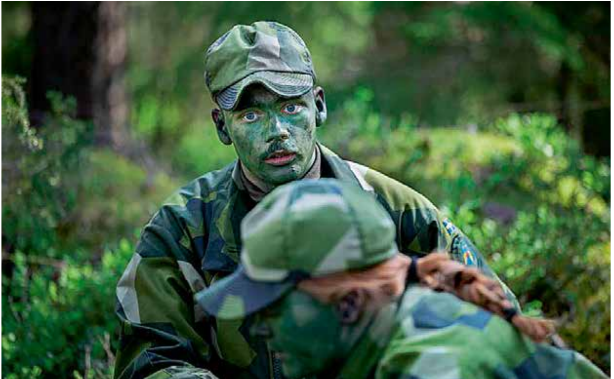
Med allvar i blicken.