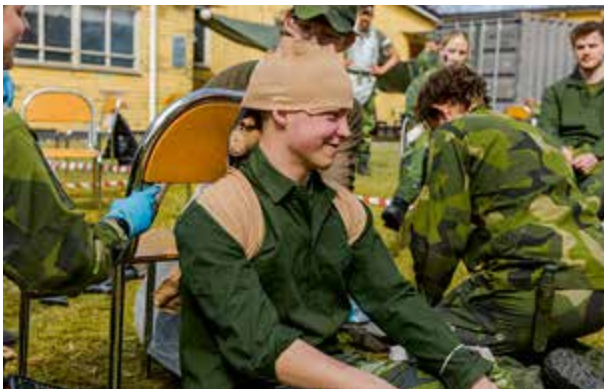
Omplåstrad och nöjd