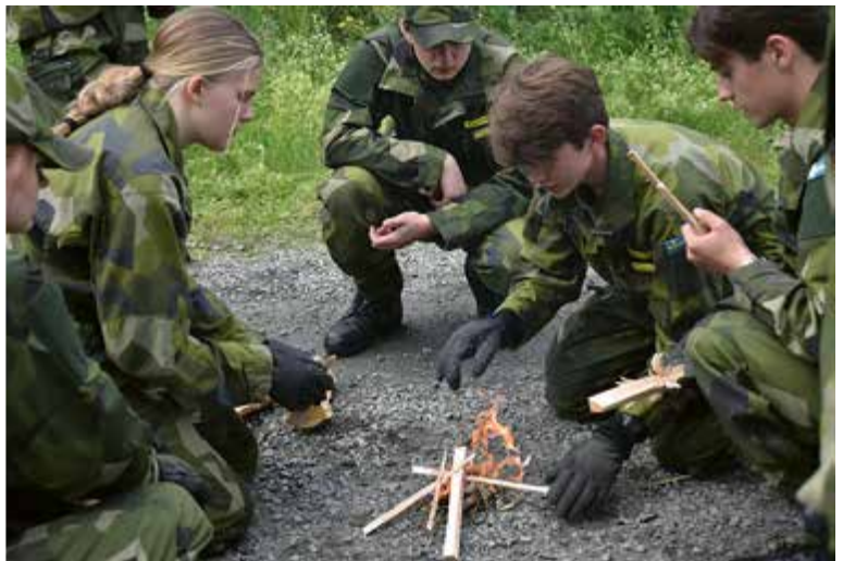
Tre komponenter behövs för att göra upp en eld - vet du vilka?

ordalagen, men med mycket glimt i ögat. Stort tack till er för er kreativitet!