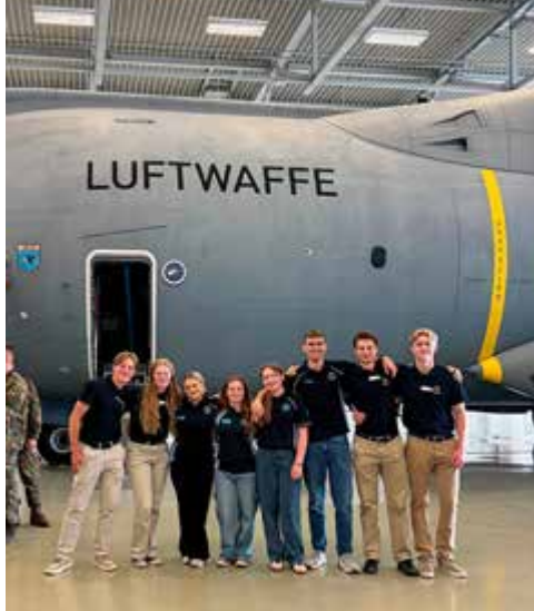
Studiebesök hos 62a luftrtransportenheten.