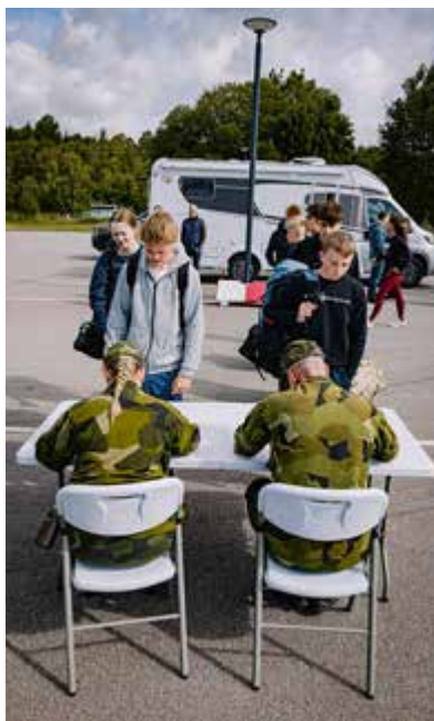
Inskrivning och lite nervöst.