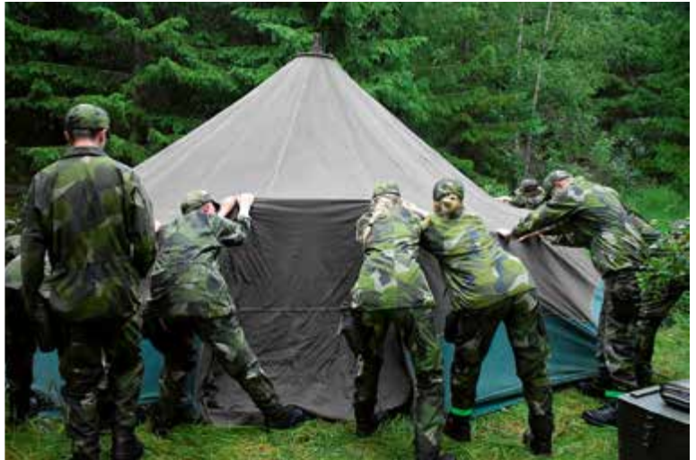
Vid resning av tält 20 hjälps man åt.