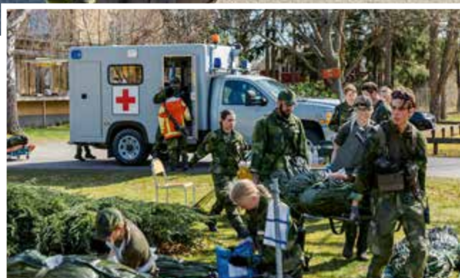
Även ambulansen får vara figurant.

Det var första gången som ungdomarna fick möjlighet att delta som skademärkare, något som har växt fram genom ett samarbete med sjukvårdsplutonen på 31.