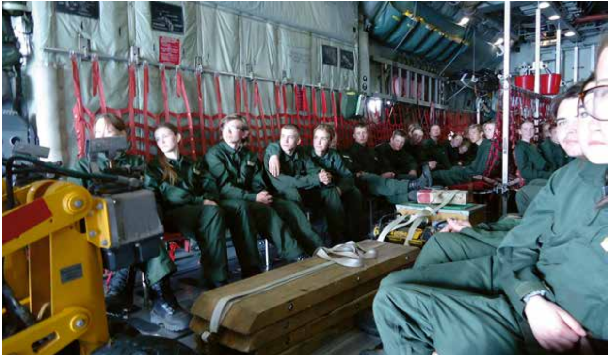
Här fick vi flyga i en Tp 84 Hercules, riktigt häftigt.

vår förläggning i våra tilldelade tältgrupperingsplatser. I slutet av den första fältdagen fick vi veta vår eldpost-schema. Som eldpost blir du väckt tio minuter tidigare för att sedan sitta post i en timma. Under nätterna fick man höra en och annan snarkning, och från någon hörde man ”köttbullar!”