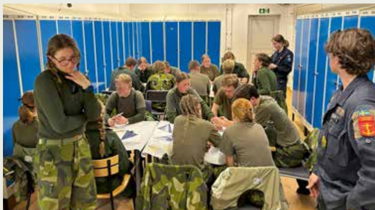
Det lokala samarbetet gav sjövärnsskåren möjlighet att undervisa i navigering.

Efter en natt i tältförläggning gick resan vidare mot Rosenholm, där ett realistiskt sjukvårdsmoment väntade. Scenariot var flera krockade fordon och skadade kamrater vilket ställde krav på både samarbete och snabb problemlösning.