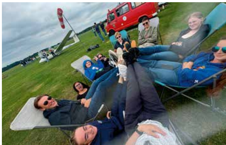
Umgående på flygfältet