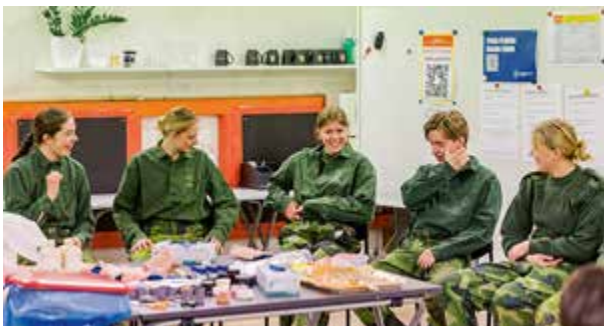
Teorilektionen är också viktigt.