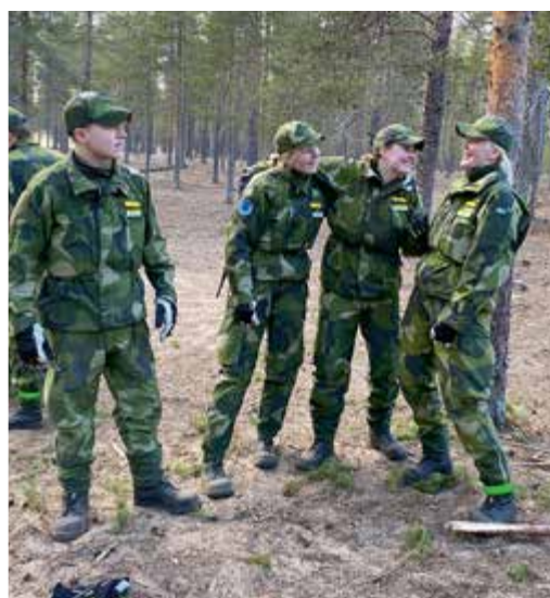
Det är roligt ute i fält.