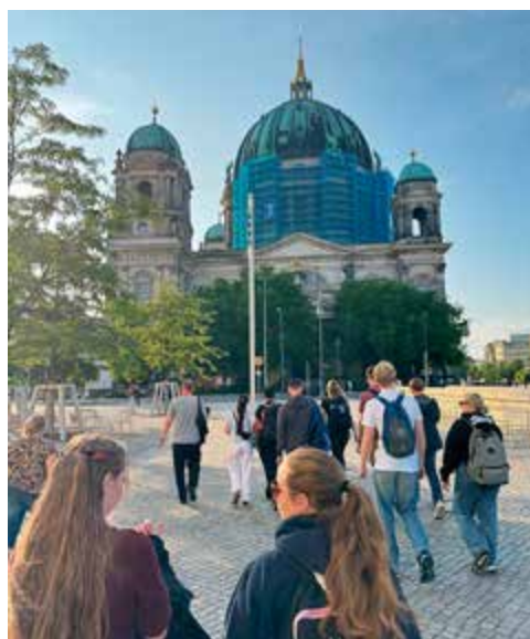
Guidad rundtur i Berlin: Foto Oskar Håkansson.