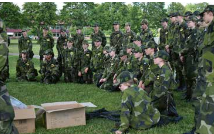
Här ges instruktioner inför kommande övning.