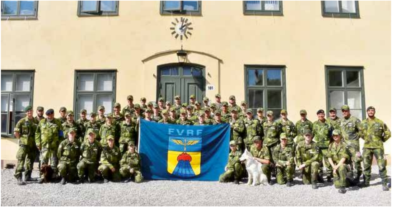
Flygvapenfrivilligas lag och ledare samlade för gruppbild.