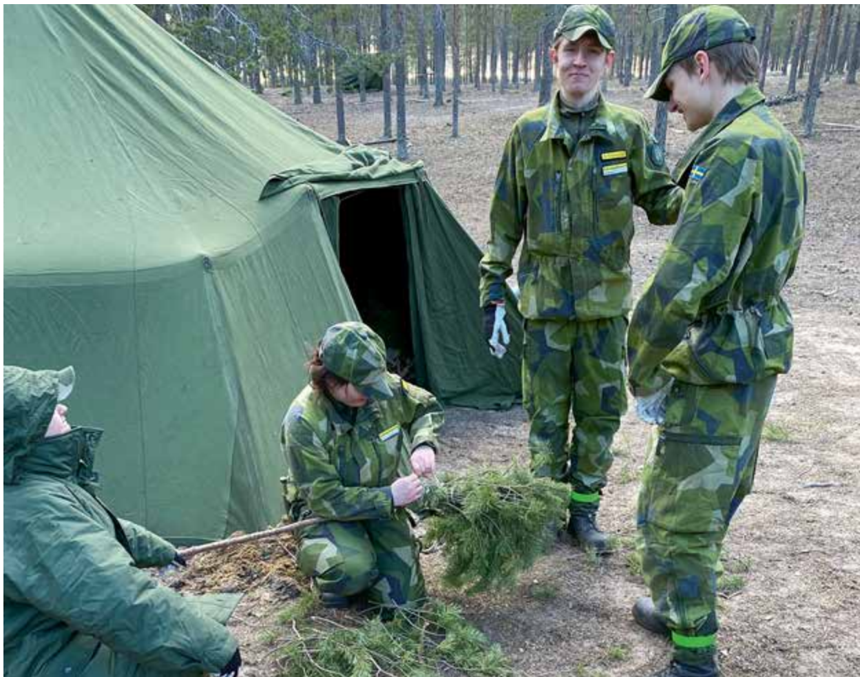
Tillverkning av Ruska lång.