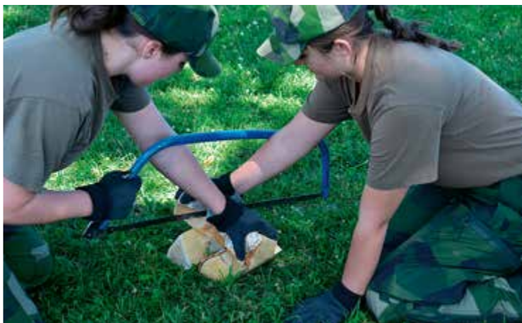
Alltid bra att samarbeta.

Det är tisdag veckan efter midsommar. De flesta 16- och 17-åringar har sommarlov och är lediga eller har sommarjobb. I motsats till dessa har 78 ungdomar i stället valt att tillbringa tio dagar på F 16 i Uppsala för att genomföra Flygvapenfrivilligas sommarkurs i Flygvapnet. I stället för ledighet har de valt att få leva i grönkläder, bo på kasern eller ute i skogen i Tält 20 och uppleva allt annat som är unikt för Försvarsmakten.