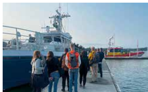
Ombordstigning på Kustbevakningens fartyg.