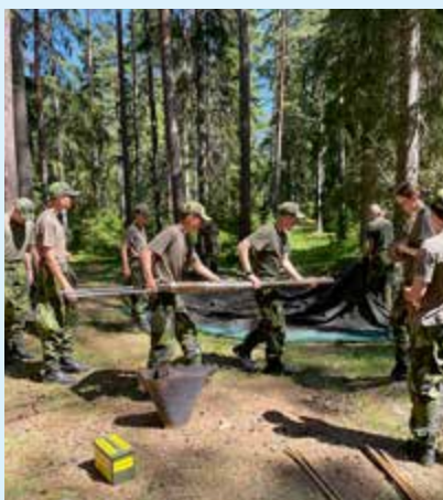
Alla hjälps åt för att det ska gå så snabbt som möjligt.

PS. Mycket kul dag när vi besökte sommarkursen i Öst. Det var inspirerande att se både ungdomarnas och instruktörernas engagemang. Tack för en fin dag hos er!