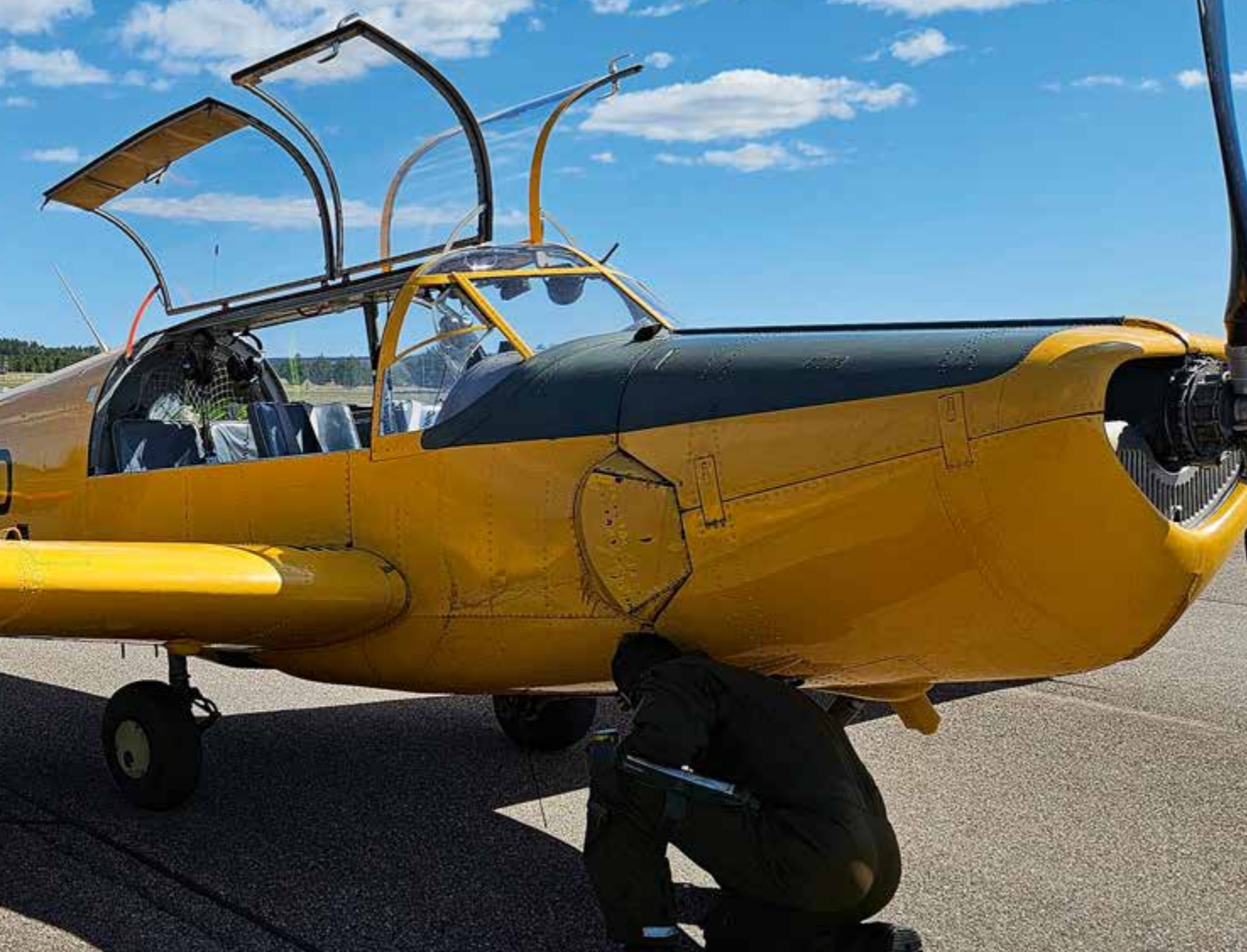
Väntan innan flygningen med SK50. Foto: Mats Karlström (från 2024).

eller att ta ut en MGRS koordinat på platsen. Alla moment under marschen var delar av en tävling, så det lag som lyckats med flest utmaningar och utförde hela uppgiften vann. FK-eleverna sov ute varje natt, en natt i tält och de andra två nätterna i bivacker som vi själva byggde.