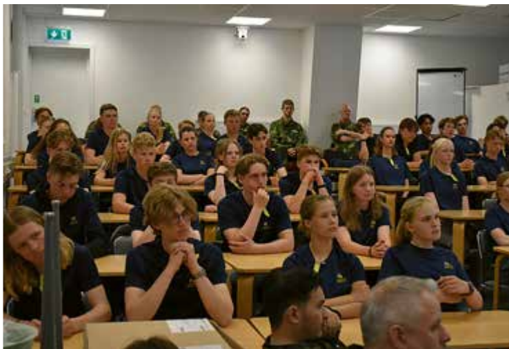
Lektioner i klassrummet.

Och vad är väl en sommarkurs i Flygvapnet utan flygning? Denna gång hade vi turen att få åka med Tp 84 Hercules från F 16 till Linköping. Där väntade ett besök på Flygvapenmuseum. Förväntansfullt gick eleverna runt och såg specialutställningen om när Sverige var aktivt inblandat i Kalla kriget, då ett signalspaningsplan - DC 3'an - blev nedskjutet över Östersjön. Efter ett antal timmar på museet bar det av hemåt igen med Tp84.