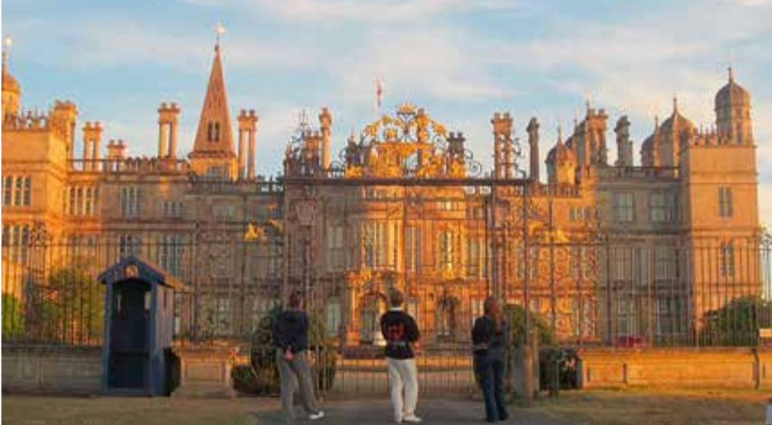
Utanför Burghley House vid Battle of the Proms.