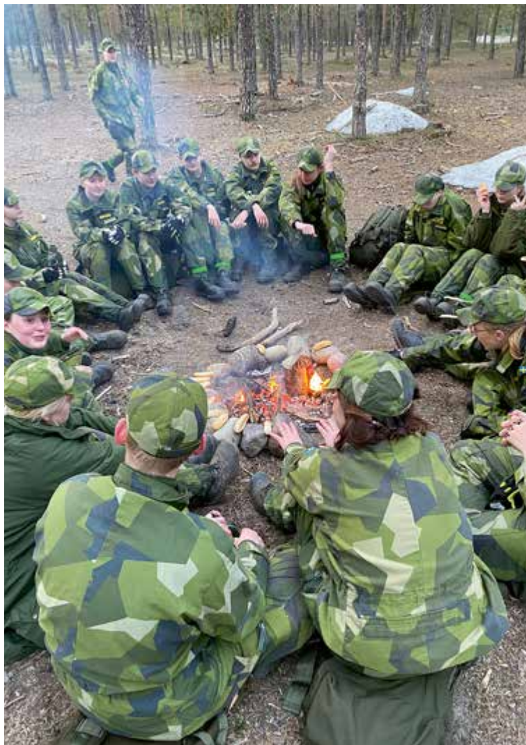
Samling kring elden.

TEXT: IDUN BLIXT MÅNBRO