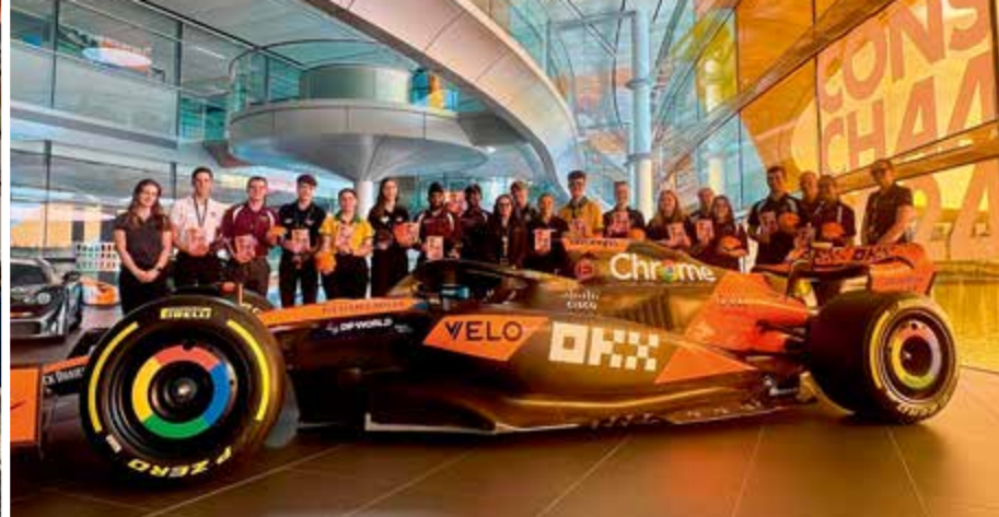
Några av ungdomarna fick göra ett besök hos McLaren Technology Centre.