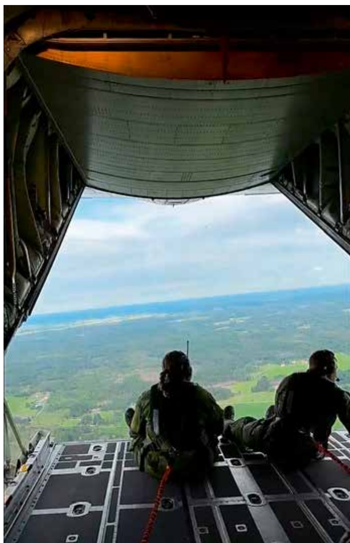
Riktigt fin utsikt.

Efter middagen väntade spex som våra glada ungdomar förberett. Jag tror att de flesta av instruktörerna på något sätt blev omnämnda - kanske inte alltid i det mest smickrande