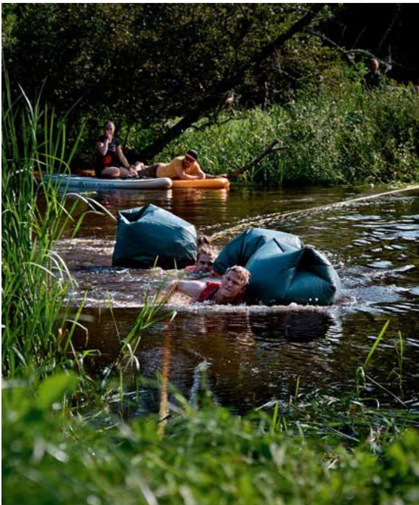
Sista biten simmar vi mot mål.