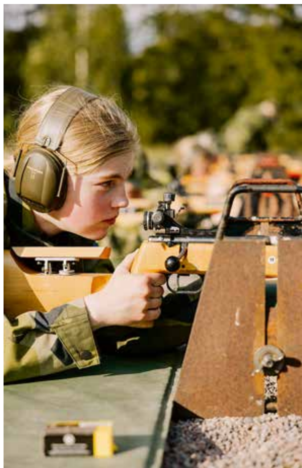
Siktet är inställt på skjutbanan.

Tidigt under kursen fick ungdomarna, med Försvarsmaktens värdegrund som utgångspunkt, formulera sin egen policy för hur de ville ha det tillsammans. Resultatet blev inte bara ord på ett papper, utan ett