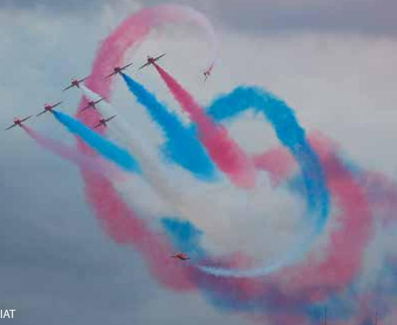
Flyguppvisning av RAF Red Arrows på RIAT

IACE, eller International Air Cadet Exchange , är ett utbyte där ungdomar, från sina respektive motsvarighet till FVRF möts, lär känna varandra och blir en del av en resa som aldrig glöms. Till värdlandet England kom kadetter från Australien, Belgien, Frankrike, Sverige, Tyskland och USA.