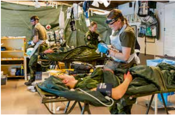
Figurant i fältsjukhus.