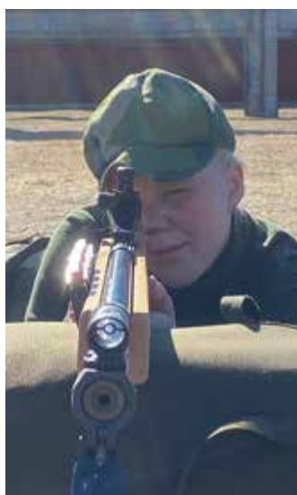
Skjutträning med 22 lång.