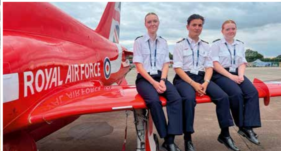
På vingen av en Red Arrow på RIAT.

Den första veckan tillbringades mycket tid i buss eftersom det var många besök på olika RAF baser och museer. Bland annat fick vi se RAF College Cornwall, en officersskola inom det brittiska flygvapnet. Här bjöds det på spänning när brandlarmet gick igång och brandkåren fick rusa in. Lyckligtvis var det bara en brödrost som hade rykt och det visade sig vara ett falskt alarm.