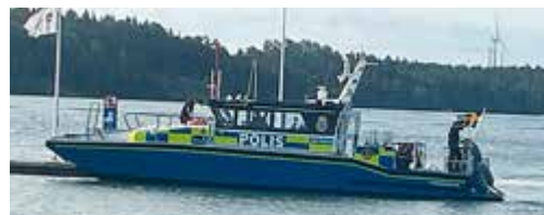
Polisbåt var med på övningen.