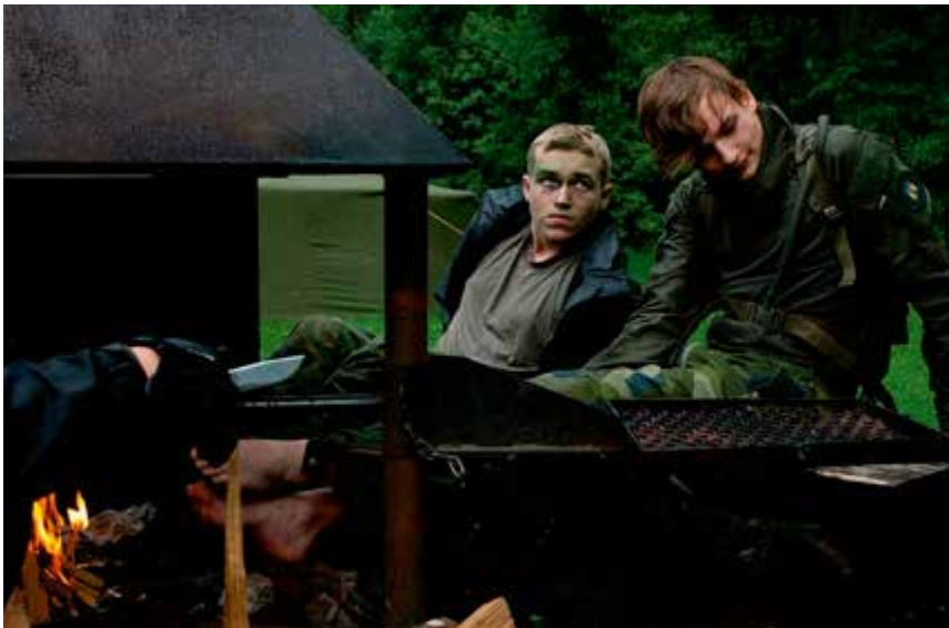
Återhämtar sig vid elden.