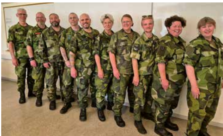
Deltagare IKUP juni 2025.

– Innan kursen var jag lite orolig att jag inte hade tillräckliga baskunskaper, men det var obefogat. Stöd i arbetslaget och från instruktörer gör att man känner sig