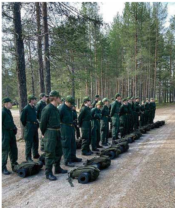
Avdelning 2 uppställda på linje.

I sommar hölls en kurs för ungdomar på F 21 i Luleå. De antagna delades upp i två plutoner som tilldelades olika aktiviteter och uppdrag vilka genomfördes exemplariskt enligt båda plutoncheferna.