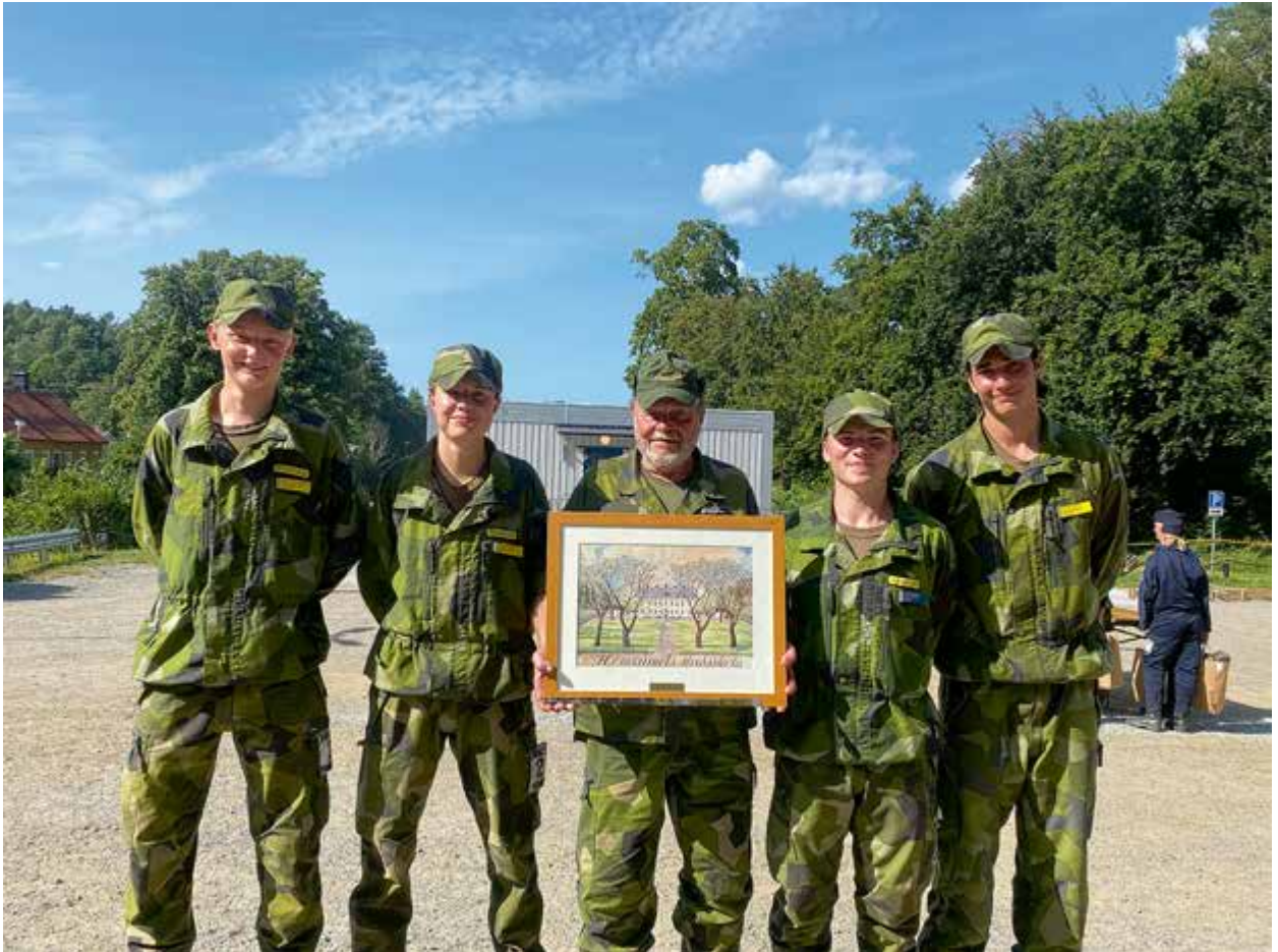
Grattis till vinnarlaget av Mixklassen.