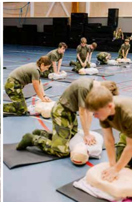
Sjukvårdsutbildning är alltid en viktig del av sommarkursen.