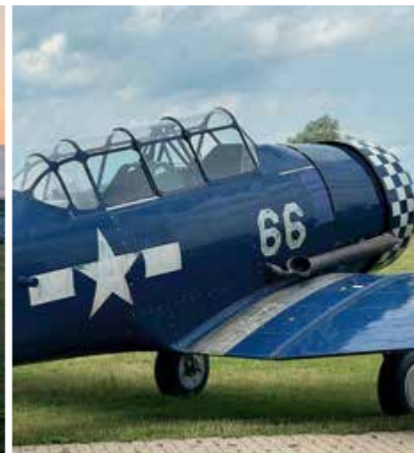
Flygning av Oldtimers vid Bienenfarm Airfield: Foto: Oskar Håkansson.