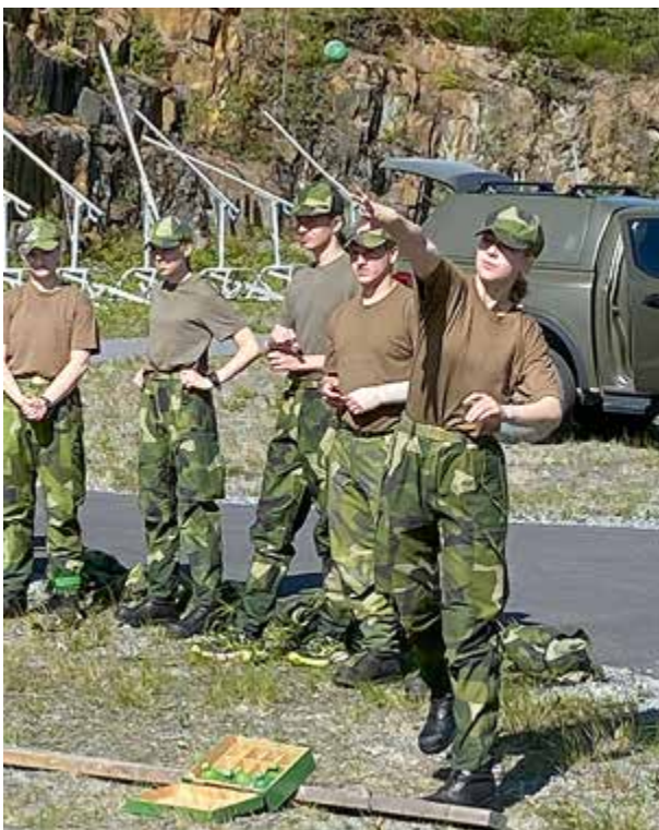
Övar på precisionskast.

En av dagarna fick vi kasta precisionskast och träna på avståndsbedömning. Precis som tidigare varvade vi, så att ena gruppen sköt medan den andra tränade på de andra momenten. När vi skulle kasta precisionskast hade vi först ett kort övningsmoment. Därefter delades gruppen in i två lag och tävlade om vem som kunde sätta alla kast snabbast. Avståndsbedömningsövningen gick ut på att vi gick upp en bit på Hallstaberget, och