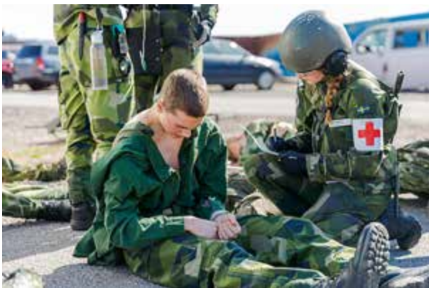
Skadad blir omhändertagen.