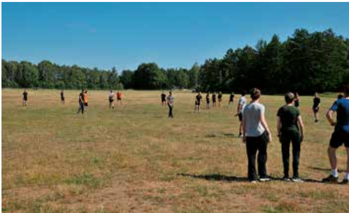
Näst sista dagen efter en gedigen vård så körde vi en avslappnad match i brännboll innan avslutningsmiddagen.