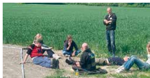
Figuranter som återhämtar sig.