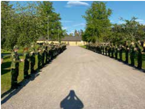
Uppställning i väntan på PK.