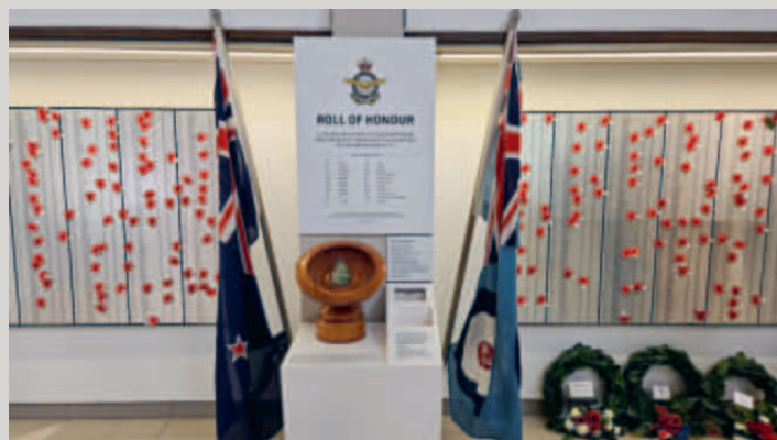
Minnesplats för stupad flygande personal på Air Force Museum of New Zealand, Wigram airfield circuit i Christchurch.