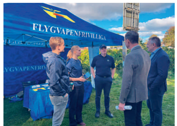
Landshövdingen Kalmar län besöker montern.

På återseende - Öland, den 26 september 2026!