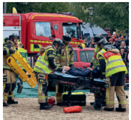
Förevisning av räddningstjänsten.

Under lördag v537 anordnade blåljusmyndigheterna och Länsstyrelsen i Jämtlands län en aktivitetsdag i Badhusparken i Östersund. Ett stort antal organisationer och myndigheter ordnade med information, uppvisningar, aktiviteter och en tipspromenad - allt i syfte att sprida kunskap och skapa intresse för totalförsvaret och dess olika yrken och frivilliguppdrag.