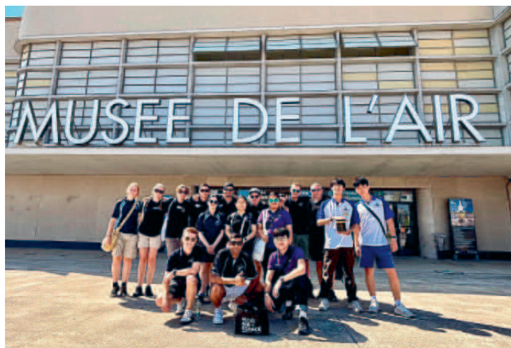
Gruppbild framför Musee de L'air et de l'Espace, Paris.

TEXT OCH FOTO: ELIN HYENSTRAND OCH EMELIE OLOFSSON