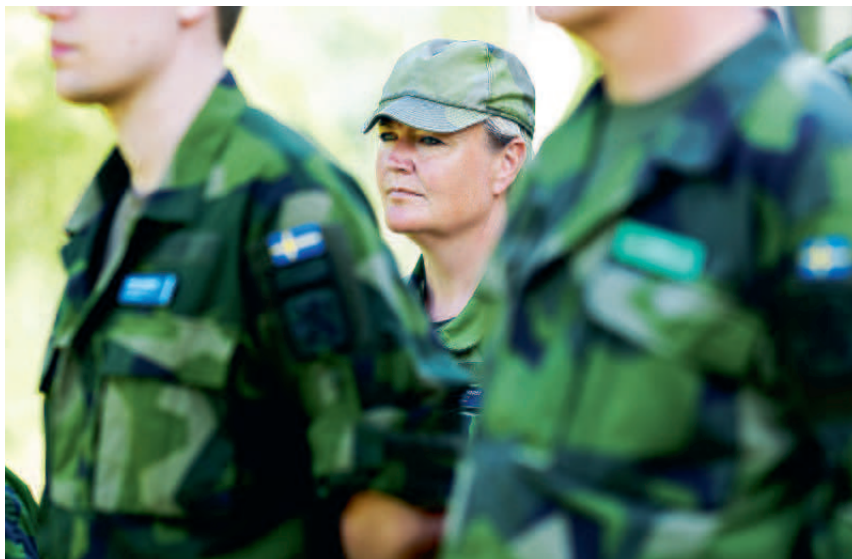
Uppställning inför fysövning.

Men det är ett högt tempo för att hinna med. När Brukshunden kommer på besök har dag fem just börjat.