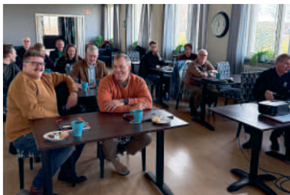
Arbetsgrupperna Syd samlade.