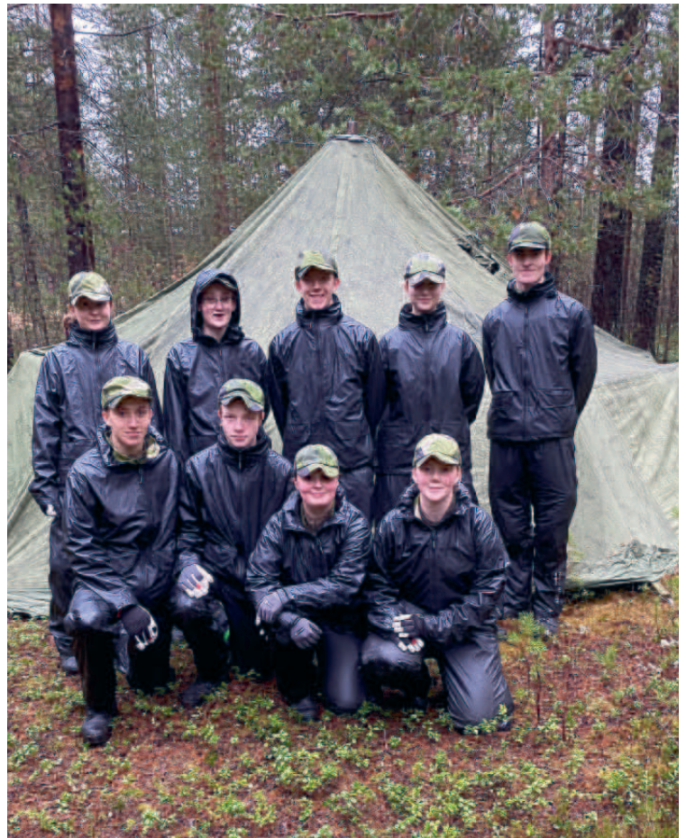
En grupp framför sin förläggning.