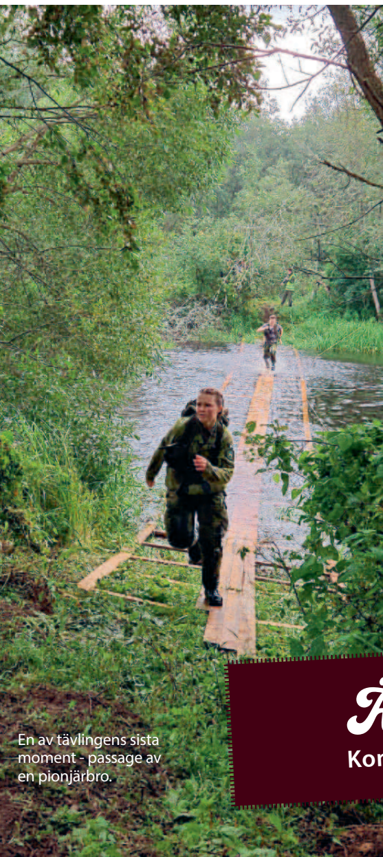
En av tävlingens sista moment - passage av en pionjärbro.

Vill du åka till Estland och tävla i ungdomstävlingen "Kuperjanovlaste rada" ?