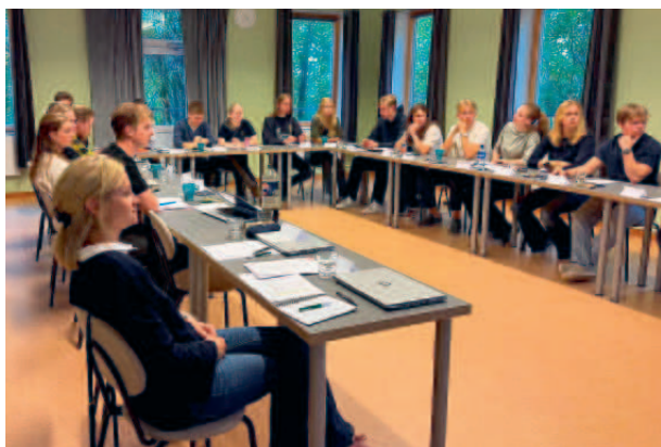
Mycket bra diskussioner under helgen.

På kvällen samlades alla för att gemensamt njuta av en fantastisk middag, där deltagarna hade möjlighet att prata, umgås och ladda energi inför det sista passet för dagen.