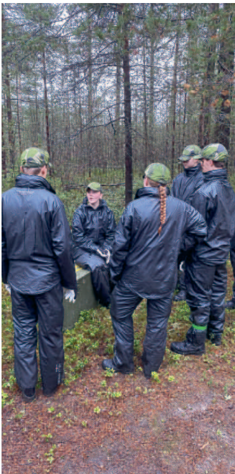
Diskussion om uppsättningen av förläggning.