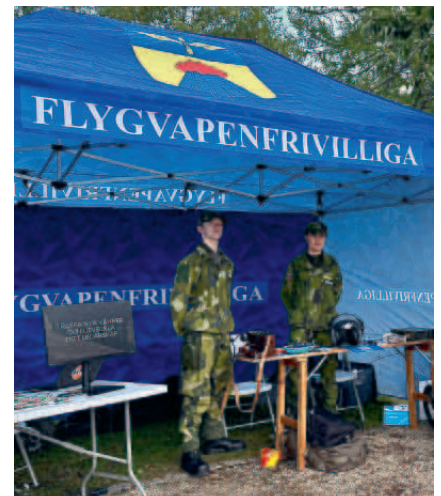
Rekrutering i FVRF tältet.

Flerta frivilligorganisationer fanns på plats och Försvarmakten visade upp verksamhet, fordon och olika sätt att bli en del av totalförsvaret. Dessutom var Luftfartsverkets SAR-helikopter på plats, där intresserade fick titta och ställa frågor.