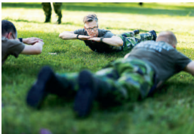
IK fysövning 5.