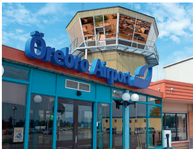
Örebro flygplats.