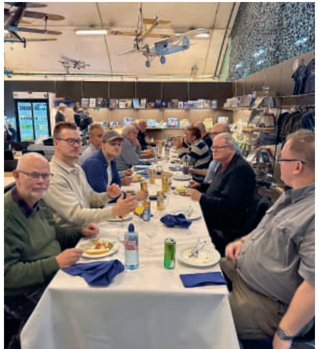
Så blev det dags för en god lunch.