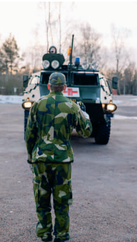
Fordon leds in till skadeplatsen av ungdom.