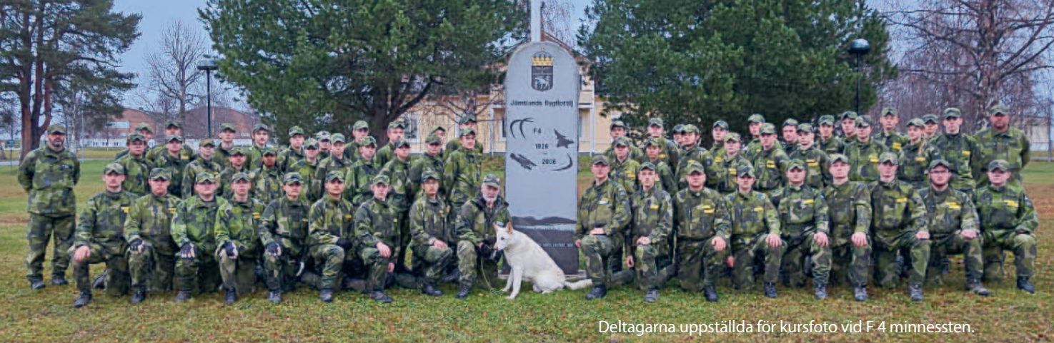
Deltagarna uppställda för kursfoto vid F 4 minnessten.