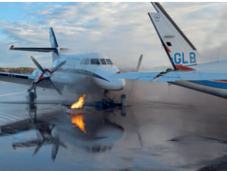
Scenario - flygplan havererar vid landning.