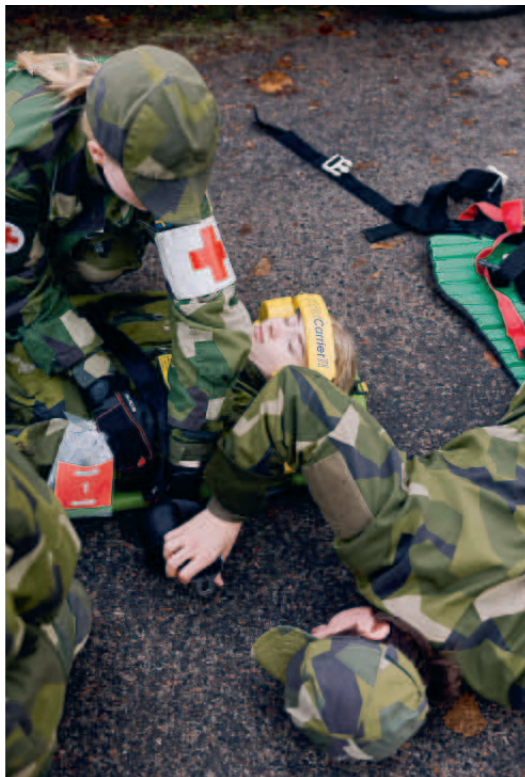
En eventuell nackskada säkras.