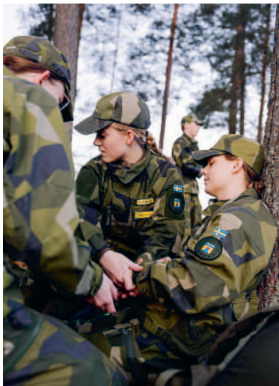
FK-elever genomför omhändertagande av skadad.