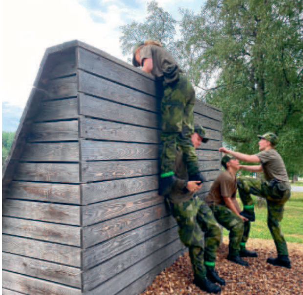
Stridshinderbana - övning ger färdighet.