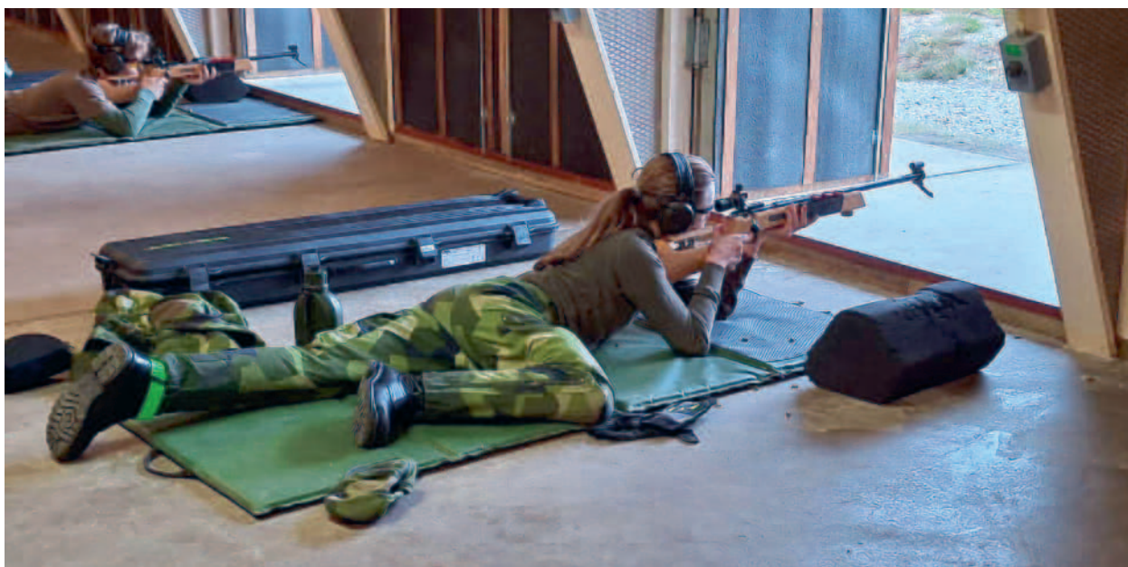
LK skjuter 22 för både ungdomsidrottsmärke samt tvågrensmärket.

Hösten har bjudit på två fullspäckade ungdomshelger i FVRF Syd - med allt från skytte och sjukvård till fältförläggning och orientering. Gemenskapen har varit stark, vädret varierande, och lärandet konstant.