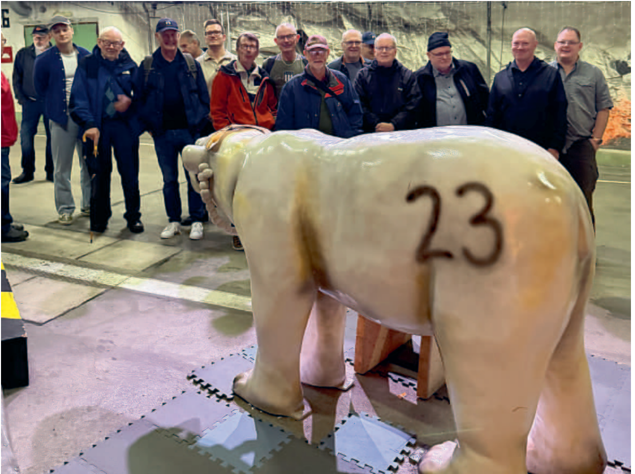
Gruppbild vid Isbjörn nr 23.