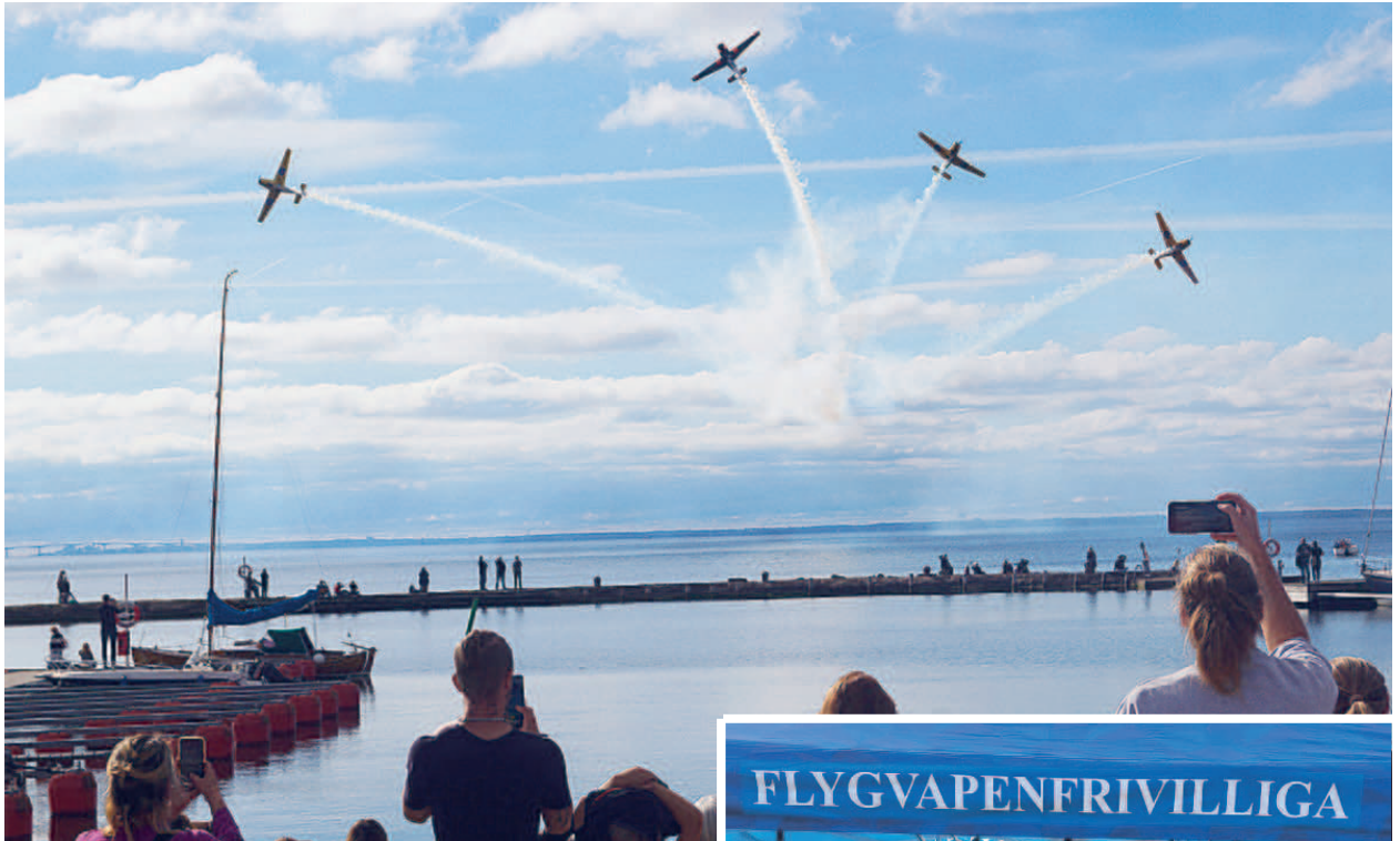
Team 50 uppvisningsprogram.