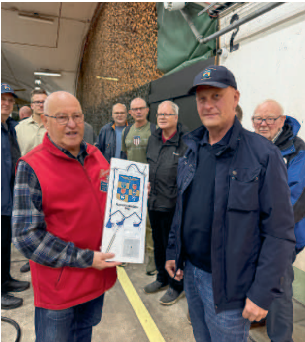
Syd ordförande överlämnar vårt standar.