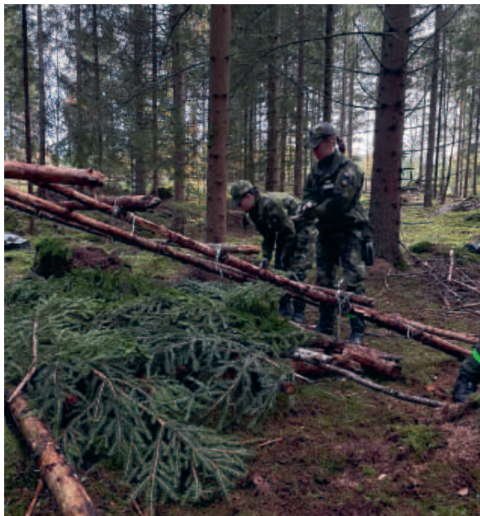
PK konstaterar att det behövs mycket granris till bivakerna.