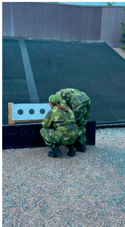
Ungdomarna markerar träffbilderna.