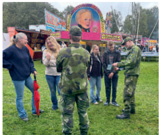
Mingel och information på Kanalens Dag.

På annan plats i tidningen kan du läsa om region Syd som deltog på Totalförsvaret Öland 2025. Redaktörens anm.