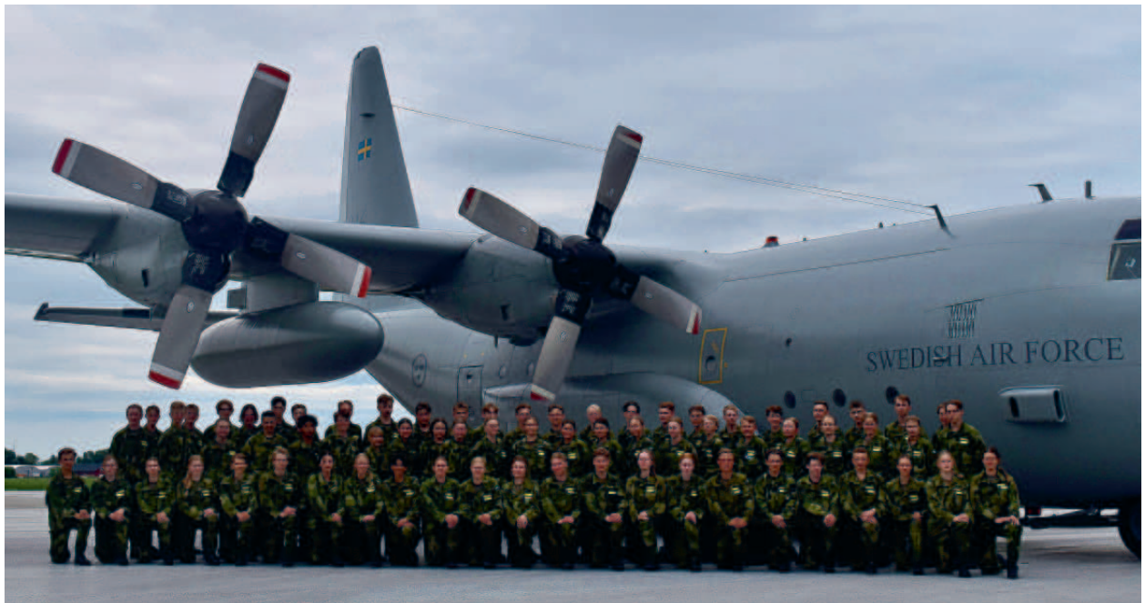
Gruppbild inför flygtur med TP 84 Hercules, sommarkurs Uppsala.

Instruktörskurs Handledare genomfördes under hösten på F 17 med 11 deltagare. Även här ser vi ett ökat intresse från övriga FFO:er.