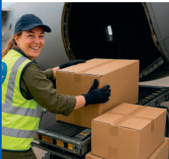
Behjälplig vid lastning.

rekryterar personal och funktionärer till Förstärkningsgrupp Örebro flygplats!