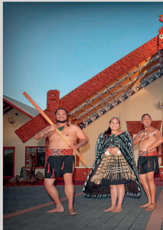
Powhiri, traditionell valkomst ceremoni NZ.

Flygvapenfrivilliga deltog under en vecka i september på IACEA:s (International Air Cadet Exchange Association) årliga konferens, som i år arrangerades på Nya Zeeland. Evenemanget samlade delegater från ett stort antal medlemsländer för att stärka samarbetet kring internationella ungdomsutbyten med fokus på flyg i alla dess former, kamratskap och kulturellt utbyte. Under konferensen valdes, som brukligt är, även en ny styrelse.