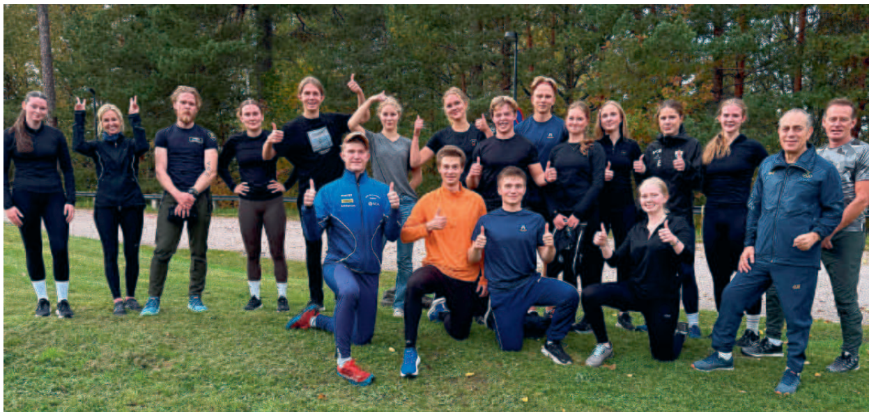
Skönt med en paus och lite frisk luft.