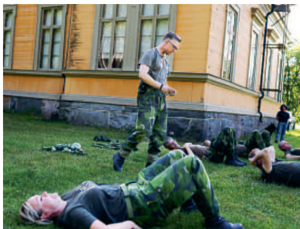
Fysövning på Marma.

I sommar blir det en intensivkurs där man under 14 dagar avverkar båda kurserna. Något som annars tar sammanlagt 20 dagar. Nu slipper man extra in- och utresedagar och repetitioner i inledningen av IK 2.