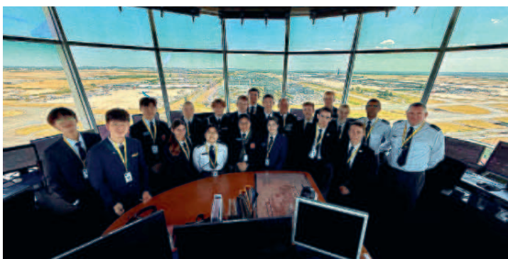
Flygledartornet på Charles De Gaulle, sett innifrån.