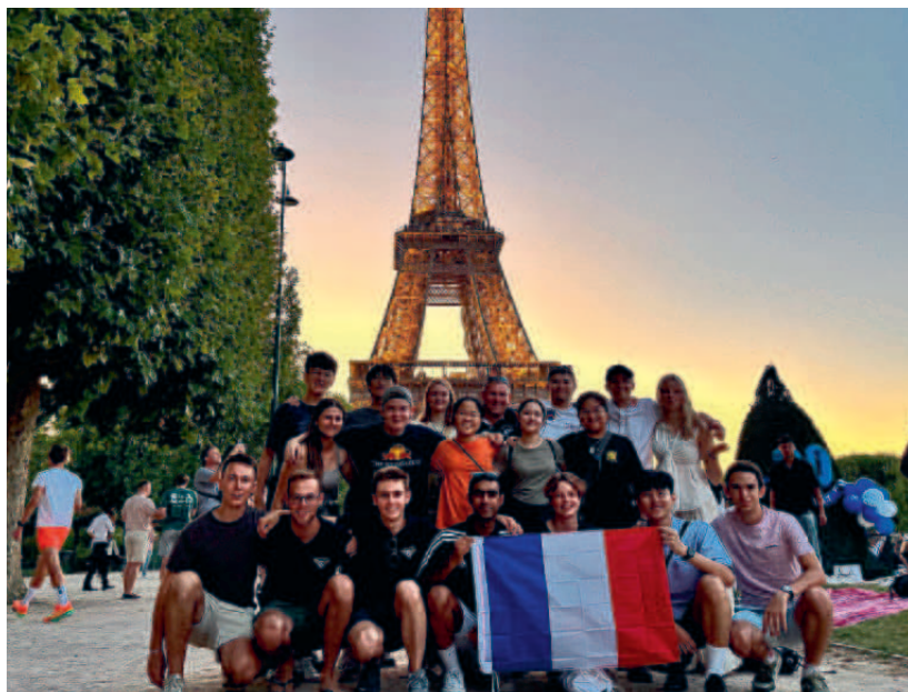
Gruppbild framför Eiffeltornet.

Man skulle kunna säga att det bästa med hela resan var att paddla i Pyrenéerna med dess klarblåa vatten omringat av berg. Men efter många oväntade dopp,