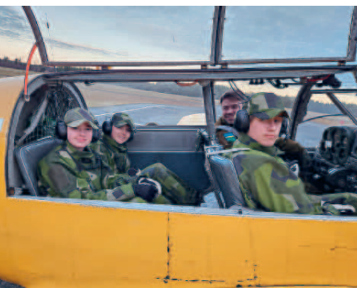
GK-elever redo för flygning med SK50.