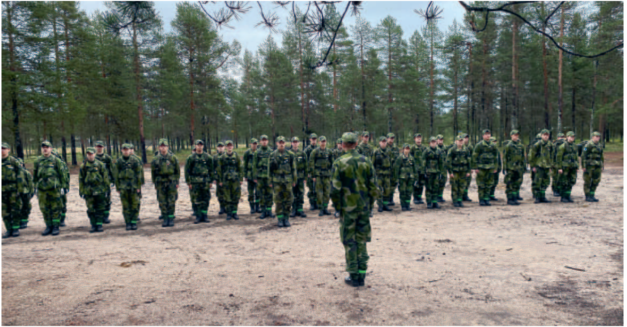
Avlämning till befäl.