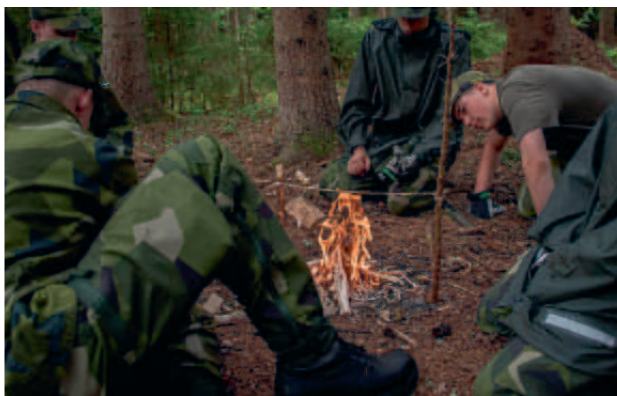
Under kursen får deltagarna bland annat lära sig många nya saker, bland annat göra upp en eld.