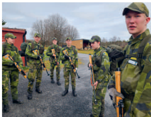
PK är redo för skytte med ungdomsvapen 22.long.