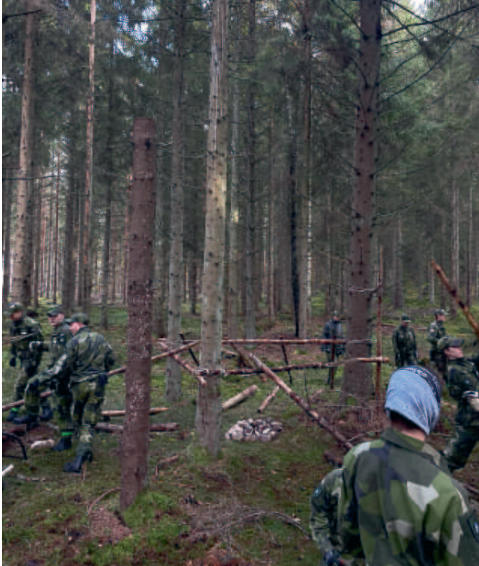
PK bygger förläggning i form av bivak.