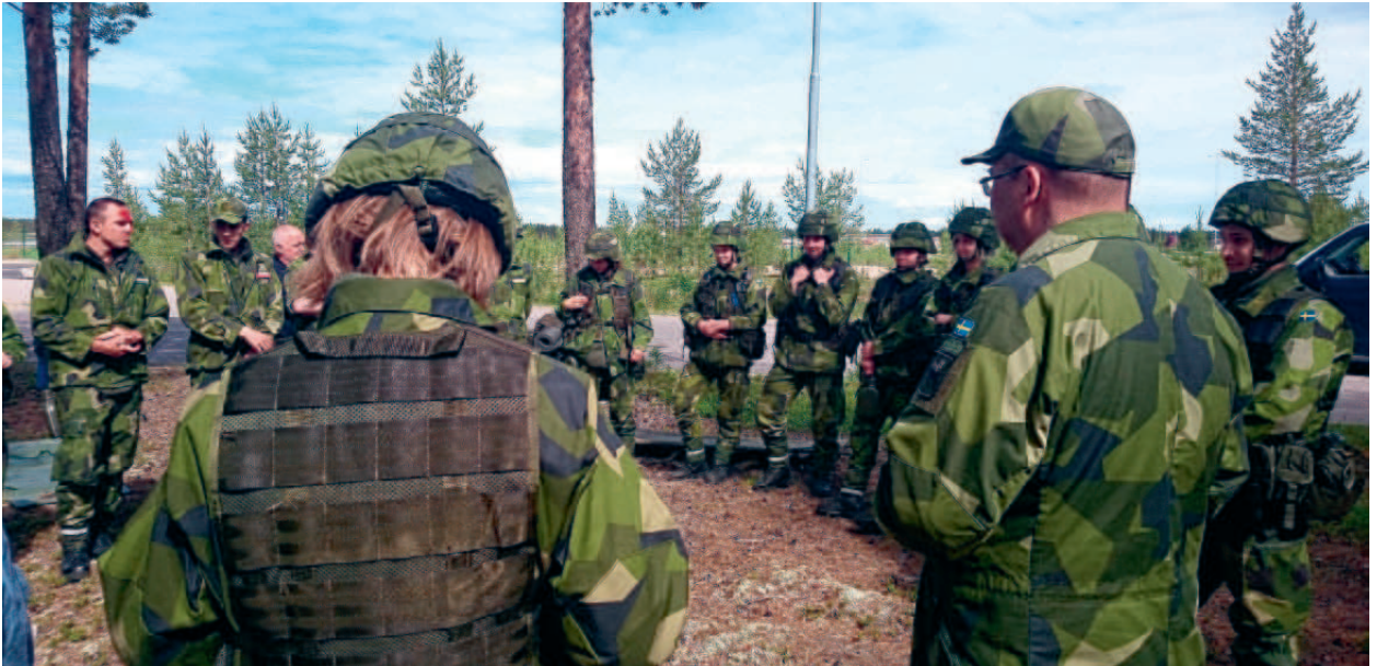
Genomgång vid instruktörsutbildning.

Utbildningsåret 2025 blev ett starkt år för FVRF! Med omfattande instruktörs- och ungdomsutbildningar över hela landet, ser vi att intresset för våra kurser ständigt ökar.