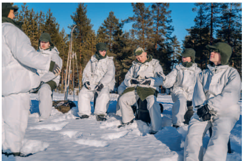
Rast i vintersolen, vinterkurs 2025.