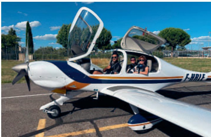
Flygdag i Montpellier.

Slutligen vill vi tacka våra franska värdar och alla andra som gjort resan så fantastisk. Förhoppningsvis ses vi igen. Tills dess, au revoir, la France!