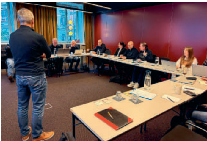
Ordförande i RFS samt deltagarna.