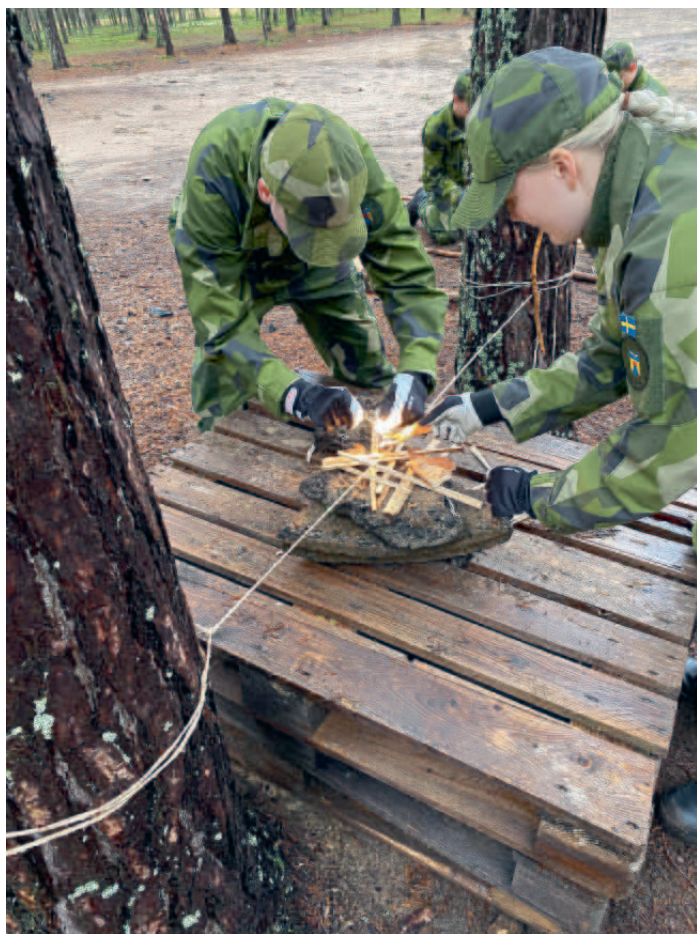
Bränna av snöret.

Redaktörens anmärkning - MIST Mechanism of injury – Injuries – Signs – Treatment → Metod för att rapportera skademekanism, konstaterade skador, vitala parametrar och givna behandlingar.